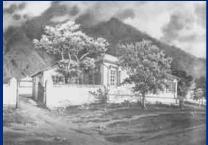
Дом Верзилиных в Пятигорске.

Кавказскому городу Пятигорску было суждено сыграть роковую роль в жизни поэта: здесь, кроме прочих старых знакомых, Лермонтов находит своего товарища по Школе юнкеров Мартынова. На одном из вечеров в пятигорском семействе Верзилиных шутки Лермонтова задели Мартынова. Ссора повлекла за собой вызов; не придавая значения размолвке, Лермонтов принял его, не намереваясь стрелять в товарища.