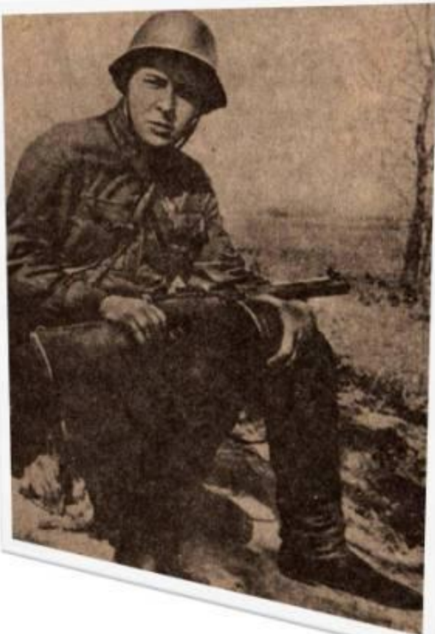
А. Гайдар на фронте. 1941 год.