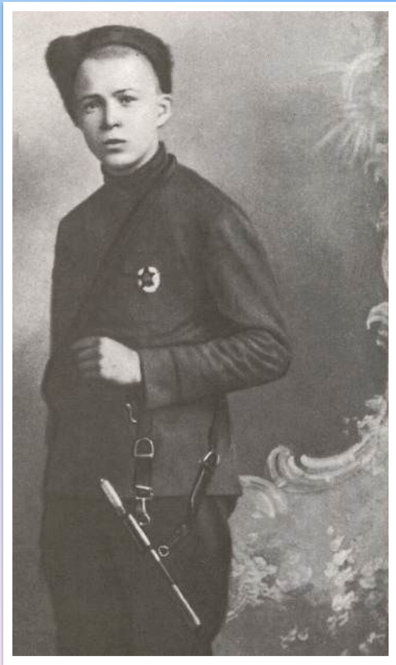
А. Гайдар. 1919 год.