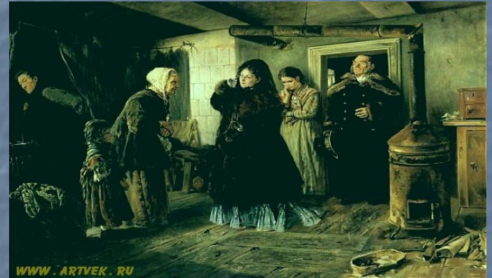
Социальный срез общества