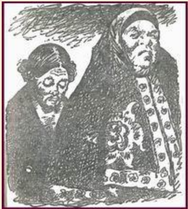
Иллюстрация А. Скородумова

Прозвище героини могло быть образовано от двух слов, которые в равной степени глубоко соответствуют сути её характера, либо – дикая свирепая свинья, либо кабан – глыба льда. Жестокость, свирепость и холодность, равнодушие этой героини очевидны. Кроме того, Марфа – «наставница». Интересно, что в переводе с арамейского имя Марфа переводится как «госпожа». Игнатий – «неизвестный, сам себя поставивший».