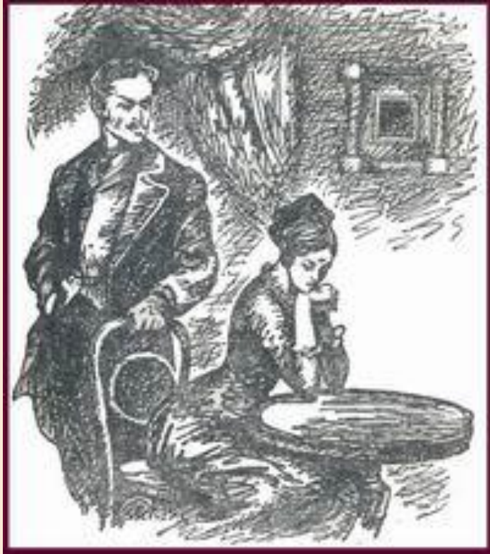
Иллюстрация А. Скородумова

Сергей Сергеевич Паратов – звучное сочетание имени и отчества этого героя дополняется значащей фамилией.