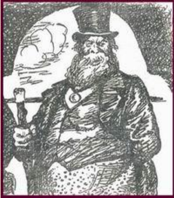
Иллюстрация А. Скородумова

Дикой в северных русских областях обозначало «глупый, шальной, безумный, малоумный, сумасшедший», а диковать – «дурить, блажить, сходить с ума». Первоначально Островский предполагал дать герою отчество Петрович (от Петр – «камень»), но крепости, твердости в этом характере не было и драматург дал Дикому отчество Прокофьевич (от Прокофий – «успевающий»). Это более подходило жадному, невежественному, жестокому и грубому человеку, который в то же время был одним из богатейших и влиятельных купцов города.