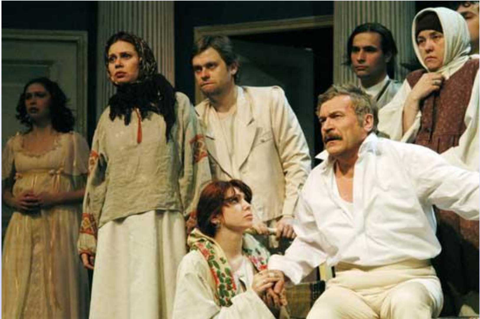
Сцена из спектакля саратовского театра