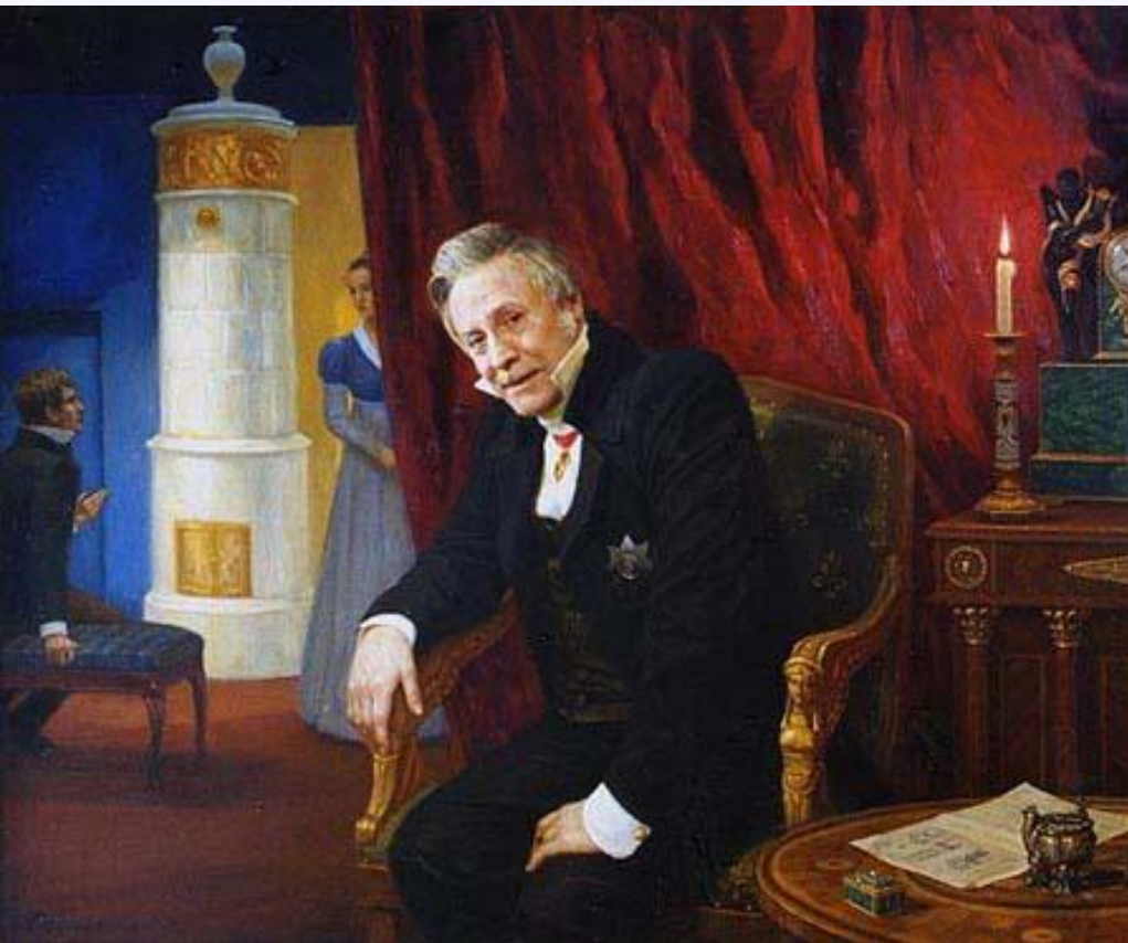
Юрий Соломин - Павел Афанасьевич Фамусов.

Фамилия Павла Афанасьевича Фамусова соотнесена с латинским словом « молва ». Таким образом, автор подчёркивает одну из важнейших черт этого героя: его зависимость от молвы и страсть разносить слухи . К этому можно добавить, что фамилия Фамусов вполне соотносится и с английским famous , то есть « известный, знаменитый », что не менее важно в характеристике « московского туза ». Фамусов - достаточно известный в Москве человек: все наперебой зовут его в гости - на погребенья, на крестины.