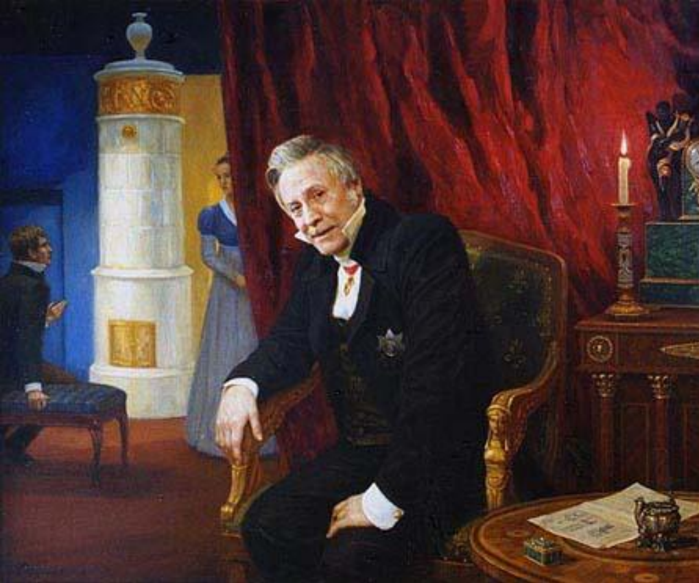
Юрий Соломин - Павел Афанасьевич Фамусов.

Фамилия Павла Афанасьевича Фамусова соотнесена с латинским словом « молва ». Таким образом, автор подчёркивает одну из важнейших черт этого героя: его зависимость от молвы и страсть разносить слухи . К этому можно добавить, что фамилия Фамусов вполне соотносится и с английским famous , то есть « известный, знаменитый », что не менее важно в характеристике « московского туза ». Фамусов - достаточно известный в Москве человек: все наперебой зовут его в гости - на погребенья, на крестины.