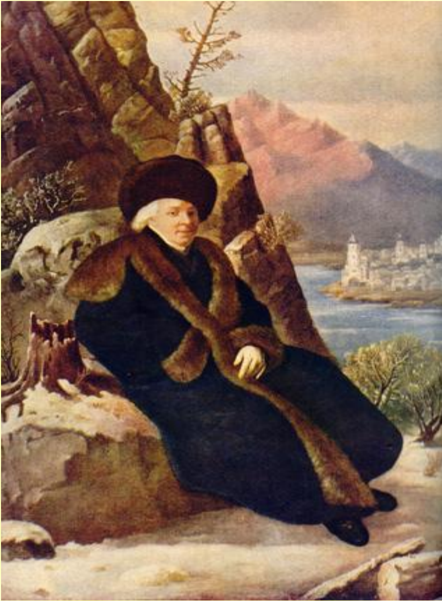
Портрет поэта Г.Р. Державина.