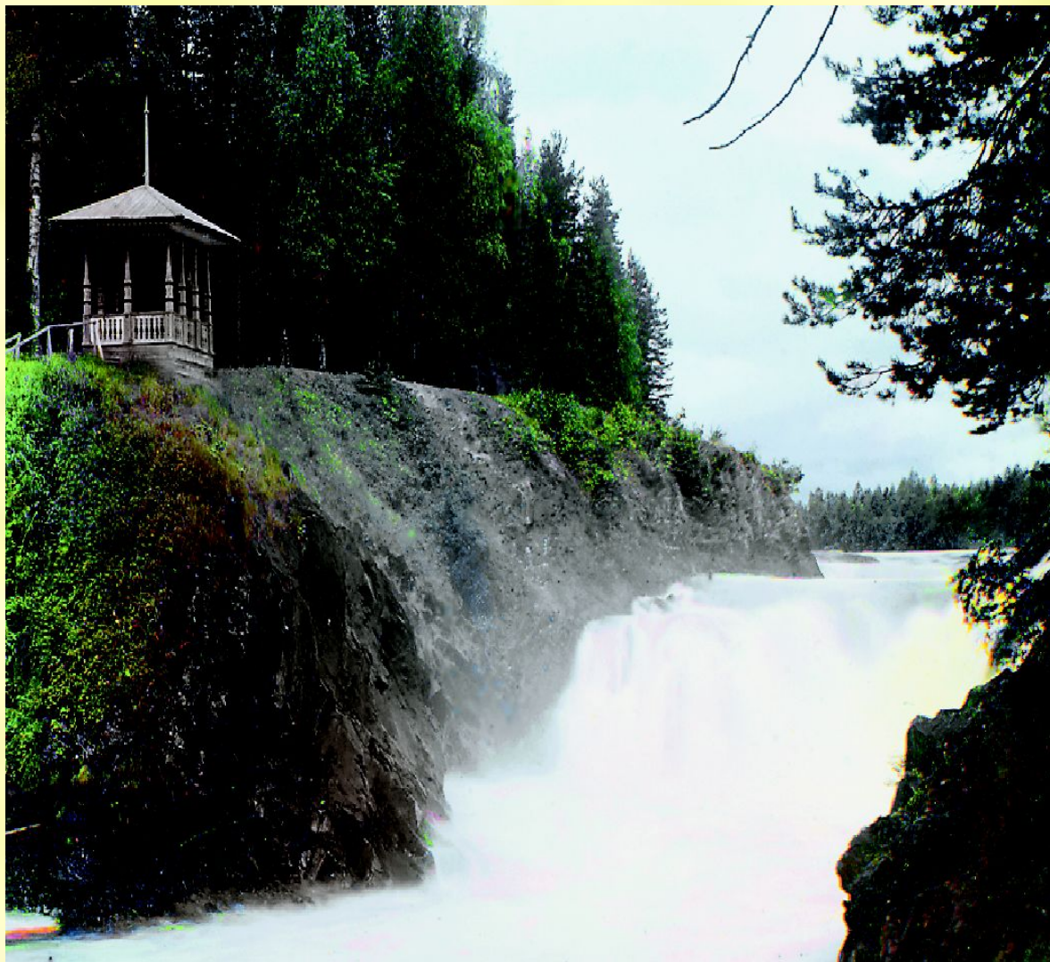
Водопад Кивач. Первое цветное фото водопада. 1915 г.