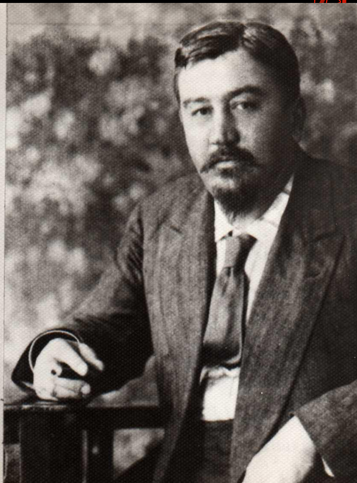
М.Куприна с дочерью Лидией. А.Куприн.1910 г.г.