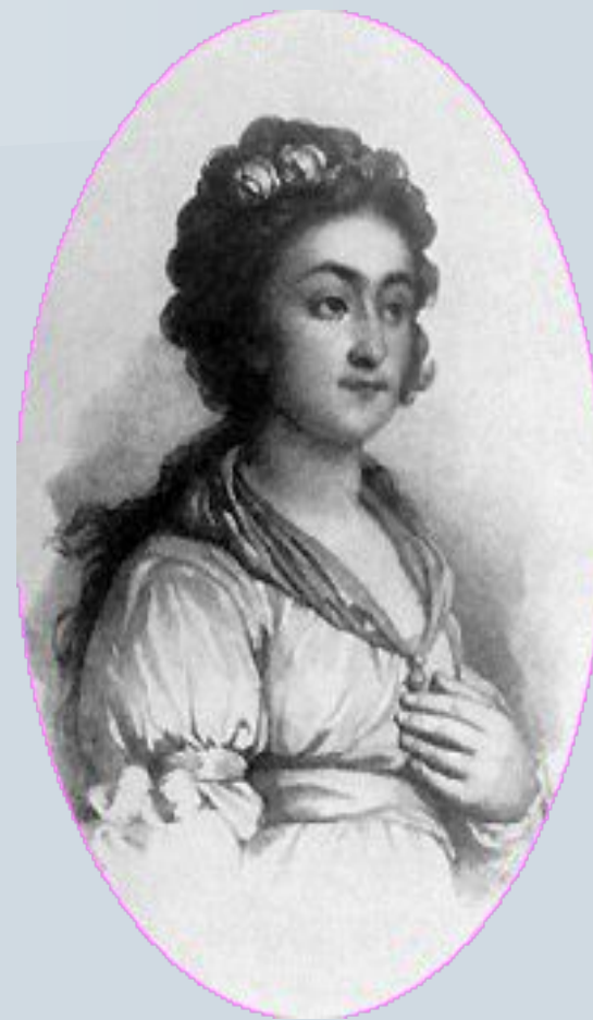
Первая жена Г.Р Державина Екатерина Яковлевна Бастидон (1760-1794)

Конфликт с Вяземским, скрывавшим государственные доходы, привел к отставке Державина с сенатской службы, но с 1784 г. по воле Екатерины II он назначается губернатором Олонецкого края. Борьба за законность с наместником генерал-губернатором Тутолминым закончилась поражением Державина, и года не пробывшего на этом посту. Последовало новое назначение - тамбовским губернатором. Державин успел много сделать для просвещения Тамбовского края, но попытки отстаивать справедливость и нежелание "ладить" с высшими вельможами привели к смещению с должности в 1788 г. За годы, проведенные на губернаторстве, поэтическая слава Г.Р.Державина возросла.