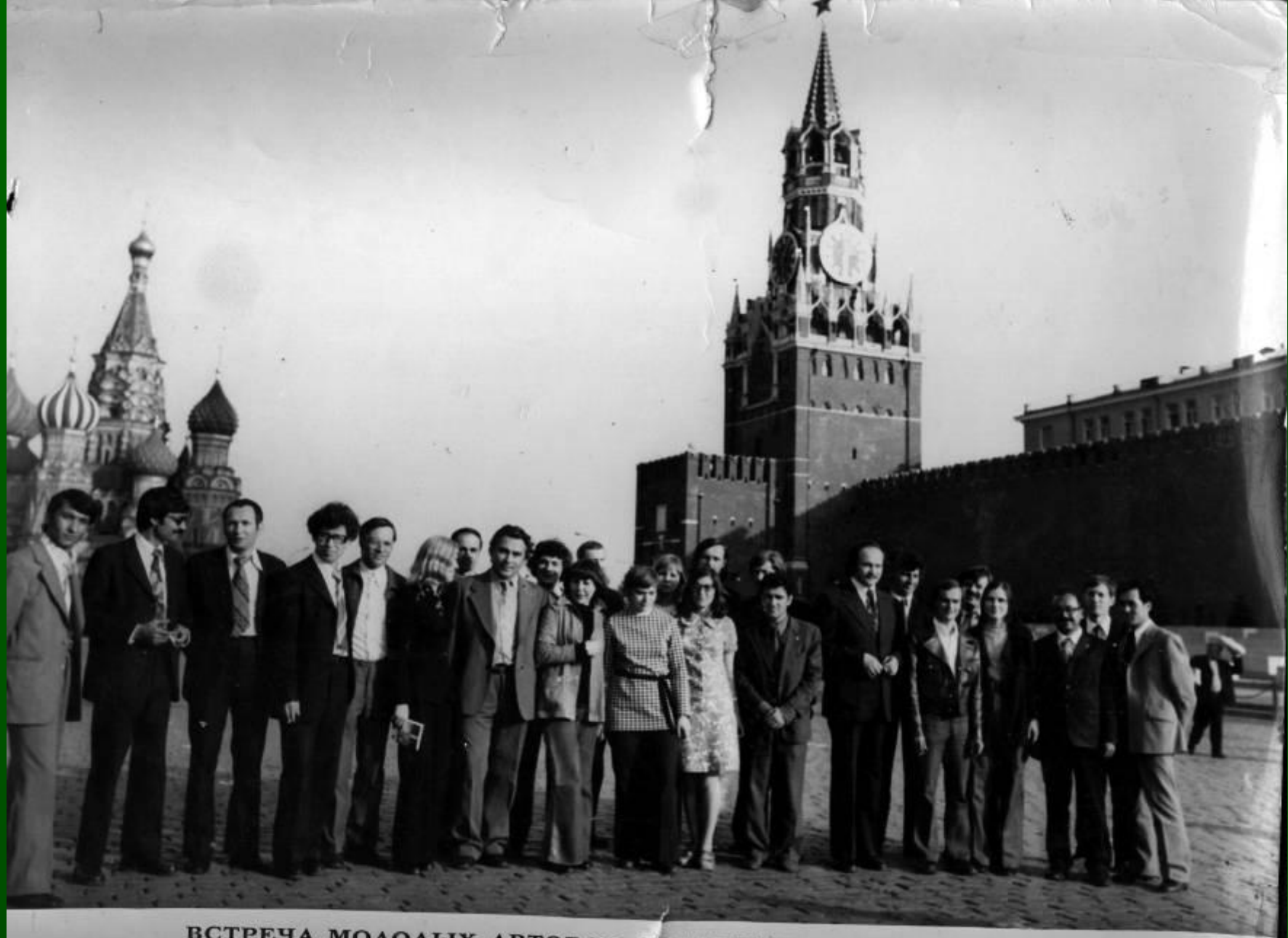
ВСТРЕЧА МОЛОДЫХ АВТОРОВ ИЗДАТЕЛЬСТВА ЦК ВЛКСМ «МОЛОДАЯ ГВАРДИЯ»