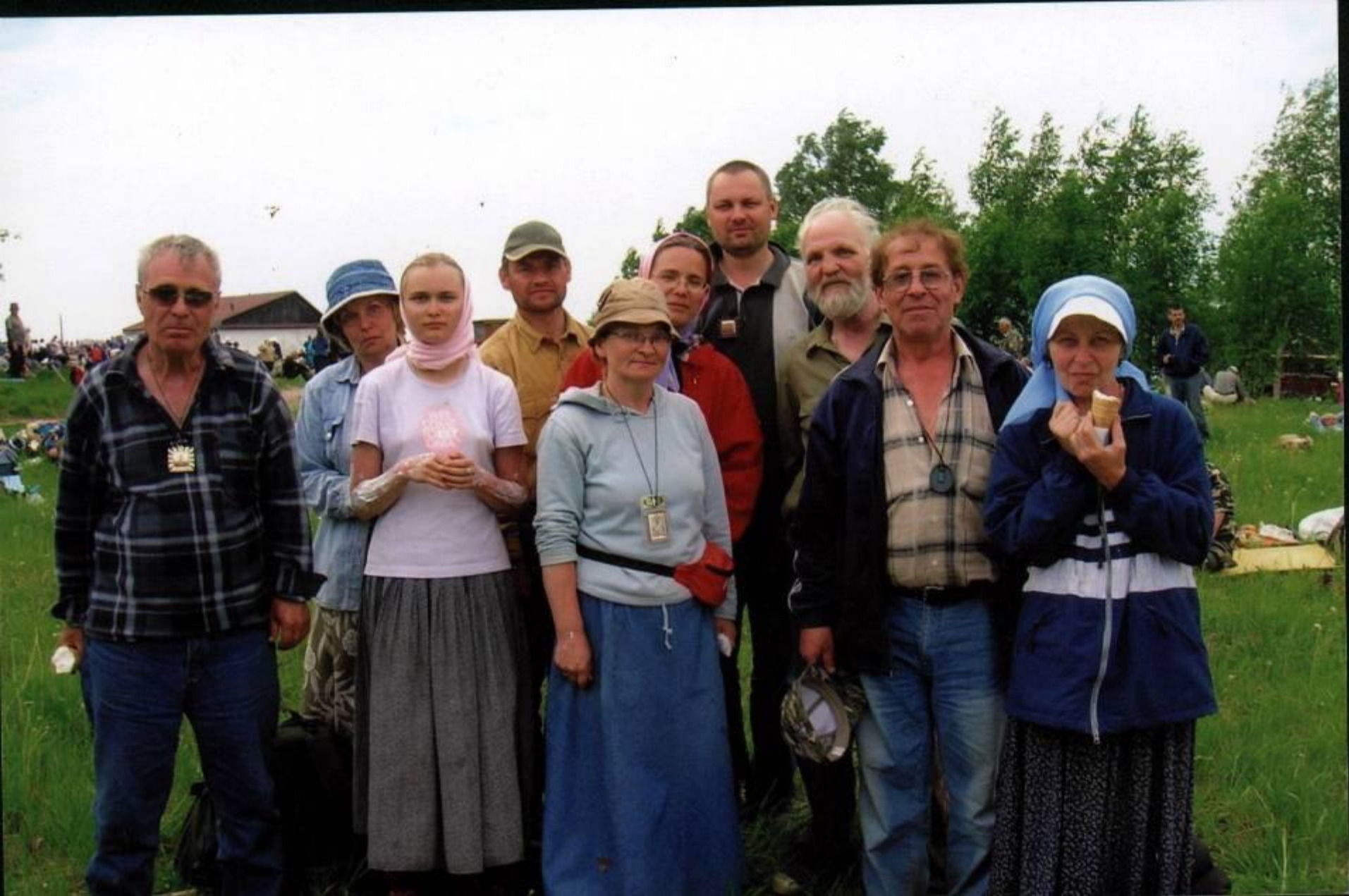
Русская эстонская община на крестном ходе. 2006 г.