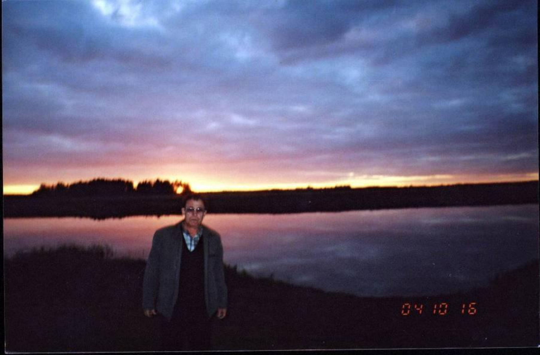
Село Чистополье. Озеро Большое