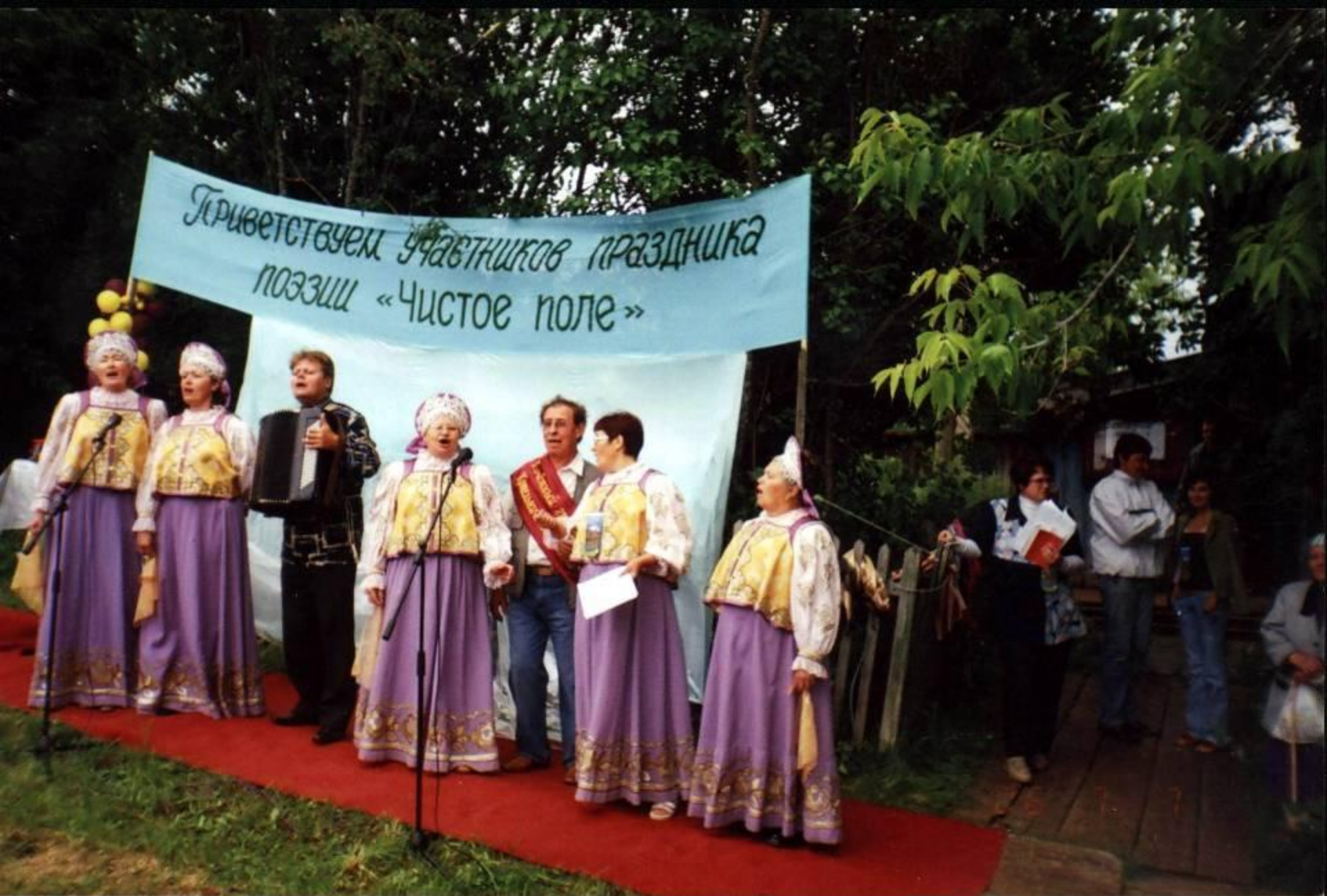
Дни поэзии «Чистое поле». 2006 год