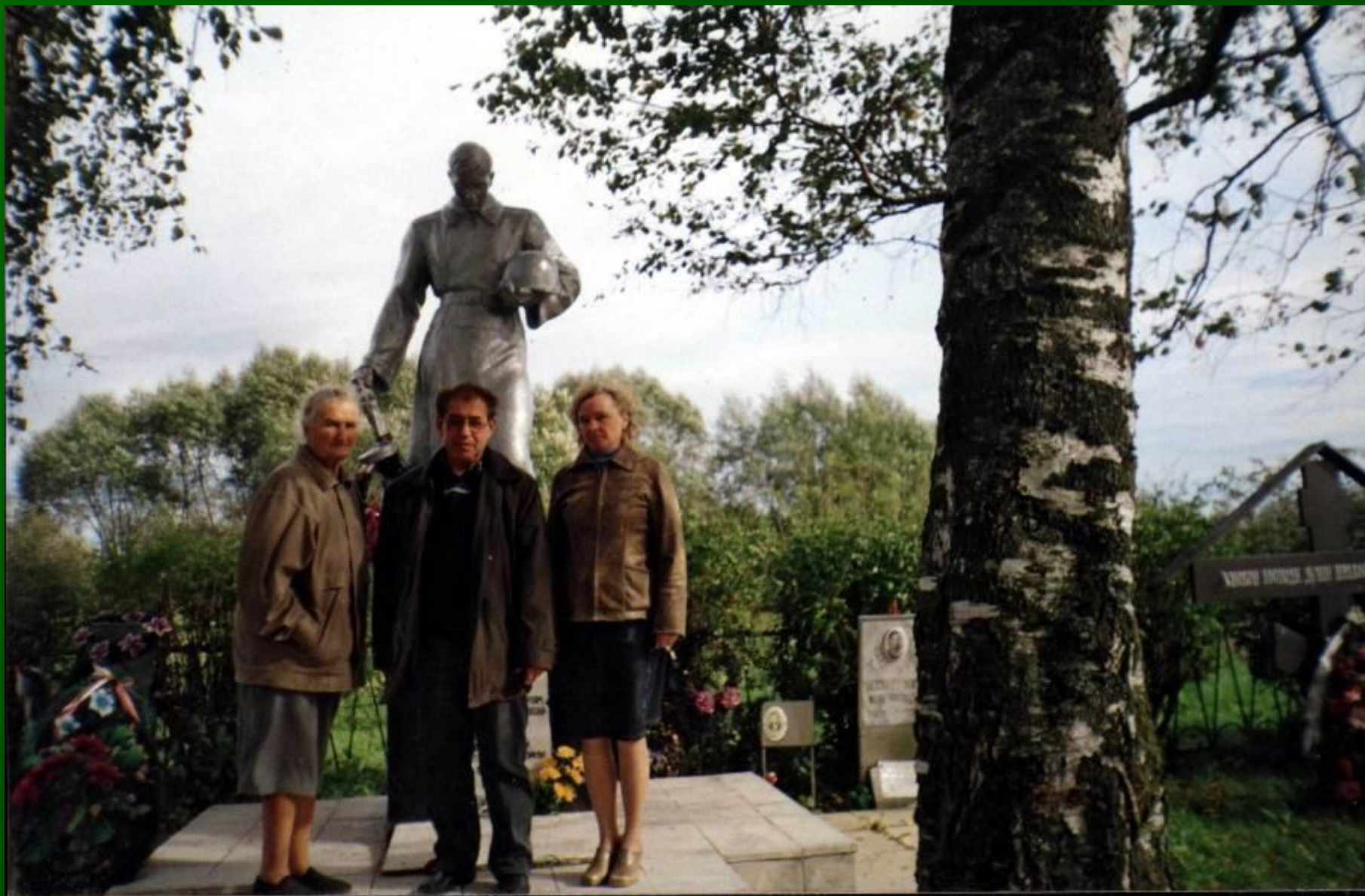
У могилы отца. Село Полунино под Ржевом