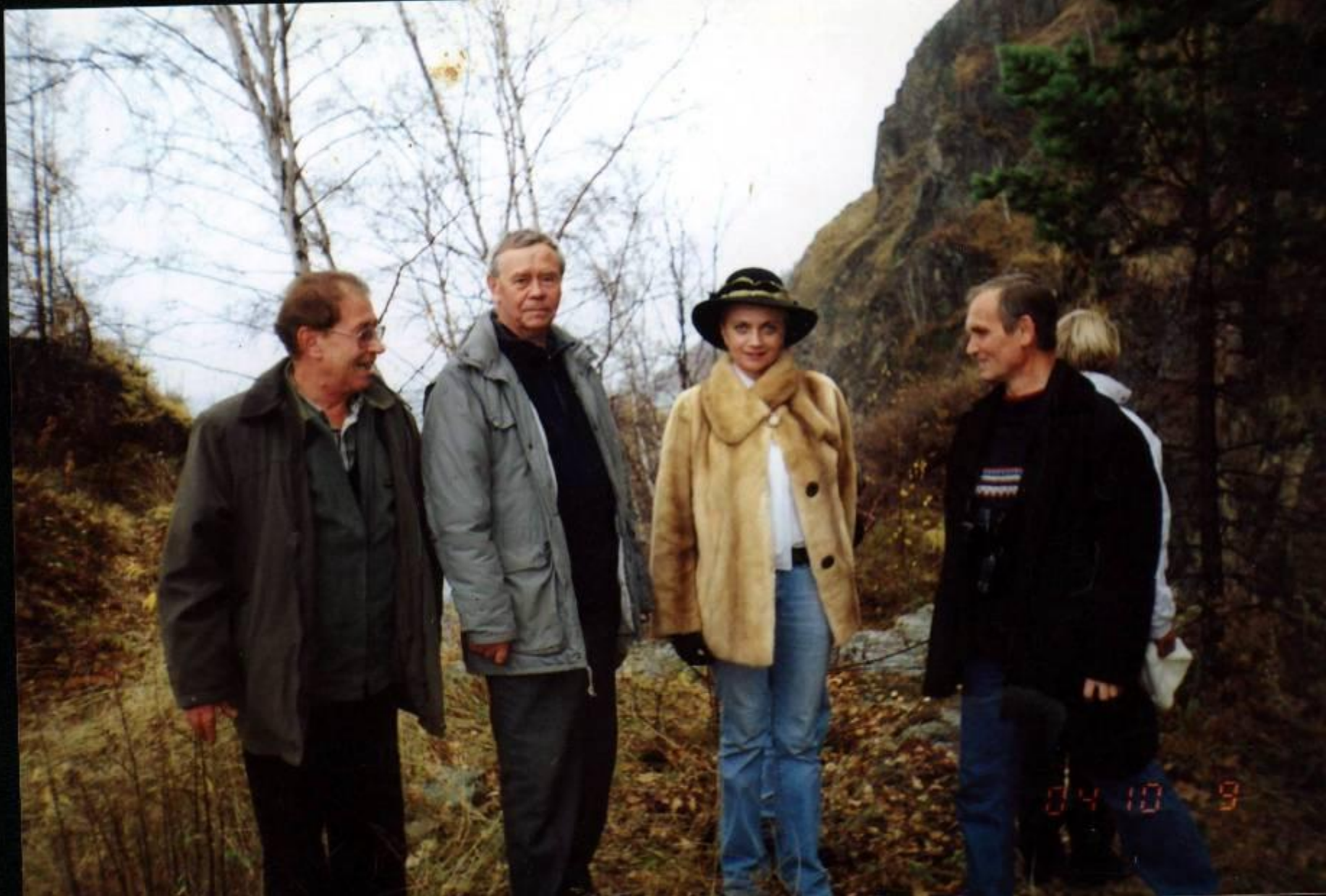
На Байкале. В гостях у Валентина Распутина 2004 г.