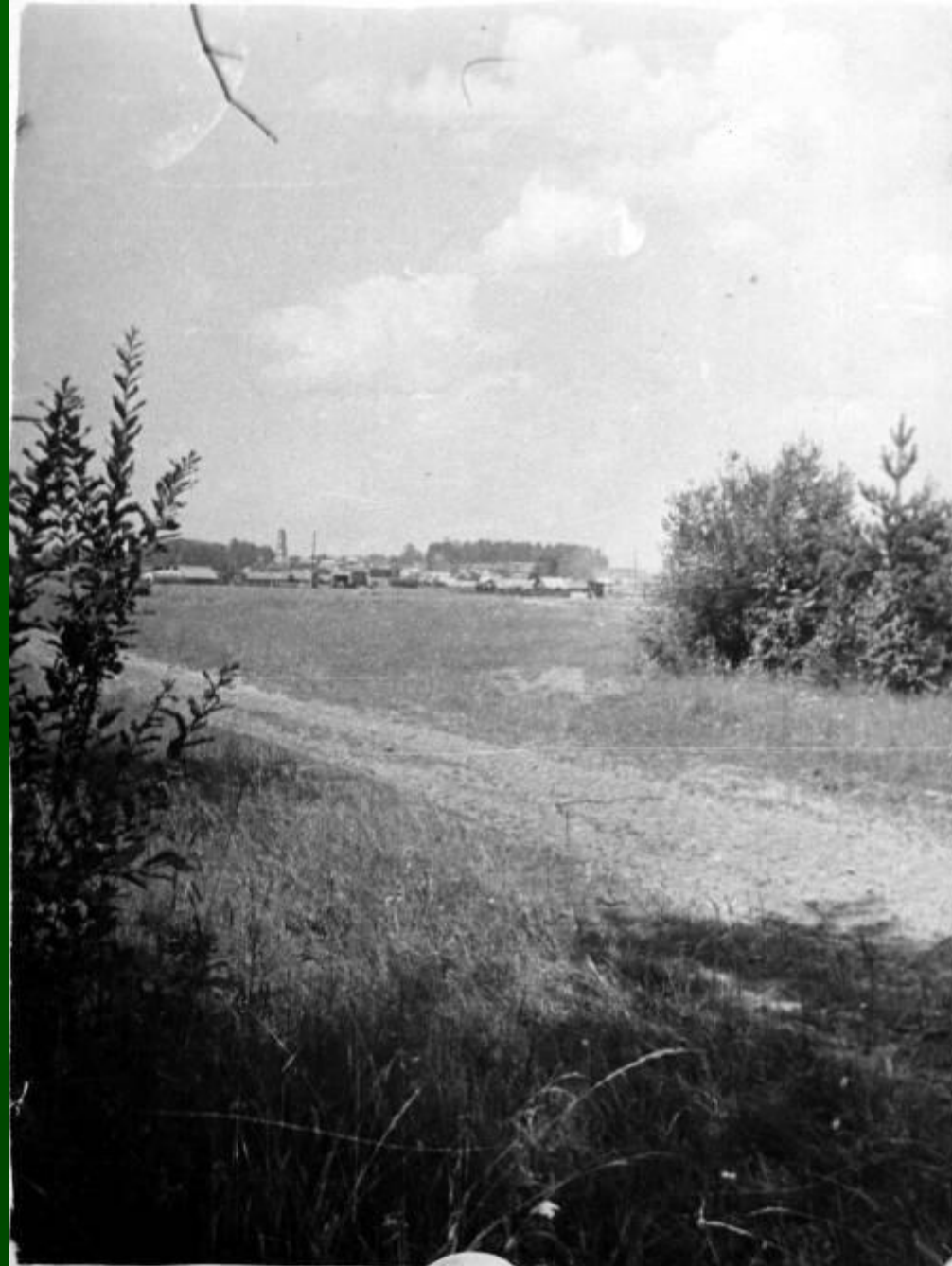
Русское поле в окрестностях села Чистополье