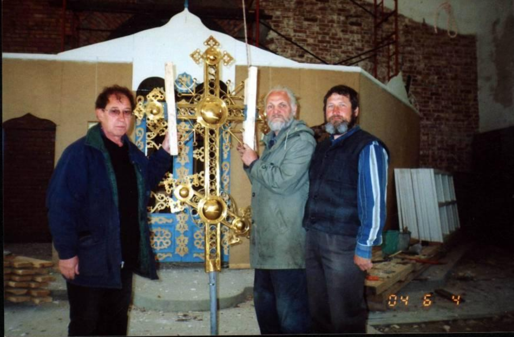
Воздвижение креста на колокольню с. Горохово. 2006 г.