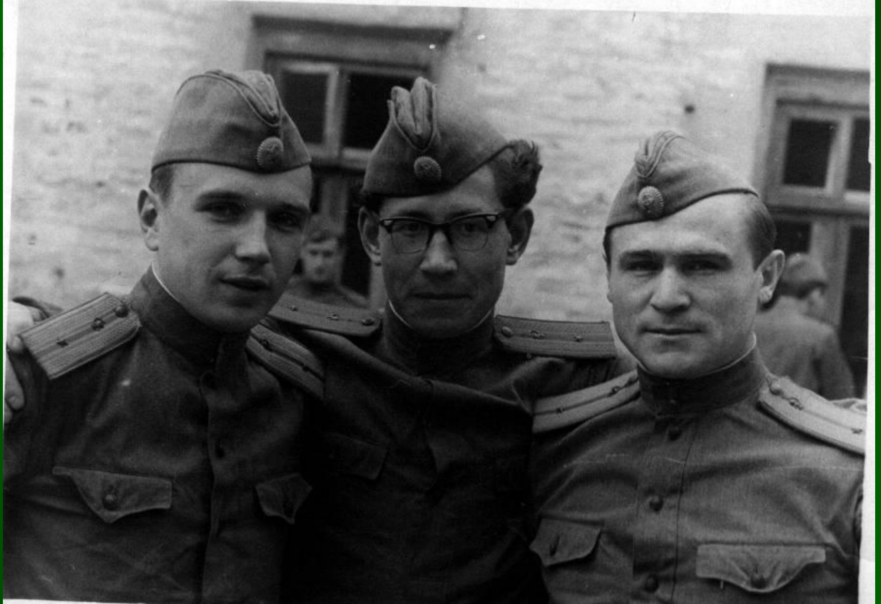
Поэт на армейских сборах