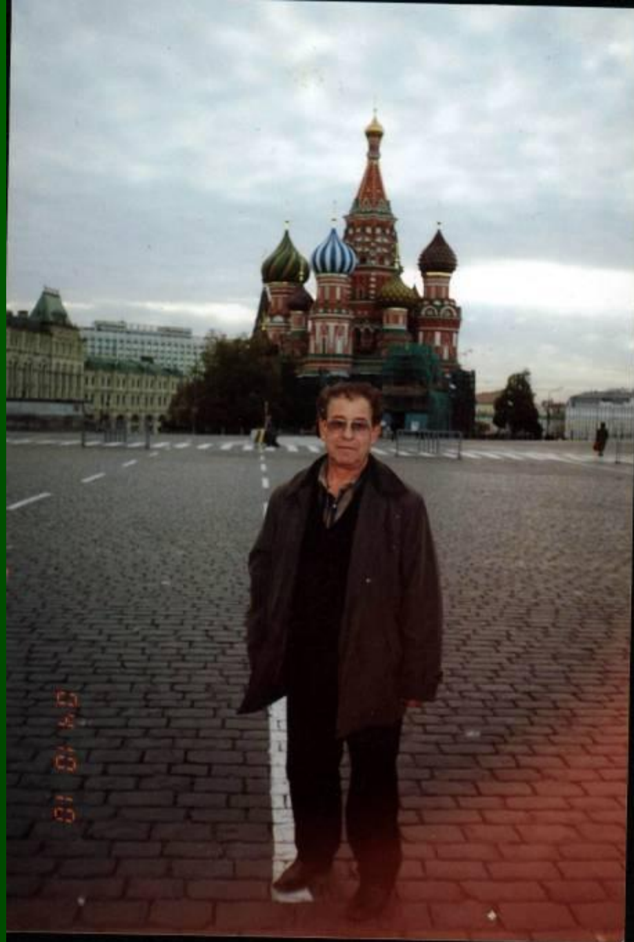
День отъезда в Вятку