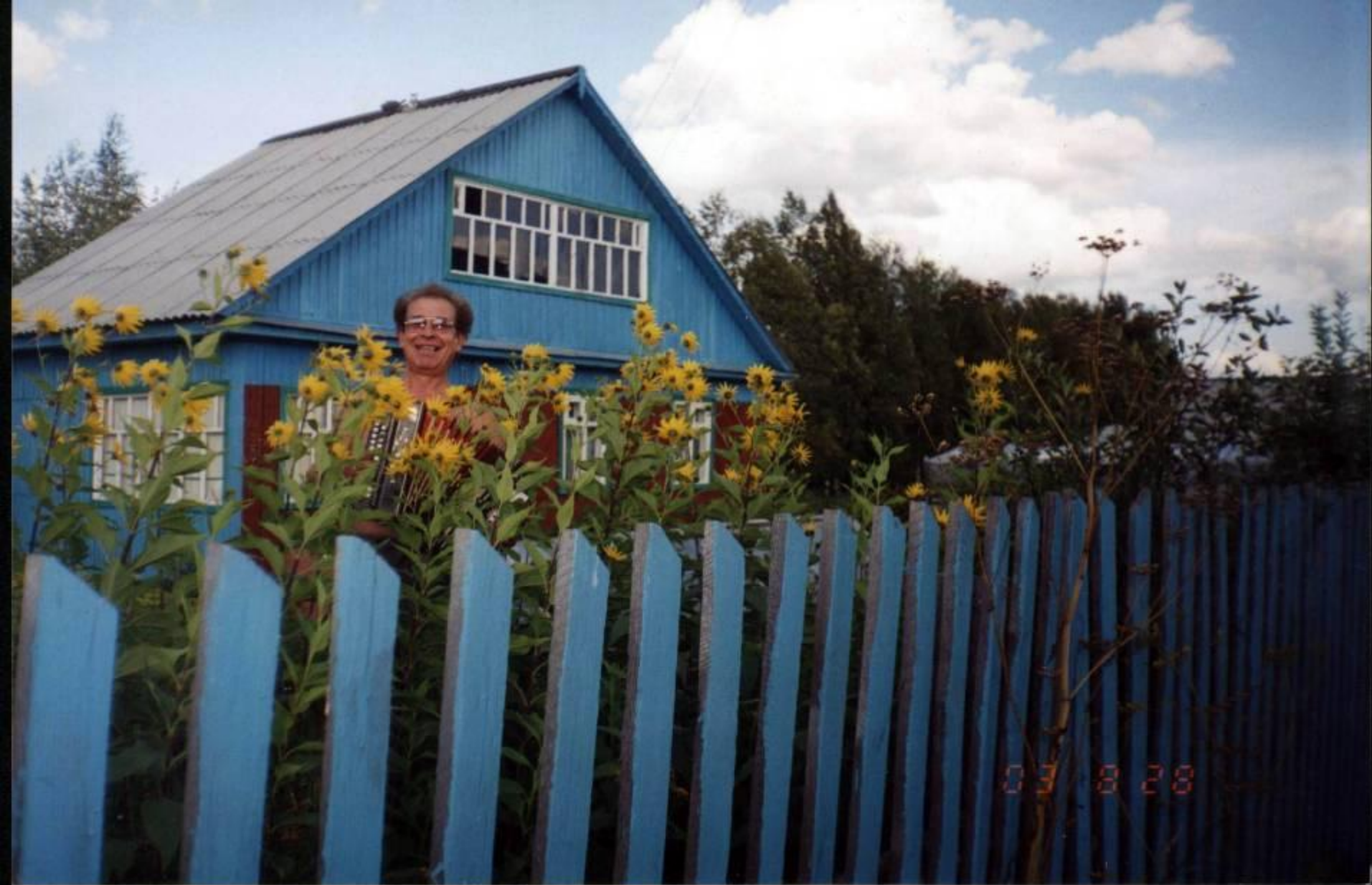
Дом поэта в Байболовке