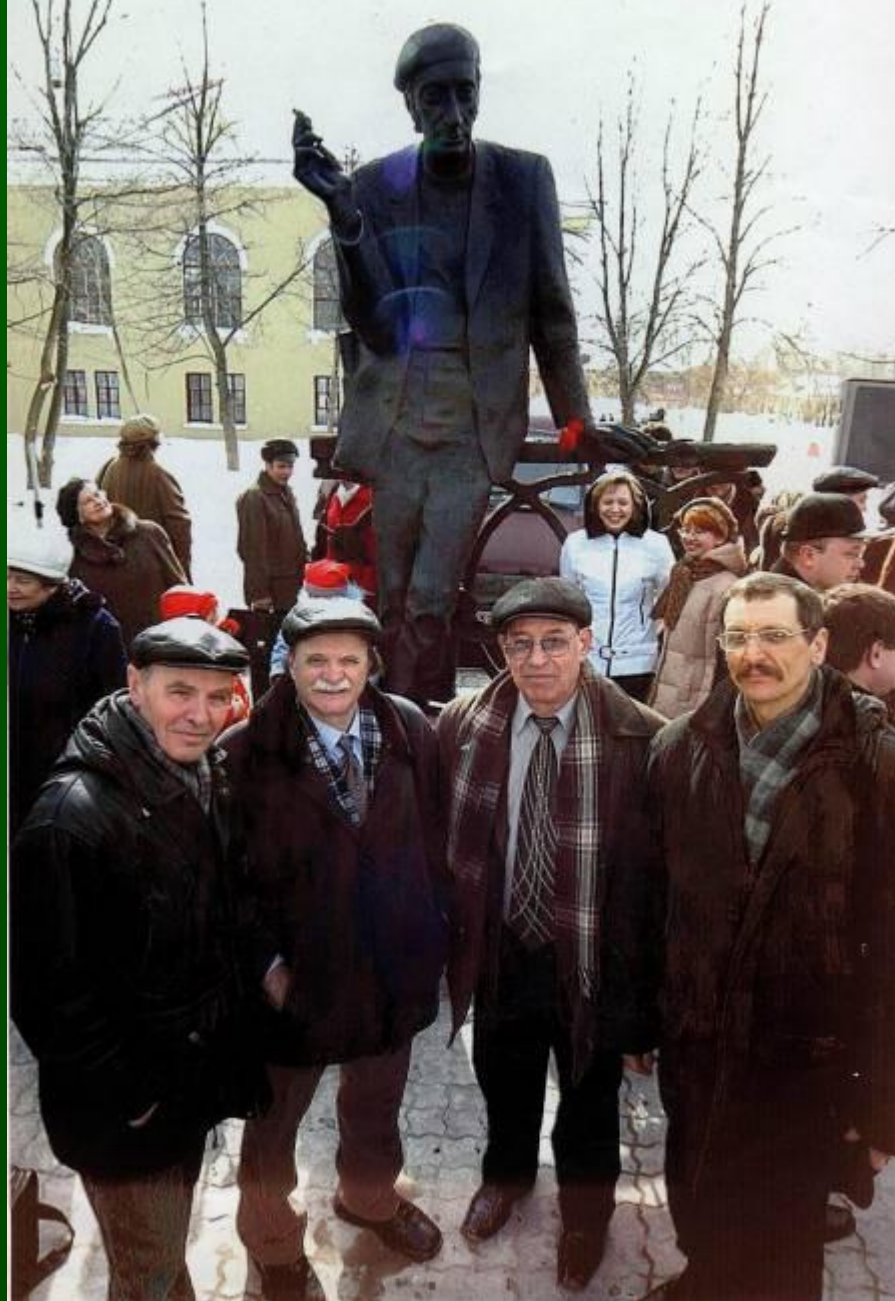
Открытие памятника поэту Алексею Решетову в г. Березники 3 апреля 2002 года