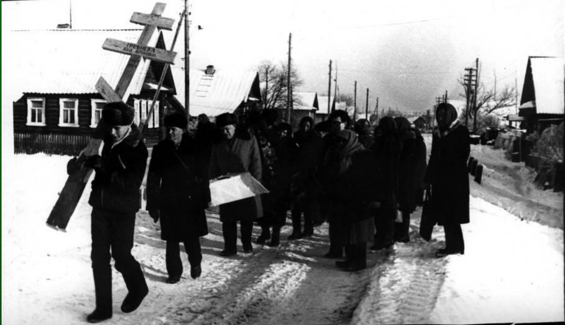
Похороны матери поэта. 8 декабря 1984 года