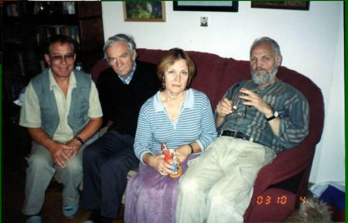
Встречи с друзьями на Вятской земле