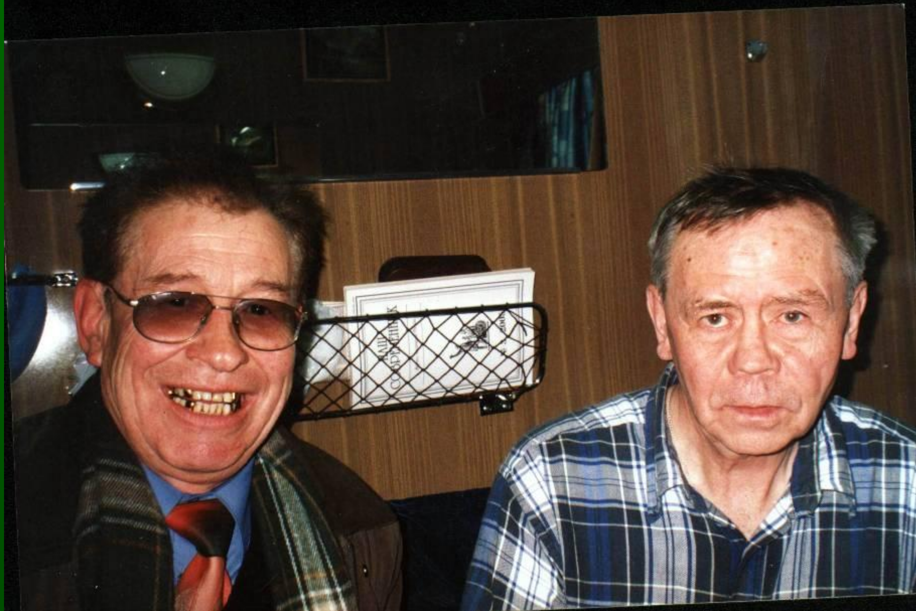
В поезде «Иркутск – Москва». 2006 г.