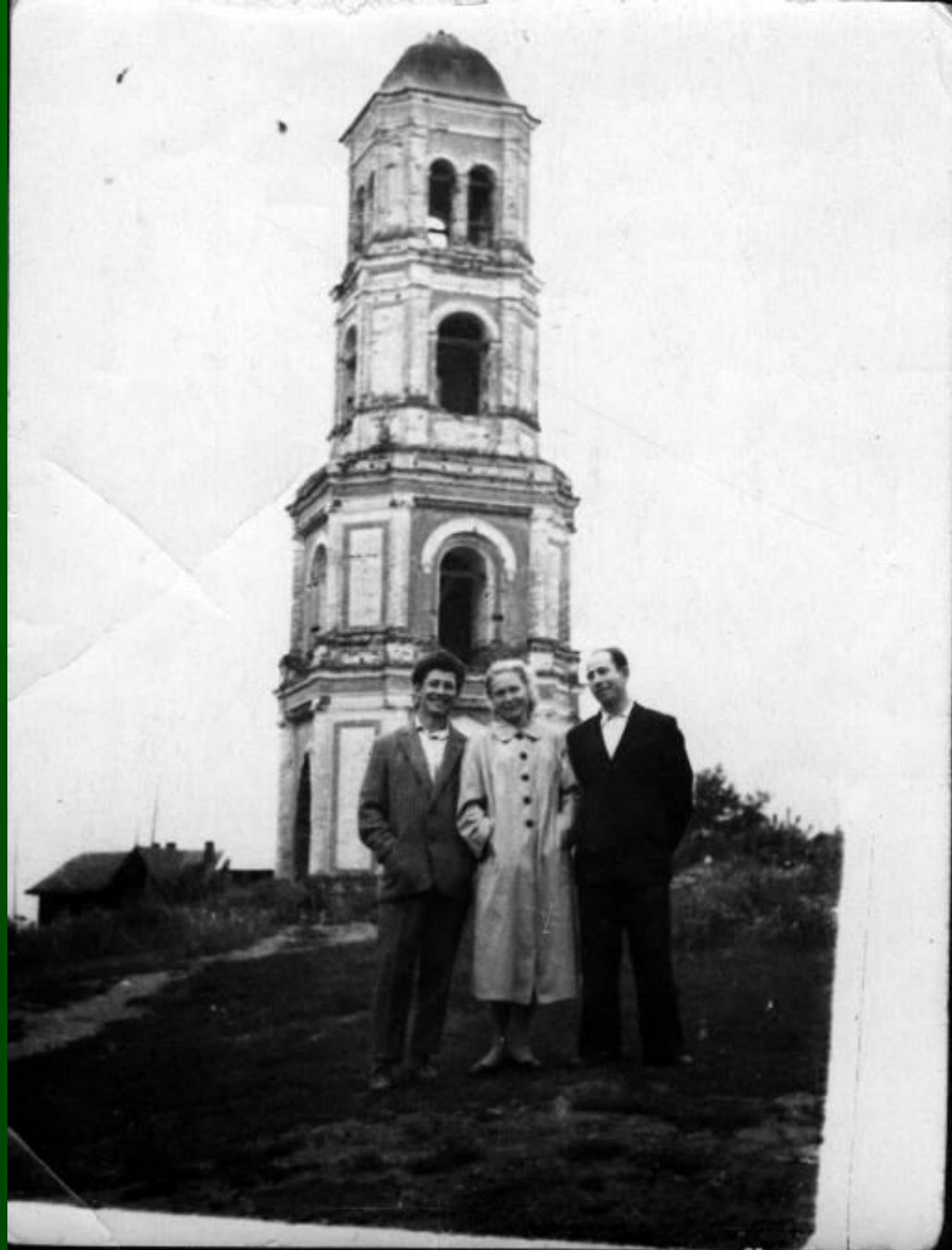
Село Чистополье. У колокольни без креста