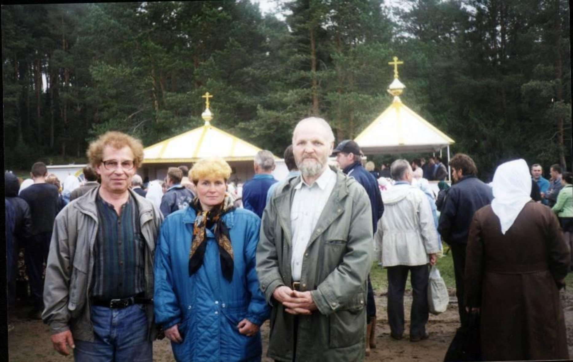
Крестный ход. 1995 год. Село Великорецкое