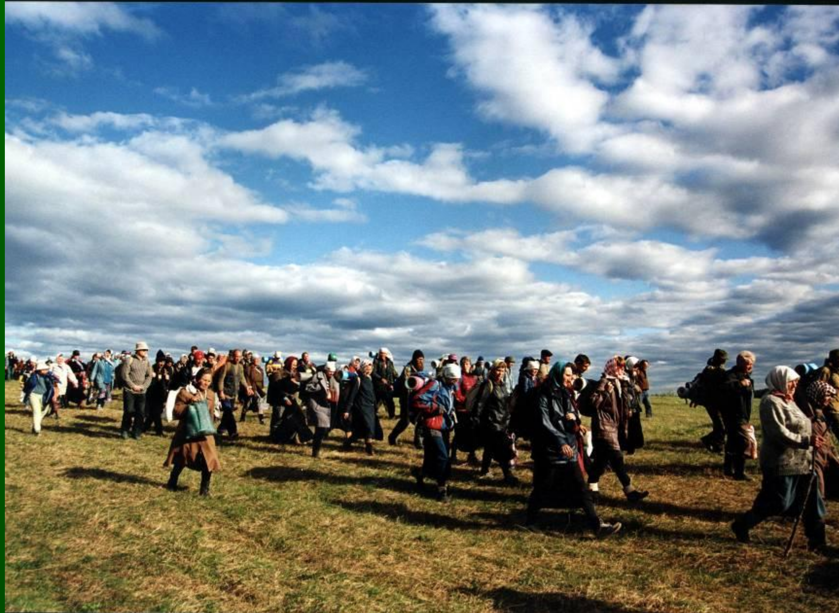
Паломники в пути. 2006 г. Крестный ход на реку Великую