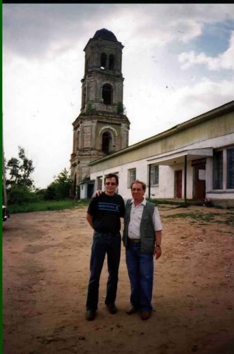
У колокольни с композитором Владимиром Салмаковым. 2006 г.