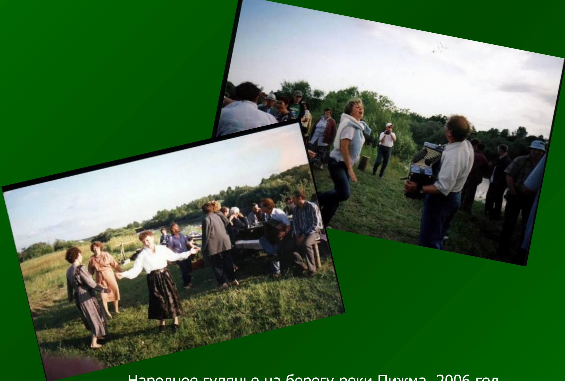
Народное гулянье на берегу реки Пижма. 2006 год