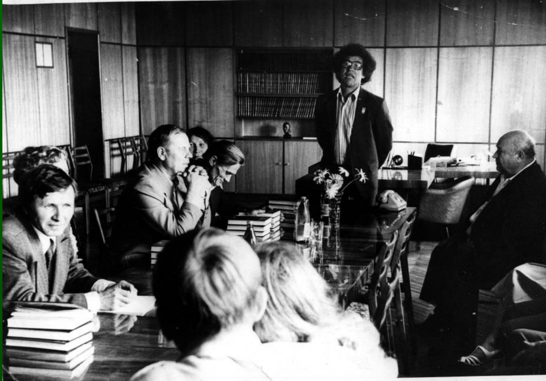
Дни литературы в Кирове. 1982 год