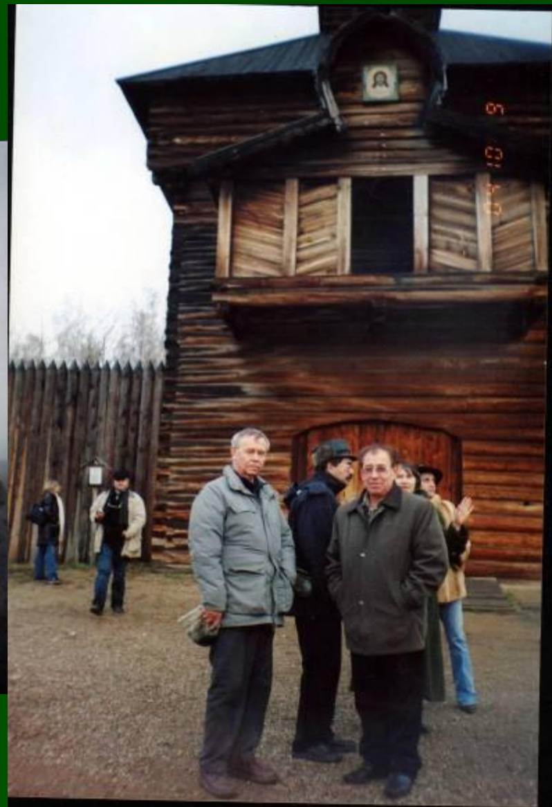
Музей под открытым небом на Байкале. 2004 г.