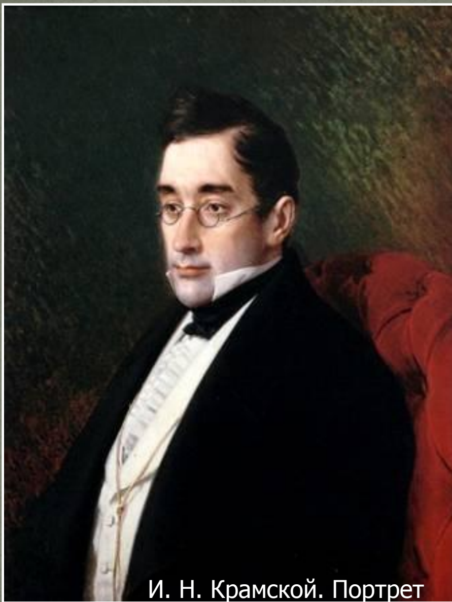
И. Н. Крамской. Портрет писателя Грибоедова

«Ум и дела твои бессмертны в памяти русской...» Н. Чавчавадзе