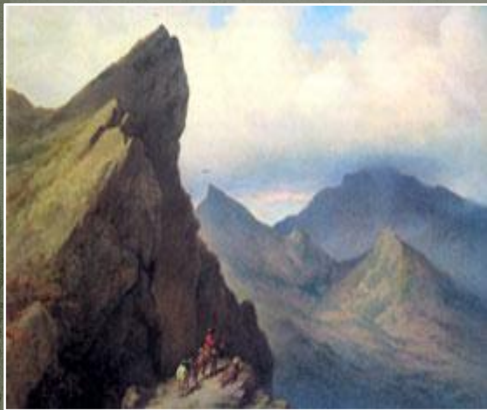
Кавказ. 1850-е годы. К. Н. Филиппов