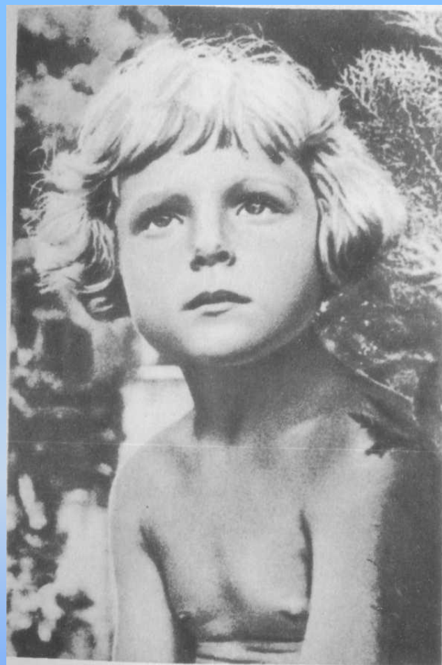
Гуле 3 года