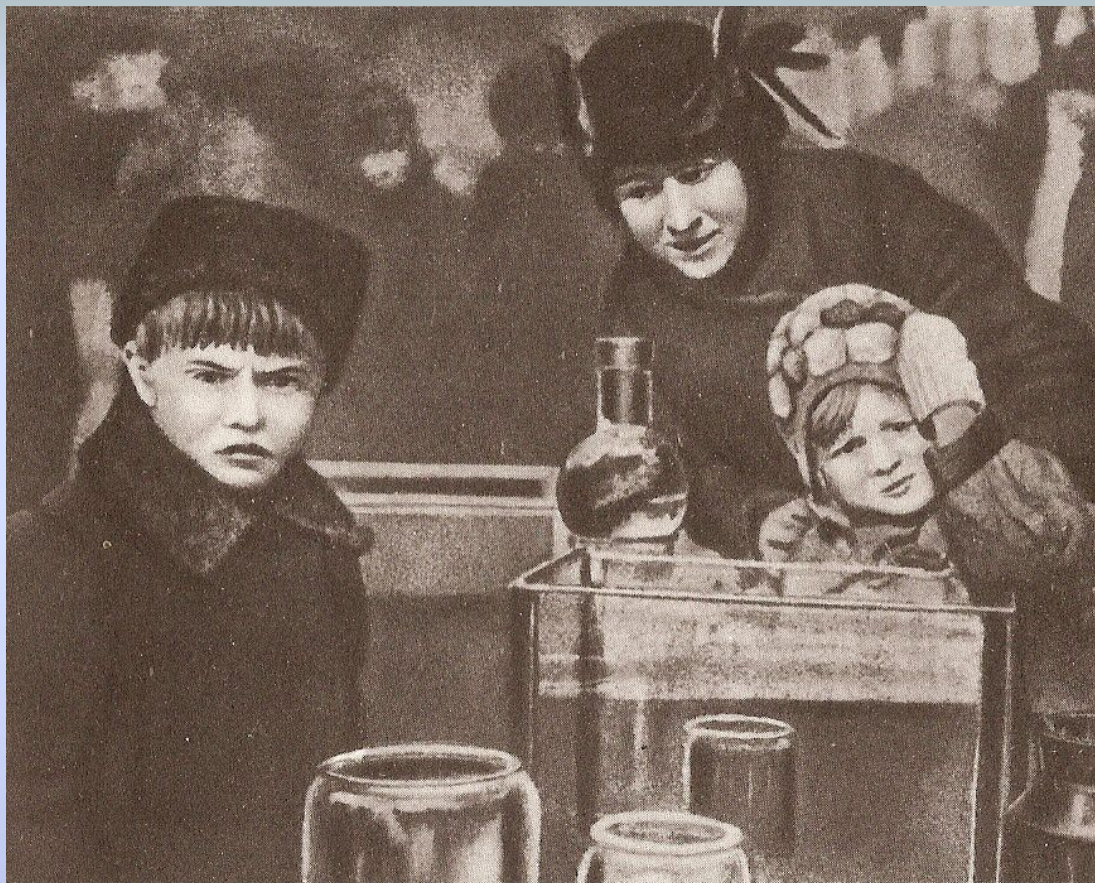
Трёхлетняя артистка. Кадр из фильма «Каштанка»