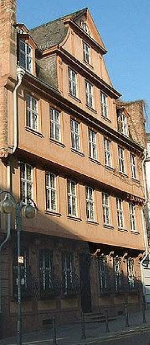
Дом во Франкфурте-на-Майне, где родился Гёте. Восстановлен в 1947—1949 годах.

Гёте родился 28 августа 1749 во Франкфурте-на-Майне. «В отца пошел суровый мой / Уклад, телосложение; В мамашу – нрав всегда живой / И к рассказням влечение» , – писал он . Первые стихотворные опыты Гёте относятся к 8-летнему возрасту. Не слишком строгое домашнее обучение под наблюдением отца, а потом 3 года студенческой вольницы в Лейпцигском университете оставляли ему достаточно времени, чтобы удовлетворить тягу к чтению и испробовать все жанры и стили эпохи Просвещения, так что к 19 годам, когда тяжелая болезнь вынудила его