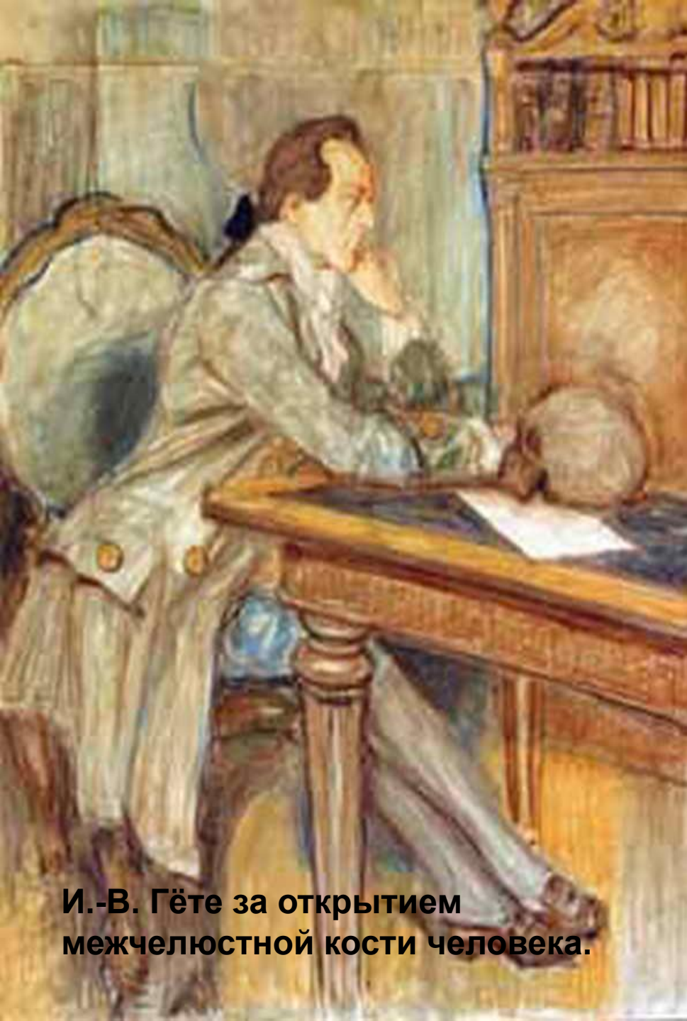
И.-В. Гёте за открытием межчелюстной кости человека.

Идея прогресса была в высшей степени близка поэту.