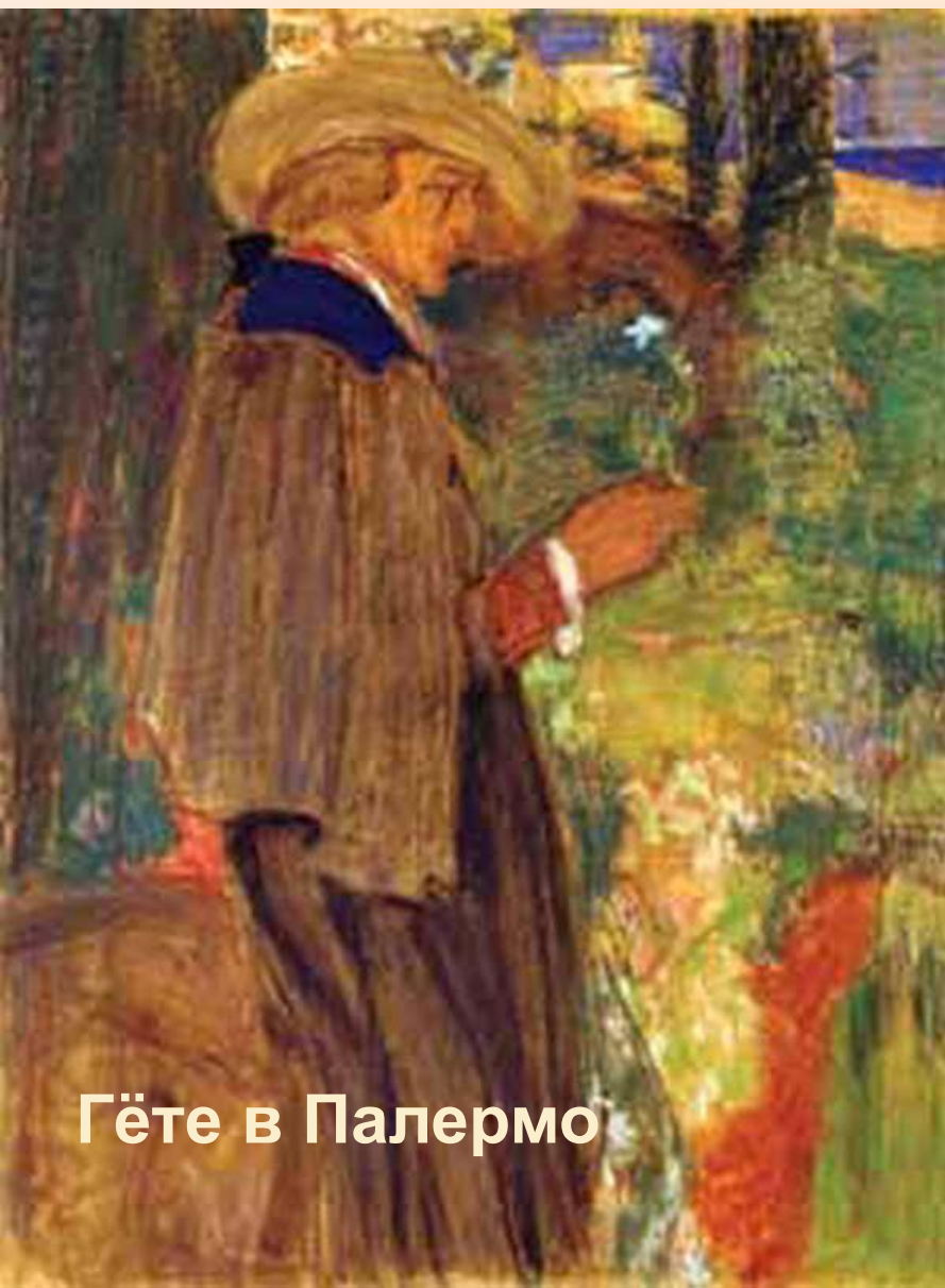
Гёте в Палермо

Те, кто знал его близко, отмечали повышенную впечатлительность и ранимость — признак как раз самого серьезного и глубокого восприятия жизни. Его ощущение бытия словно мечется между полюсами восторга и отчаяния (записи в юношеском дневнике: «Как все сумрачно на этом свете» : ЧУТЬ