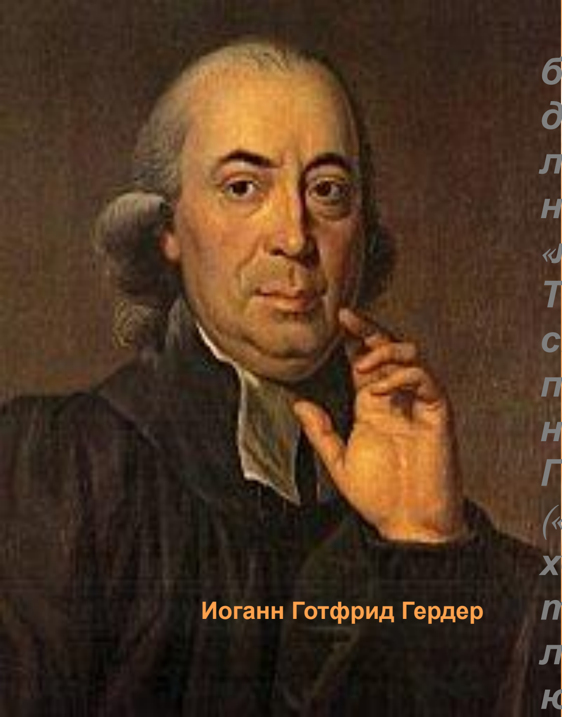
Иоганн Готфрид Гердер

Многие, казалось бы, прозорливые и доброжелательные люди столь часто называли поэта «легковесным». Так считал даже его старший друг и почитаемый наставник Иоганн Готфрид Гердер («Гёте и вправду хороший человек, только крайне легкомыслен»). В юности поэт получал