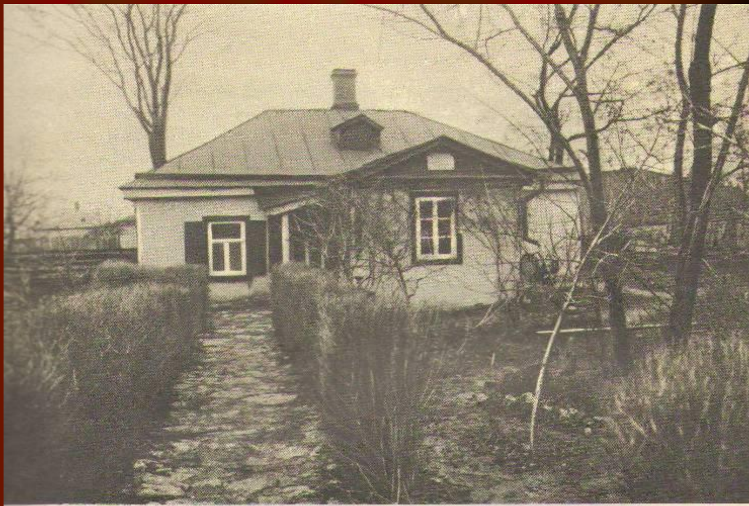
Дом, где родился А.П.Чехов (г. Таганрог, ул. Чехова, д.69)