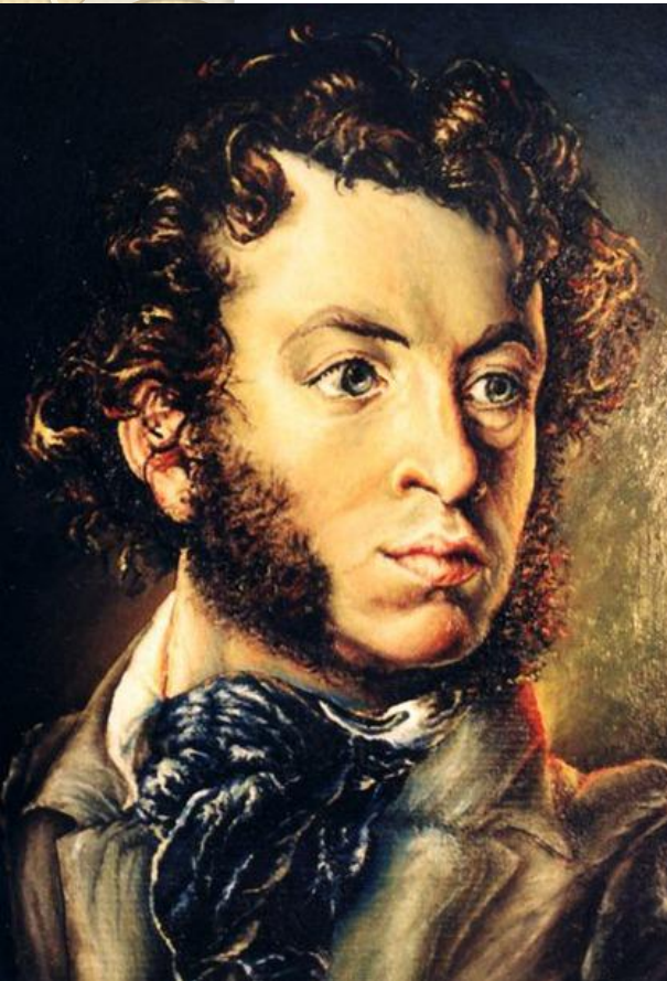
Пушкин Александр Сергеевич (1799-1837)

19 век называют «Золотым веком» русской поэзии и веком русской литературы в мировом масштабе. Не стоит забывать, что литературный скачок, осуществившийся в 19 веке, был подготовлен всем ходом литературного процесса 17-18 веков.