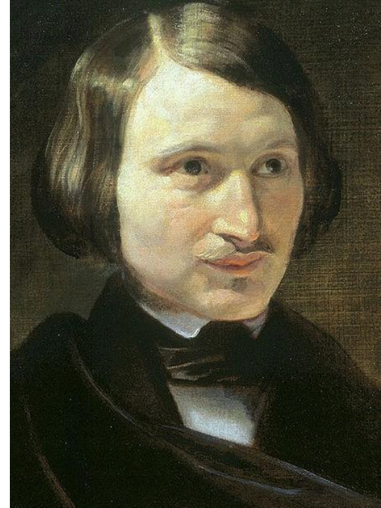
Гоголь Николай Васильевич (1809-1852)

Наряду с поэзией начала развиваться проза. Прозаики начала века находились под влиянием английских исторических романов В. Скотта, переводы которых пользовались огромной популярностью. Развитие русской прозы 19 века началось с прозаических произведений А.С. Пушкина и Н.В. Гоголя. Пушкин под влиянием английских исторических романов создает повесть «Капитанская дочка», где действия разворачивается на фоне грандиозных исторических событий во времена Пугачевского бунта*.