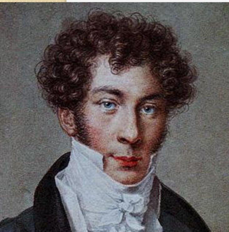
Батюшков Константин Николаевич (1787-1855)

В начале столетия началась поэтическая деятельность В.А. Жуковского. Его первые стихотворения обратили на себя внимание тонкостью чувства и "сладостью стиха". Его имя стало знаменитым, когда в двенадцатом году был написан "Певец во стане русских воинов", исполненный патриотическим одушевлением. Современники не замечали странности формы, где русские воины являлись в классических вооружениях и в романтическом освещении: классическая условность еще не была забыта, к романтической начинали привыкать. Его поэзии отвечал личный характер, религиозно-мистическое настроение сближало его с Гоголем. От новейшего литературного круга он был далек. В ходе литературного развития Жуковский кроме переводных трудов, всегда изящных и расширявших горизонт русской поэзии, имел еще заслугу высокого понимания существа поэзии. Его определение поэзии отвечало всему его мировоззрению. Поэзия - "есть Бог в святых мечтах земли", и с другой стороны, "поэзия - есть добродетель". Определение было слишком личное, но во всяком случае, ставившее поэзию в самые высокие сферы нравственной жизни.