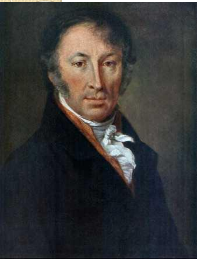
Карамзин Николай Михайлович (1766-1826)

В начале 19 века один из самых крупных деятелей литературы был Н.М. Карамзин . По природе склонный к чувствительности и меланхолии, он жадно воспринимал влияния западной литературы - Руссо и его последователей, французских и немецких, английского романа Ричардсона, юмора Стерна. Карамзин считал долгом посещать знаменитых писателей, и в первый раз в русской литературе давал живые сведения о действующих лицах европейского просвещения.