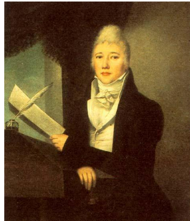
Озеров Владислав Александрович (1770 - 1816)

Другим весьма известным и почитаемым писателем того времени был Н.И. Гнедич, главнейшим трудом которого был перевод Илиады: он положил многие годы на завершение этого труда, возбудившего удивление современников. В переводе Гнедича видна серьезная работа над Гомером, но по старому пристрастию к ложно-классической высокопарности Гнедич уделил слишком много места церковнославянским элементам языка, употребляя иногда слова совсем неизвестные в обычной речи. В области драмы в начале столетия прославленным именем был В.А. Озеров : его трагедии были написаны в классическом духе, с большой легкостью стиха и искренностью чувства. Трагедии Озерова имели громадный успех, особенно "Дмитрий Донской", вызвавший патриотическое одушевление.