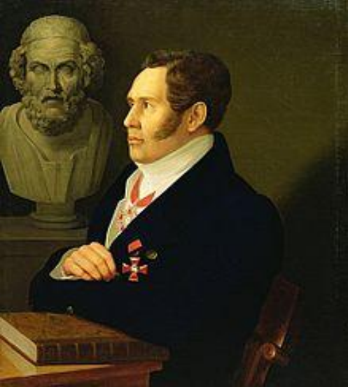
Гнедич Николай Иванович (1784 - 1833)

Другим весьма известным и почитаемым писателем того времени был Н.И. Гнедич, главнейшим трудом которого был перевод Илиады: он положил многие годы на завершение этого труда, возбудившего удивление современников. В переводе Гнедича видна серьезная работа над Гомером, но по старому пристрастию к ложно-классической высокопарности Гнедич уделил слишком много места церковнославянским элементам языка, употребляя иногда слова совсем неизвестные в обычной речи. В области драмы в начале столетия прославленным именем был В.А. Озеров : его трагедии были написаны в классическом духе, с большой легкостью стиха и искренностью чувства. Трагедии Озерова имели громадный успех, особенно "Дмитрий Донской", вызвавший патриотическое одушевление.