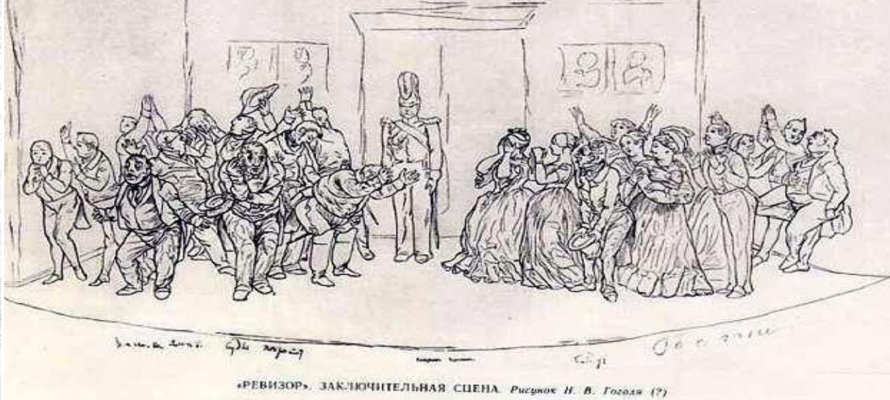
«РЕВИЗОР». ЗАКЛЮЧИТЕЛЬНАЯ СЦЕНА. Рисунком Н. В. Гоголя (?)

Литература унаследовала от 18 века публицистичность и сатирический характер. В прозаической поэме Н.В. Гоголя «Мертвые души» писатель в острой сатирической манере показывает мошенника, который скупает мертвые души, различные типы помещиков, которые являются воплощением различных человеческих пороков (сказывается влияние классицизма*). В этом же плане выдержана комедия «Ревизор».