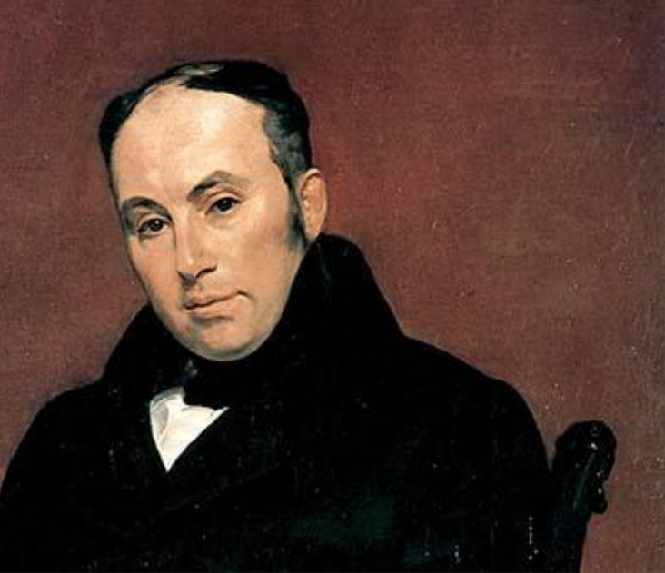
Жуковский Василий Андреевич (1783-1852)