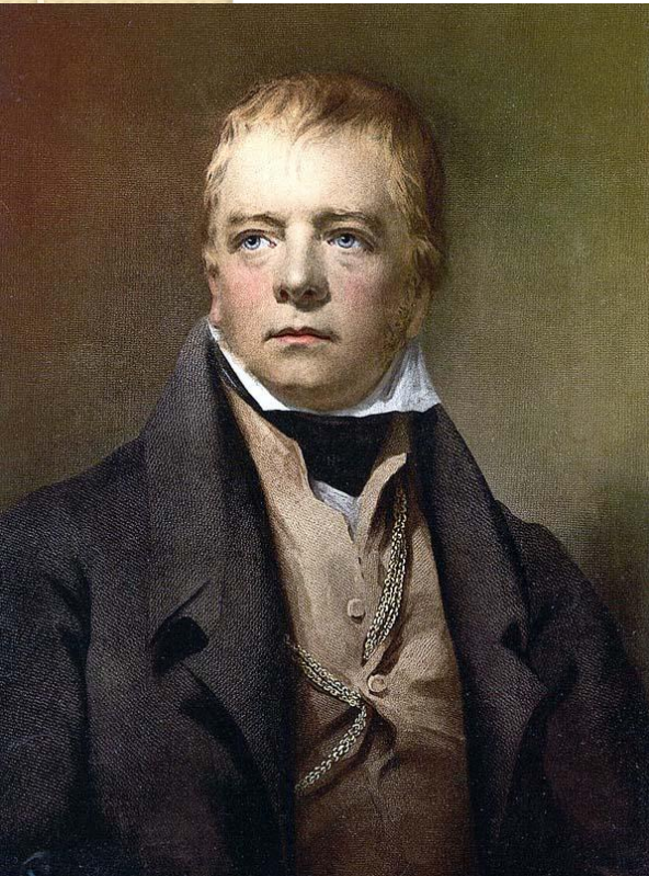
Сэр Вальтер Скотт (1771-1832)

Наряду с поэзией начала развиваться проза. Прозаики начала века находились под влиянием английских исторических романов В. Скотта, переводы которых пользовались огромной популярностью. Развитие русской прозы 19 века началось с прозаических произведений А.С. Пушкина и Н.В. Гоголя. Пушкин под влиянием английских исторических романов создает повесть «Капитанская дочка», где действия разворачивается на фоне грандиозных исторических событий во времена Пугачевского бунта*.