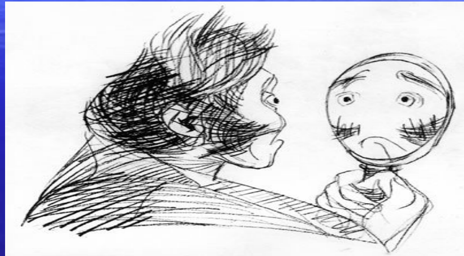
Коллежский асессор, майор Ковалев

В.Н.Горяев Карандаш, иллюстрации 1963-1965