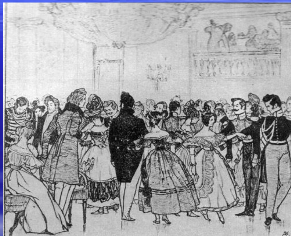
Сон Пискарева Кардовский 1904г.