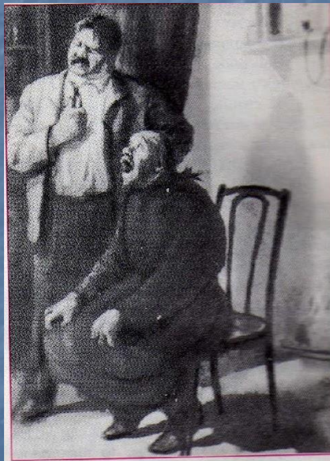
«Хирургия». Иллюстрация Кукрыниксов

краткость фразы; простые предложения; отсутствие эпитетов; глагол – любимая часть речи; точность каждого слова.