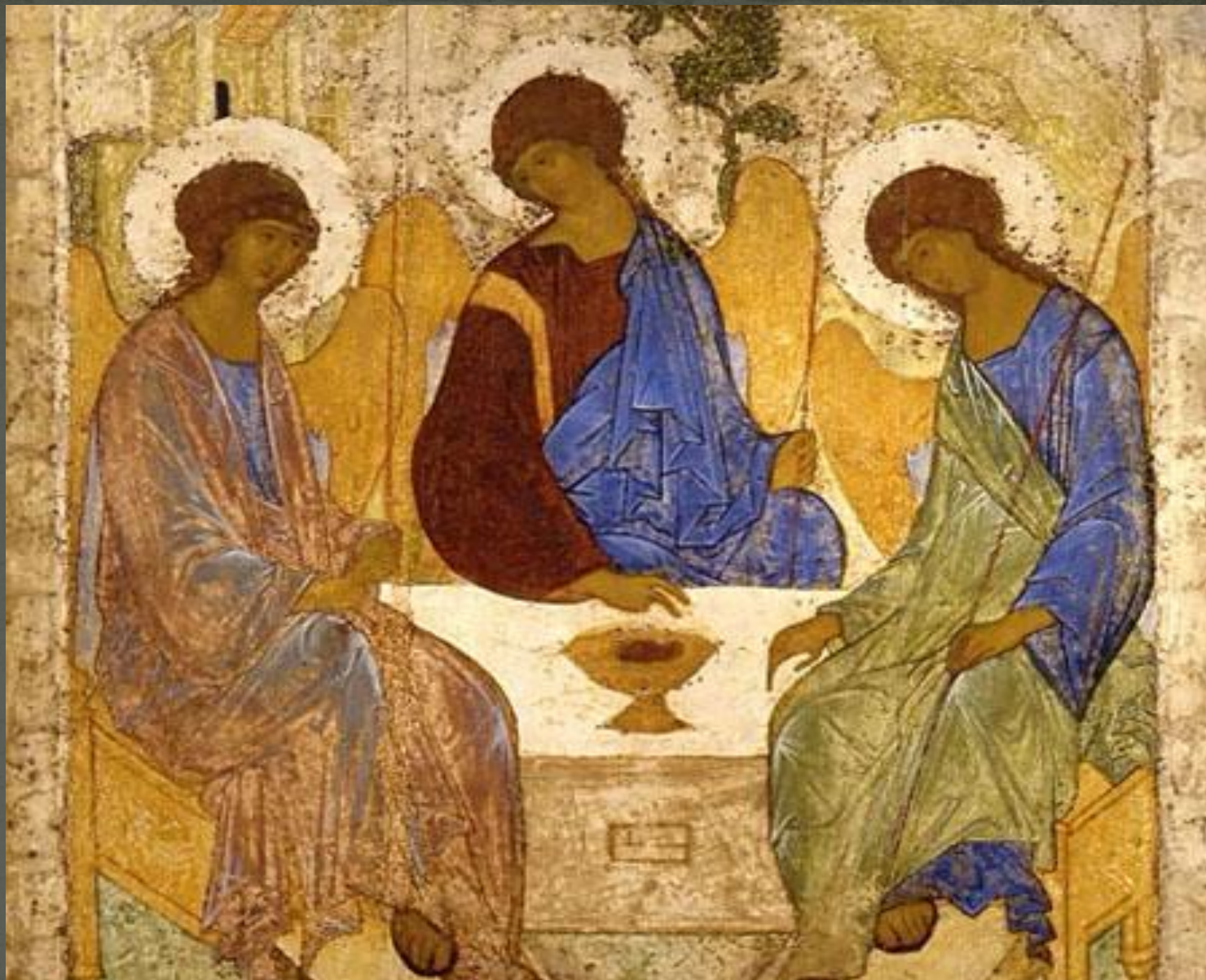
Андрей Рублев. Троица.