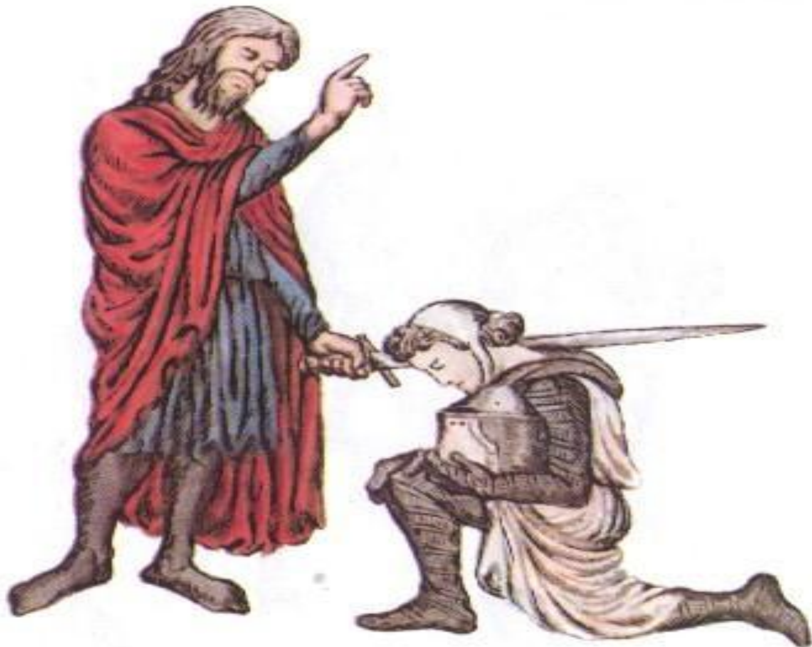
Посвящение в рыцари