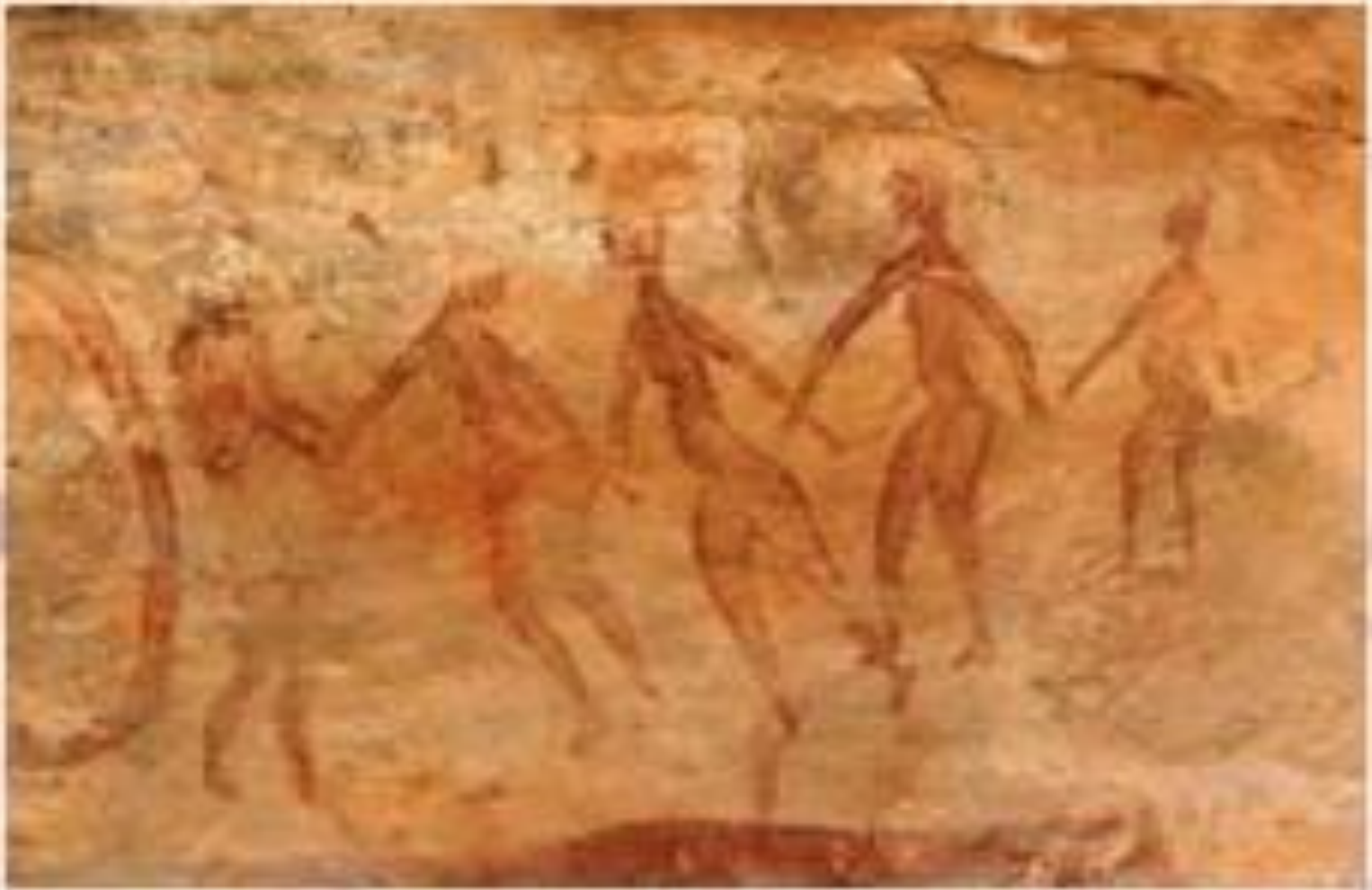
Ритуальный танец. Сефар. Сахара