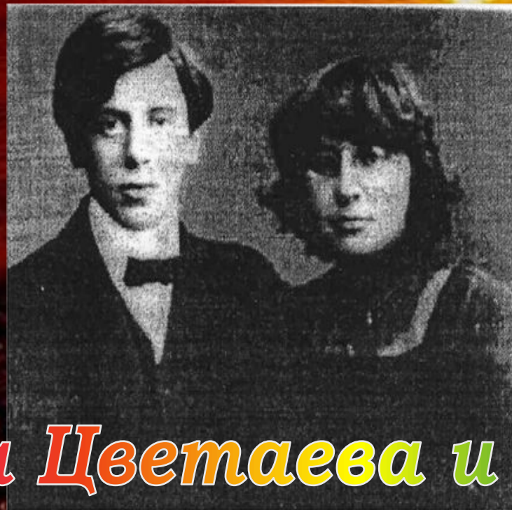
Марина Цветаева и Сергей Эс

Любовь вечна, она, по мысли поэта, воедино слита с миром природы и искусства, поскольку является воплощением творческого начала бытия. Любовь не может умереть - она вечно возрождается, вдохновенно преображаясь. Даже если любящий человек уходит из земной жизни, его любовь остаётся в этом мире, чтобы, «смеясь над тленом, стихом восстать - иль розаном расцвести!»