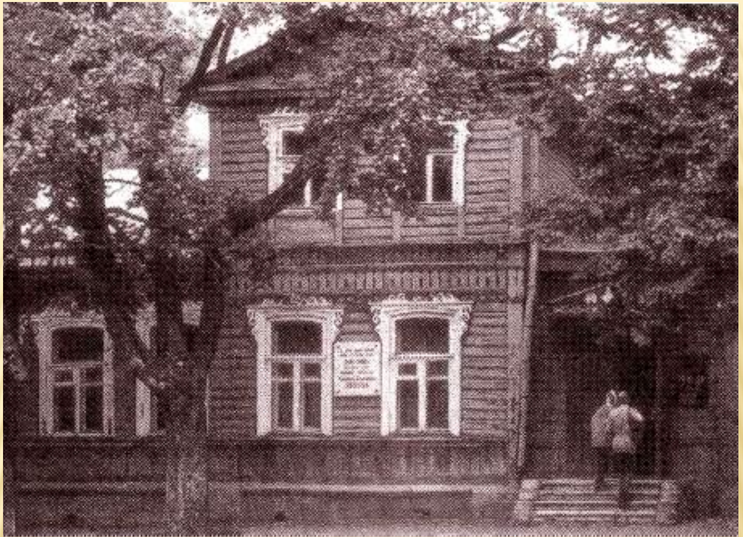
Дом-музей Н.С.Лескова в Орле.