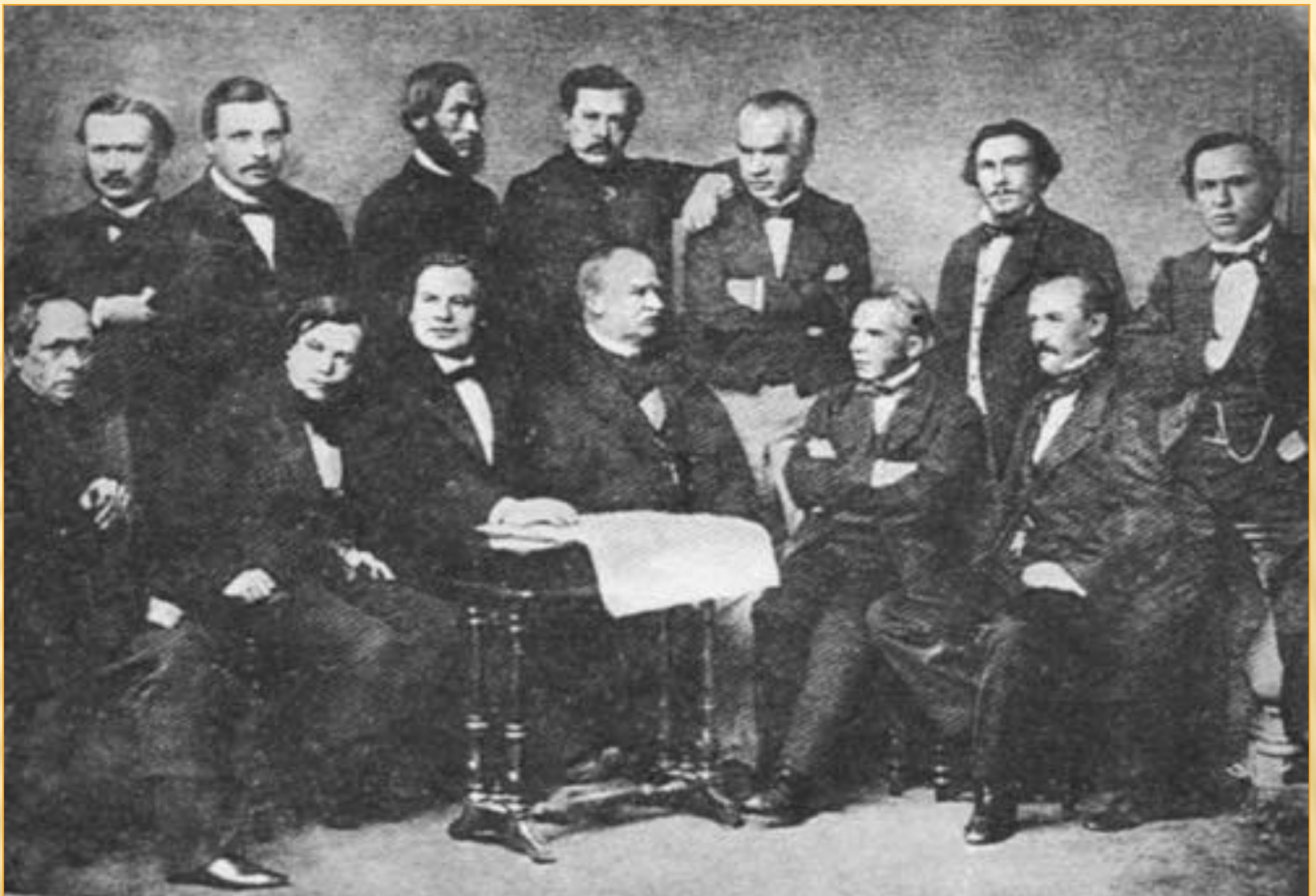
Литературное общество «Северная пчела»