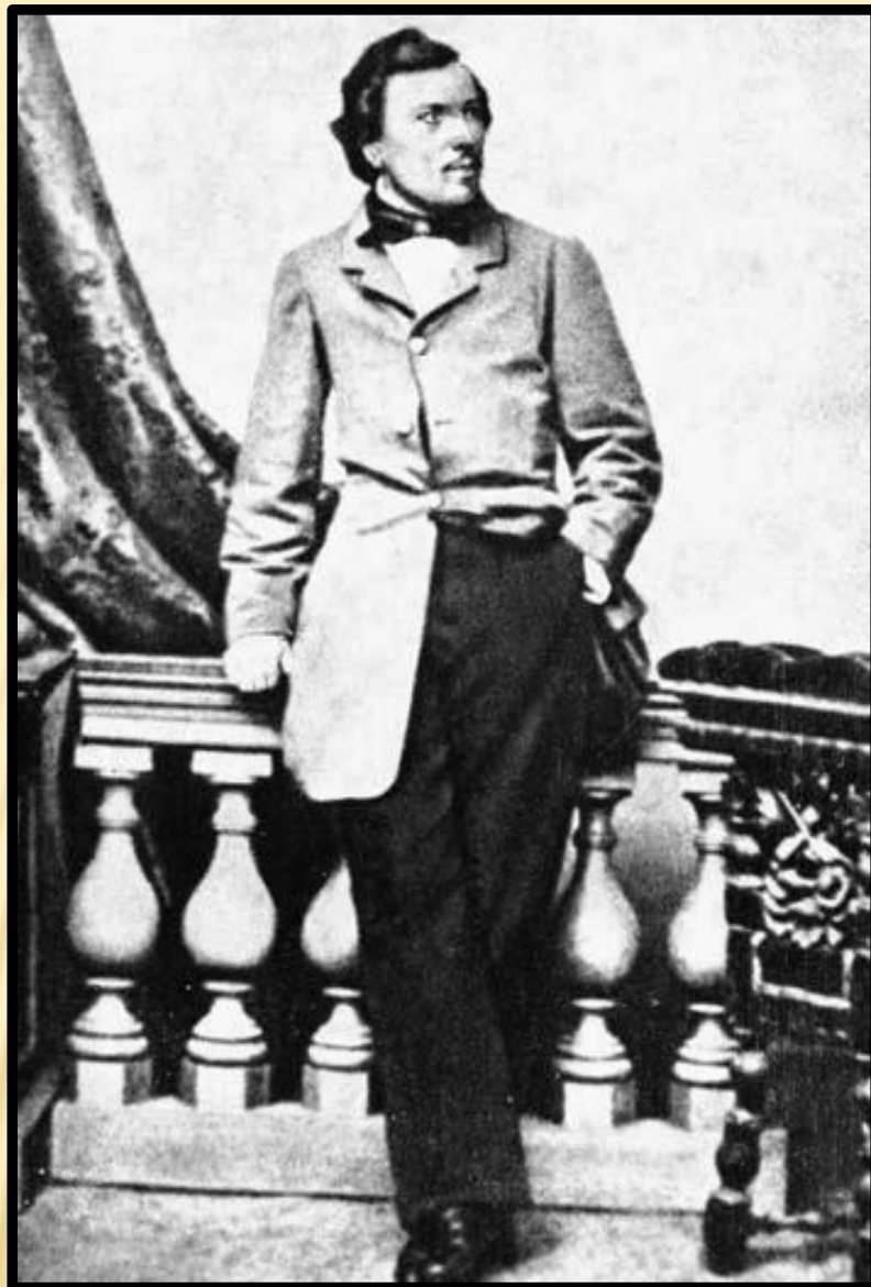
Н.С.Лесков Санкт-Петербург, 1860г.