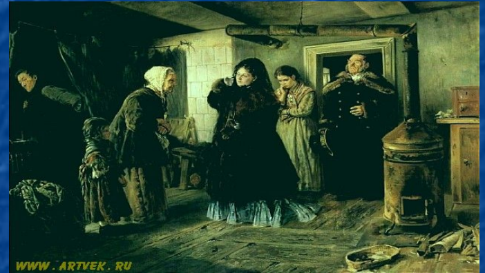
Социальный срез общества