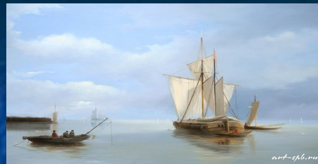
мирный труд итальянских рыбаков