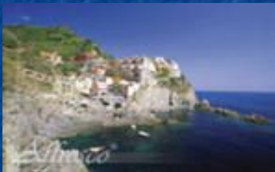
красота Капри, « которую бессильно выразить слово »»