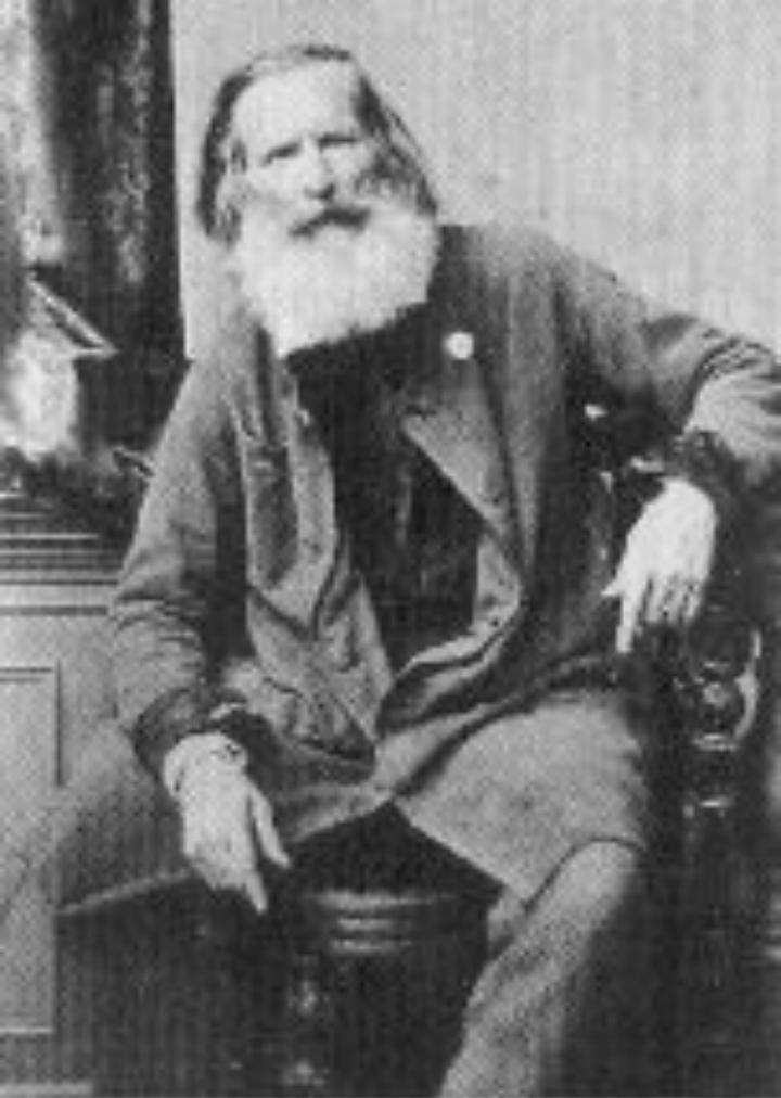
Н. А. МАЙКОВ

В Петербурге он сблизился с семьёй Майковых. (У)