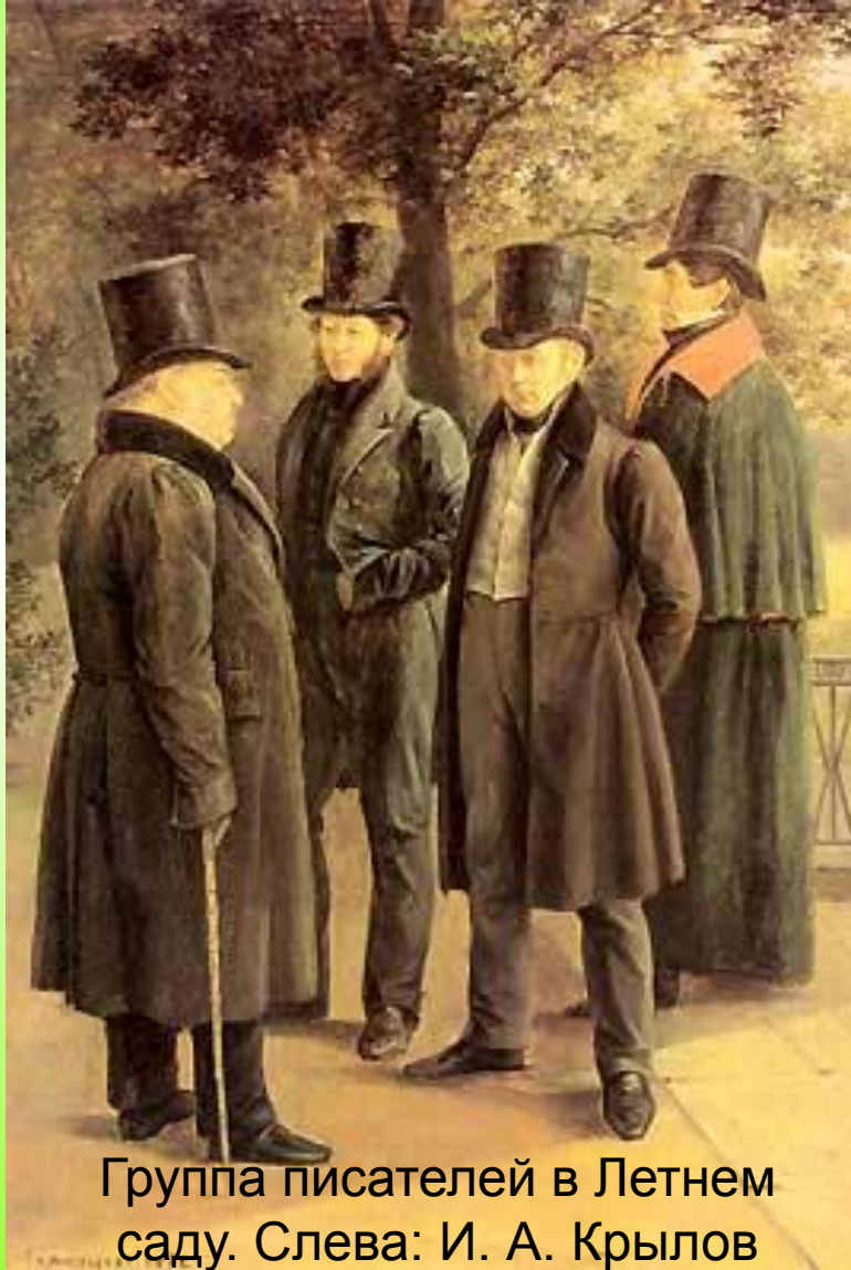
Группа писателей в Летнем саду. Слева: И. А. Крылов