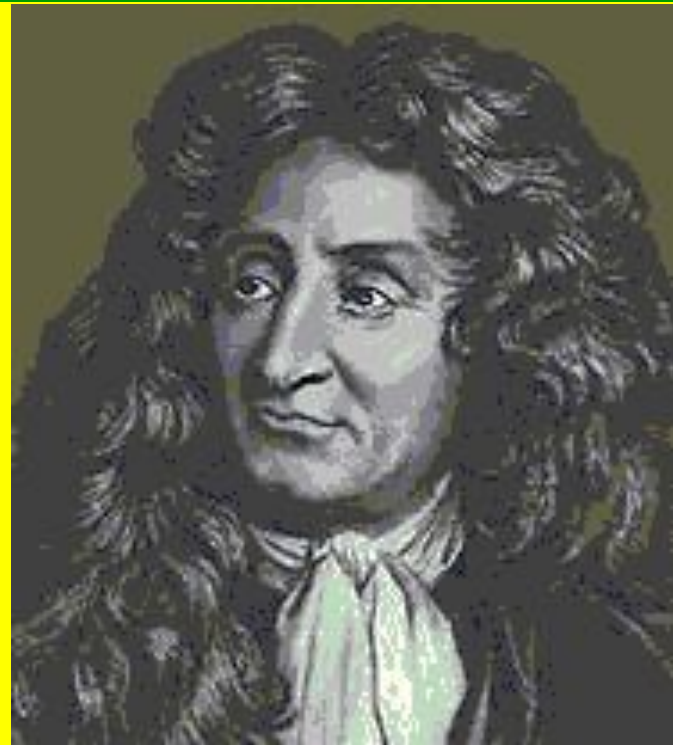
Лафонтен Жан де (1621 – 1695) – французский поэт, прославившийся как баснописец

Эзоп – древнегреческий баснописец (VI век до н. э.), считавшийся создателем басни. Легенды рисуют Эзопа юродивым, народным мудрецом, безвинно сброшенным со скалы.