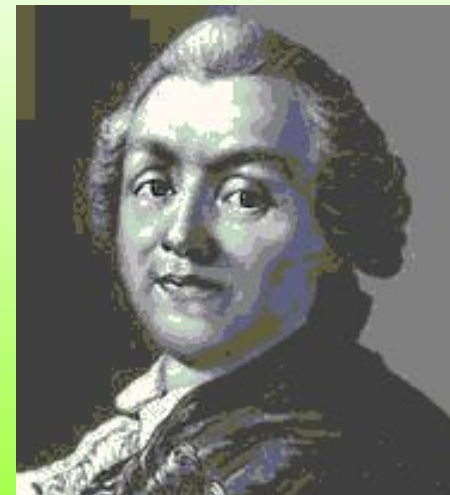
А. П. Сумароков