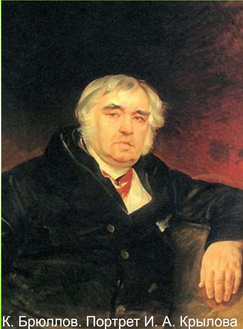
К. Брюллов. Портрет И. А. Крылова