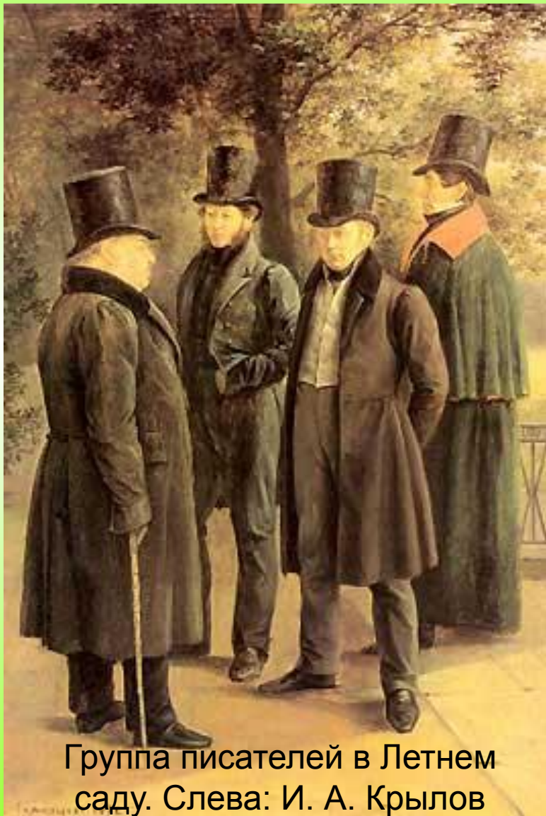
Группа писателей в Летнем саду. Слева: И. А. Крылов

В Петербург Крылов переехал в 1782 с Львовыми. С 1783 служил в Казенной палате в Петербурге, активно занимался самообразованием. Кроме французского, он выучился читать и писать по-немецки и по-итальянски. Хорошо играл на скрипке, выучил теорию музыки, разбирался в математике. У Львовых и, возможно, у драматурга Я. Б. Княжнина, Крылов познакомился практически со всем, довольно узким кругом литераторов и знатоков искусств того времени, в числе которых был и Г. Р. Державин с женой, покровительствовавшей Крылову.