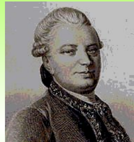
В. И. Майков