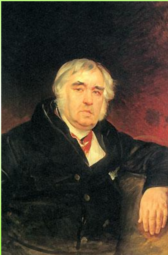
И. А. Крылов