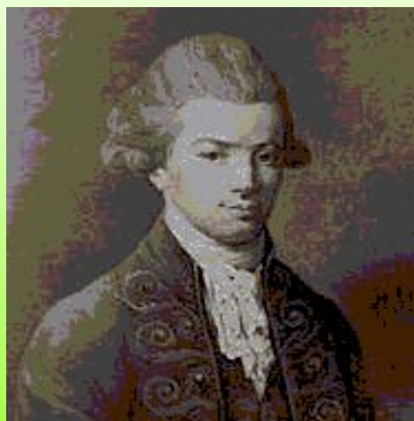
И. И. Хемницер