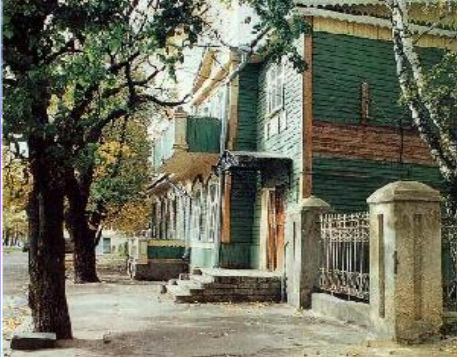
Дом-музей Н.С. Доскова