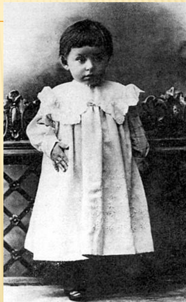
Иван Алексеевич Бунин

Родился будущий прозаик Иван Бунин в 1870. В детские годы Ивана дворянская семья Буниных жила в Воронеже, потом – в Орловской губернии. Там маленький Иван получил домашнее образование и в 11 лет поступил в Елецкую гимназию. Дома его также обучал старший брат.