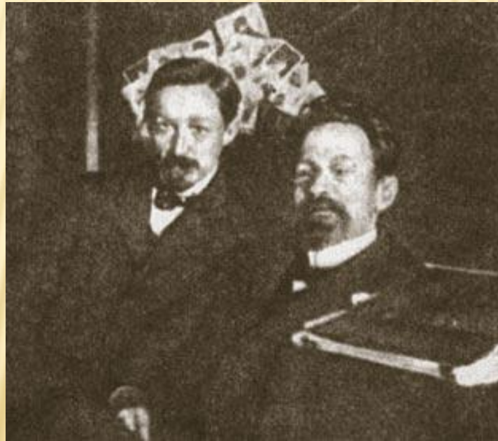
И. А. Бунин и А. П. Чехов

За последнее десятилетие XIX века – в начале XX века выходят сборники «Под открытым небом», «Стихотворения», «Листопад». Бунин знакомится с Антоном Павловичем Чеховым. 1903 и 1909 годы – автор был удостоен престижной Пушкинской премии.