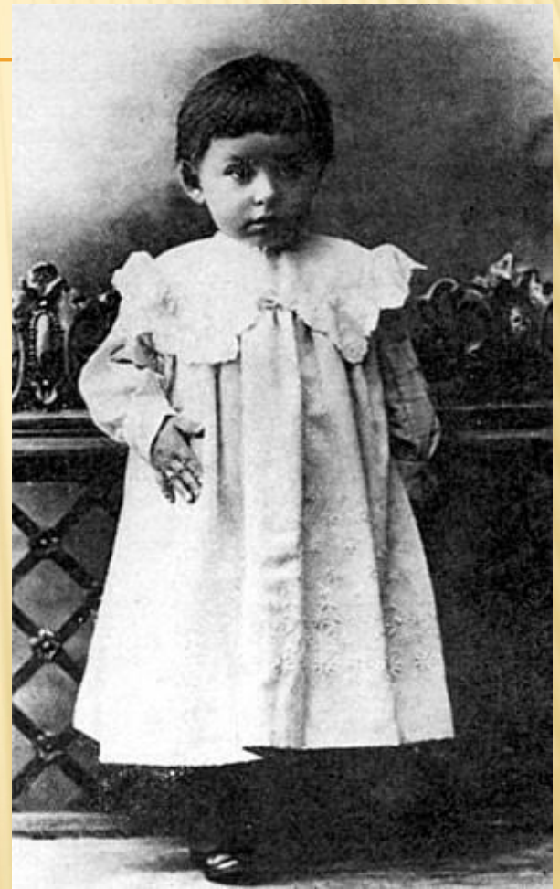
Иван Алексеевич Бунин

Родился будущий прозаик Иван Бунин в 1870. В детские годы Ивана дворянская семья Буниных жила в Воронеже, потом – в Орловской губернии. Там маленький Иван получил домашнее образование и в 11 лет поступил в Елецкую гимназию. Дома его также обучал старший брат.