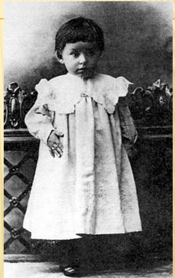
Иван Алексеевич Бунин

Родился будущий прозаик Иван Бунин в 1870. В детские годы Ивана дворянская семья Буниных жила в Воронеже, потом – в Орловской губернии. Там маленький Иван получил домашнее образование и в 11 лет поступил в Елецкую гимназию. Дома его также обучал старший брат.