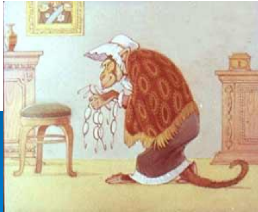
Иллюстрация к басне «Мартышка и очки»