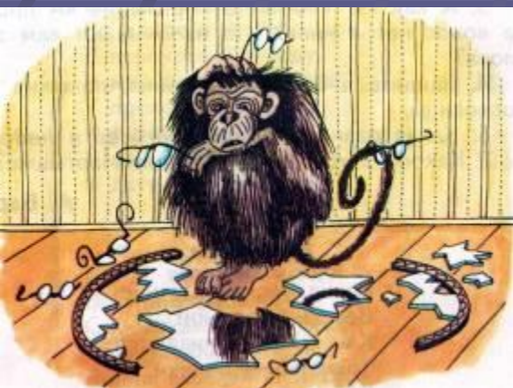
Мартышка и очки