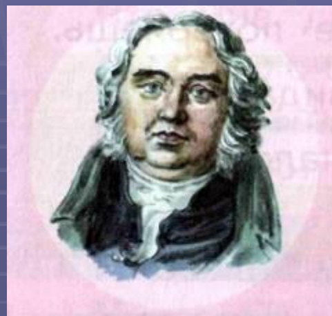
Иван Андреевич Крылов