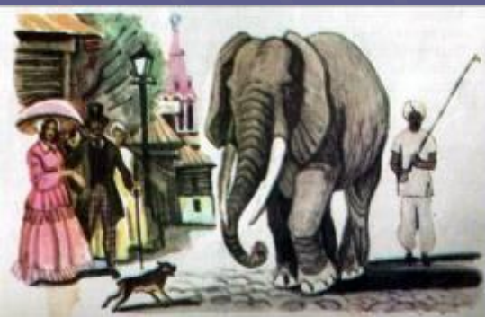
Слон и Моська