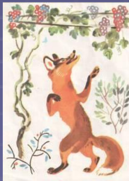
Лисица и виноград