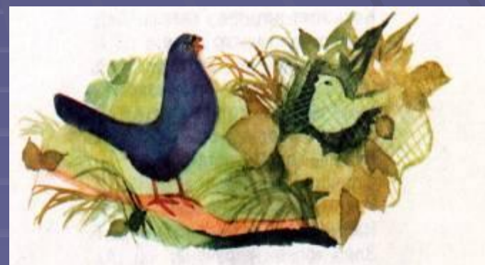
Чиж и Голубь