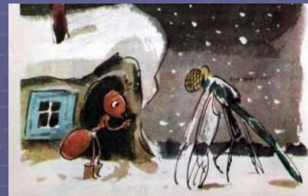
Стрекоза и Муравей