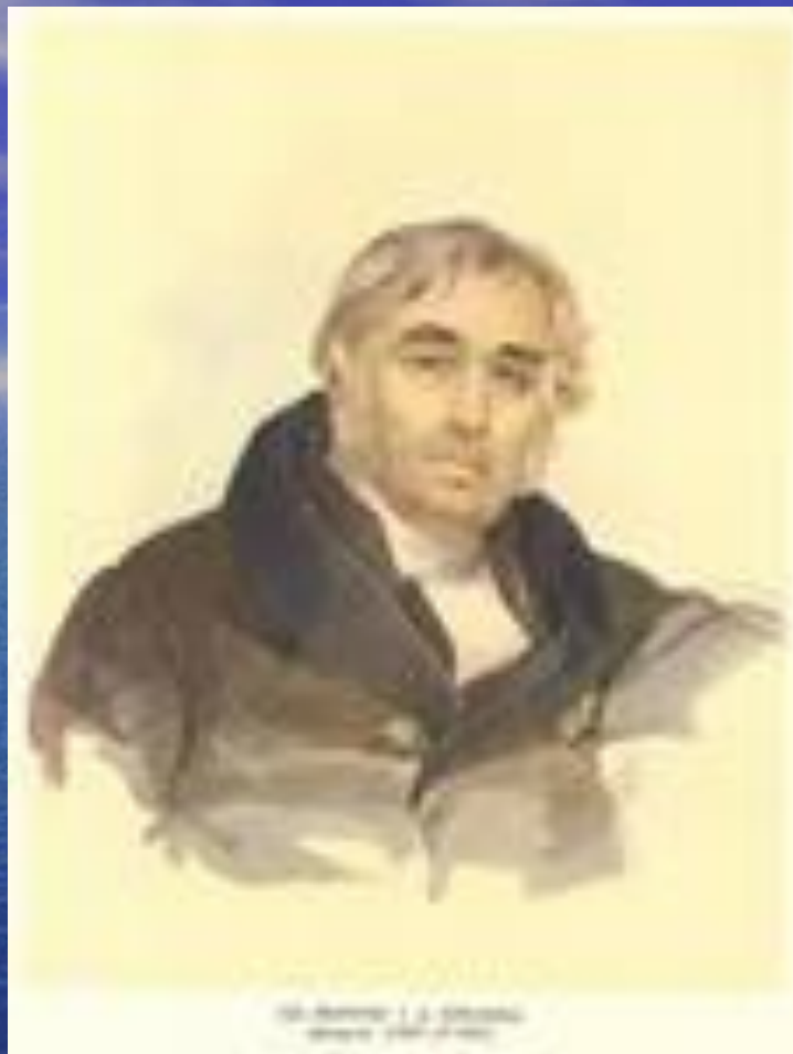
Иван Андреевич Крылов