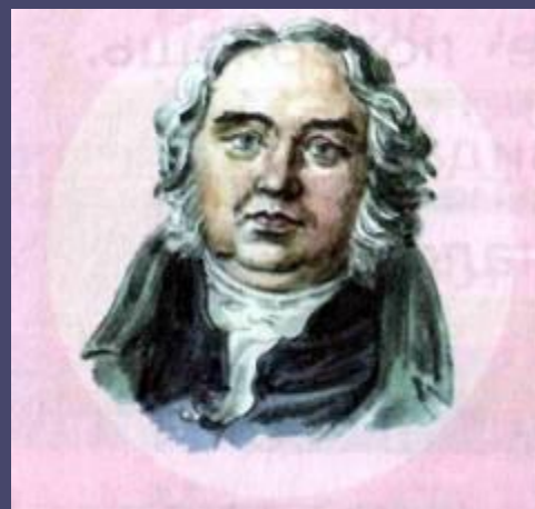
Иван Андреевич Крылов