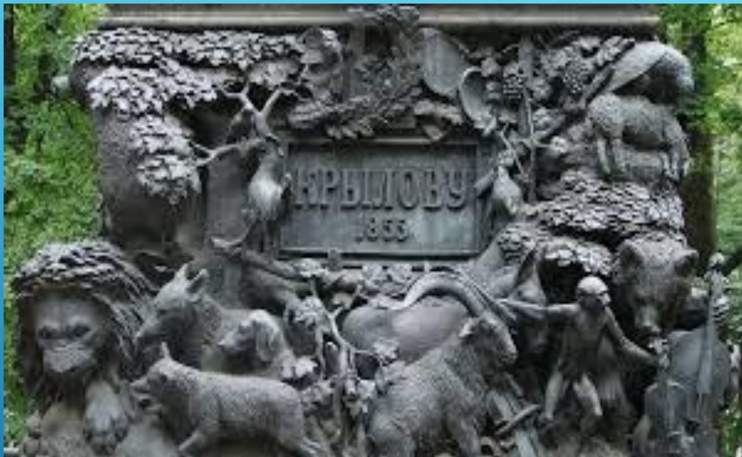
ПАМЯТНИК И. А. КРЫЛОВУ