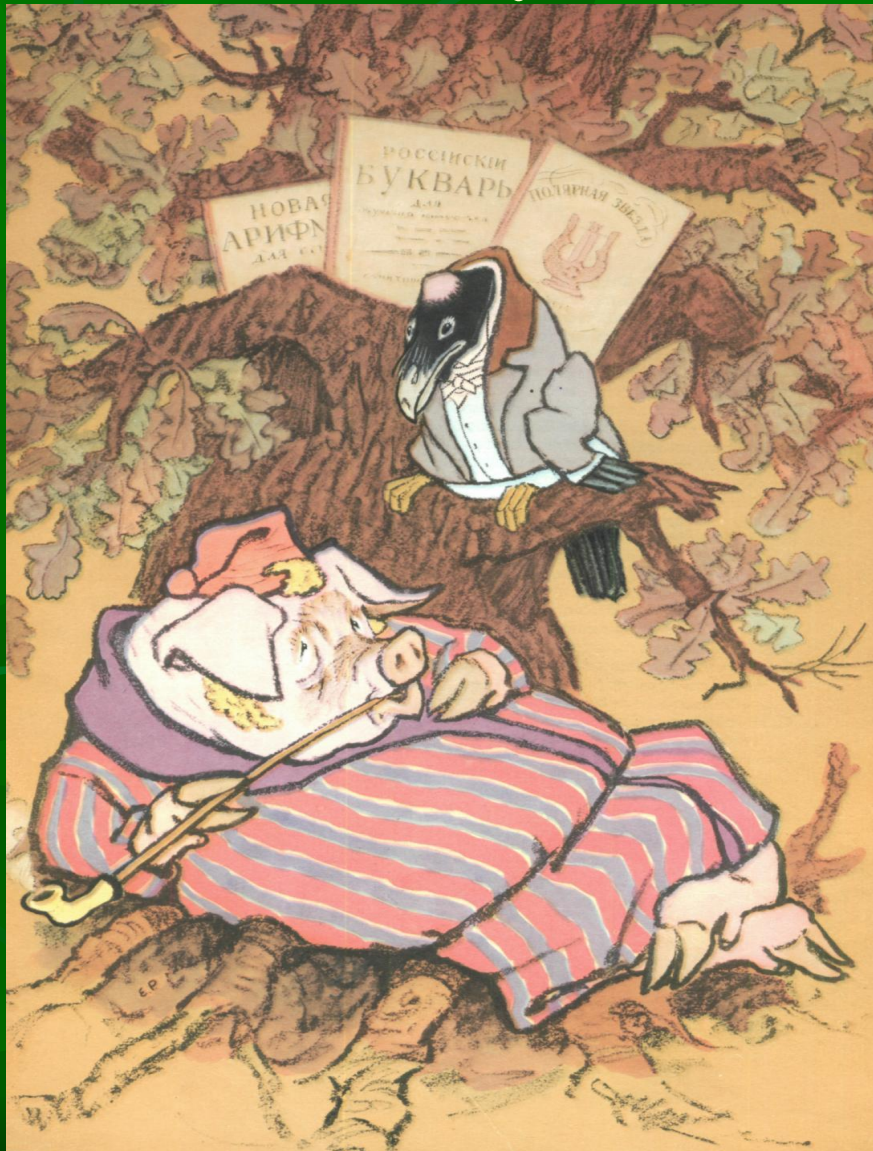
Иллюстрация басни И.А.Крылова «Свинья под дубом»