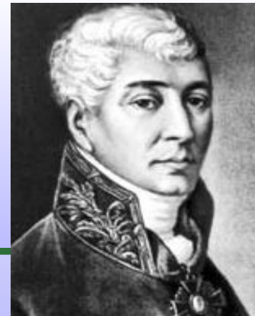
Иван Иванович Дмитриев

Дмитриев значительно преобразует традиционный жанр. Его басни лишены социальных мотивов и сатирического элемента. Поэт призывает довольствоваться тем, что они имеют и не роптать на судьбу.