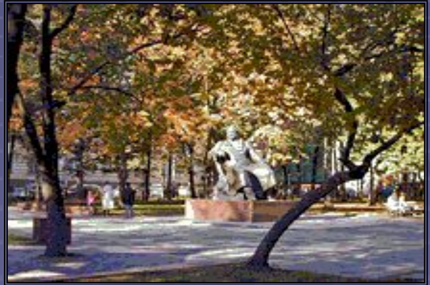
Памятник И.А.Крылову на Патриарших прудах в Москве. Скульпторы А.А.Древин и Д.Ю.Митлянский. 1976 год.