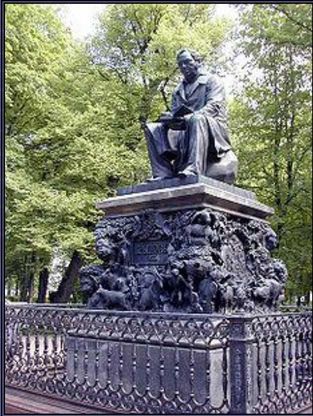
Памятник и.А.Крылову в Летнем саду Санкт-Петербурга. Скульптор Г.Клодт. 1855 год.