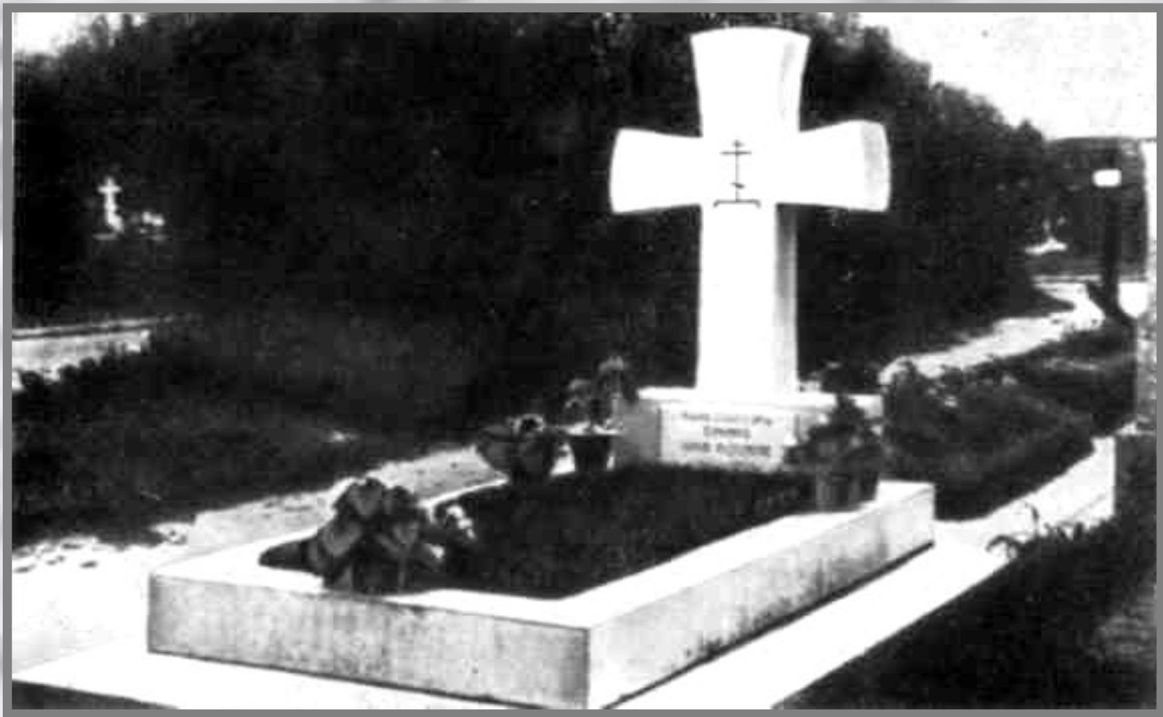
Русское кладбище под Парижем Сент-Женевьев де Буа. Могила Ивана Алексеевича Бунина.