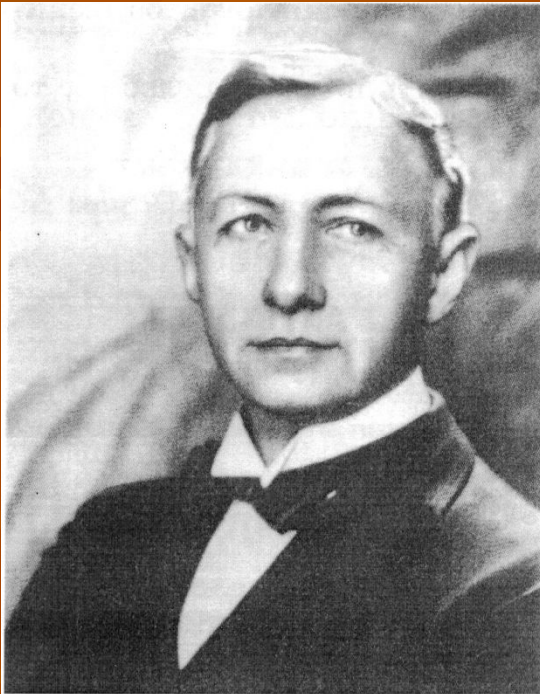
ИВАН АЛЕКСЕЕВИЧ БУНИН 1870 - 1953