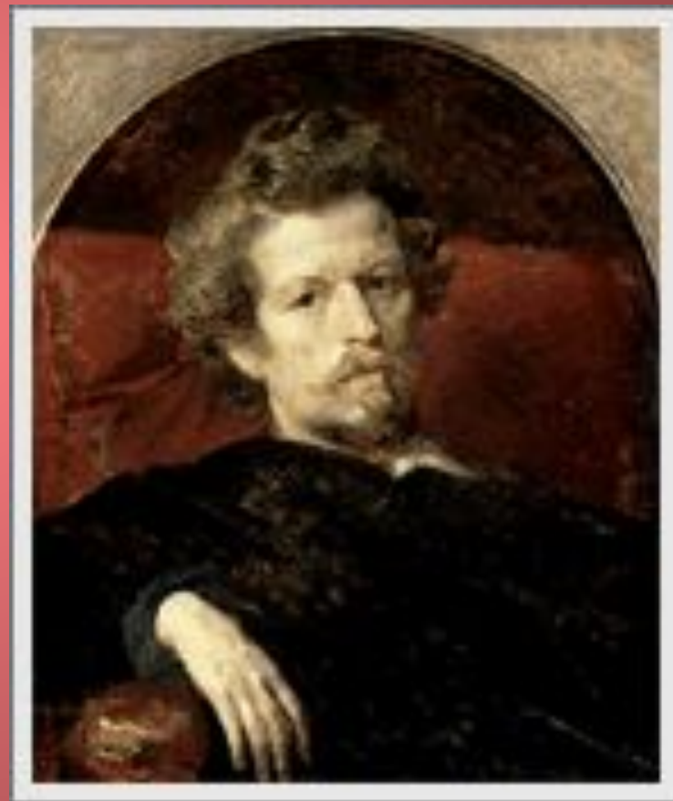
БРЮЛЛОВ КАРЛ ПАВЛОВИЧ (1799 - 1852)