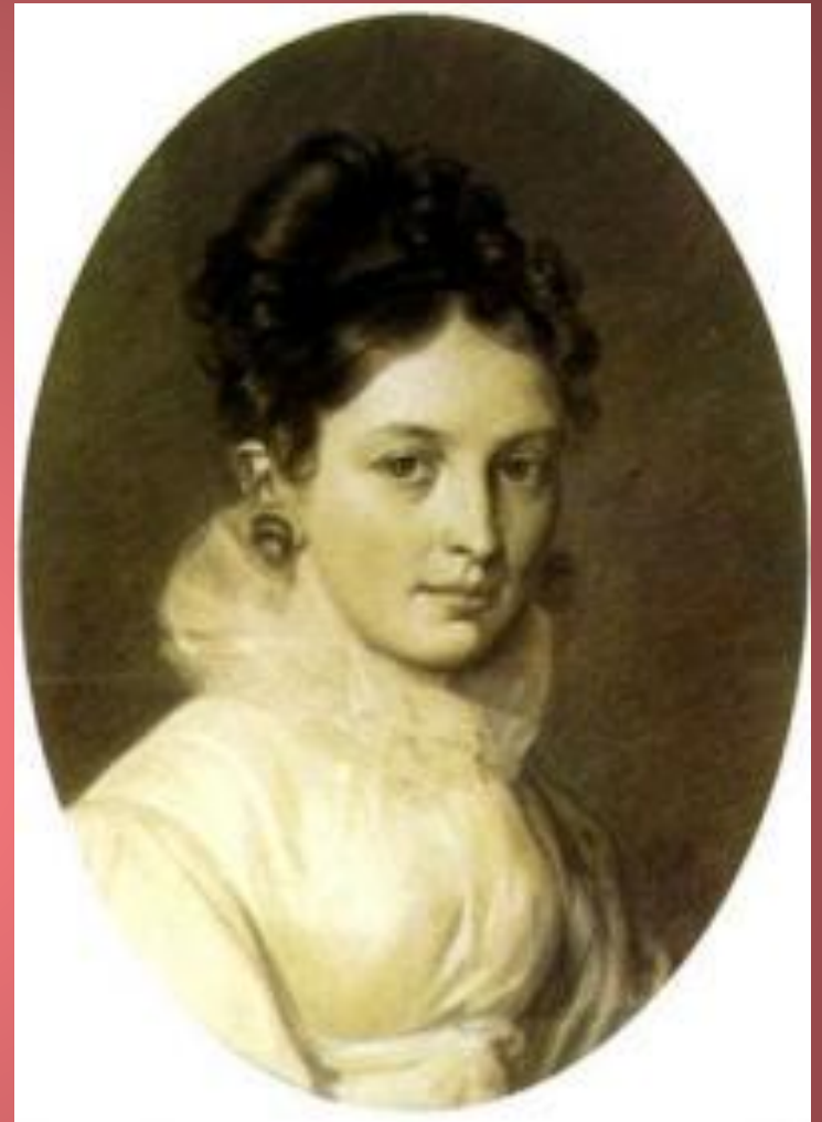
Екатерина Павловна Бакунина,