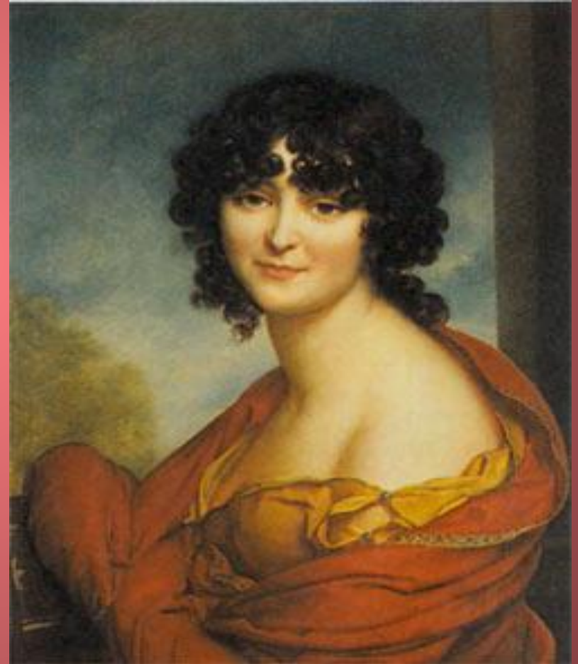
Евдокия Ивановна Голицына

Не одно стихотворение посвятил Пушкин Евдокии Голицыной.