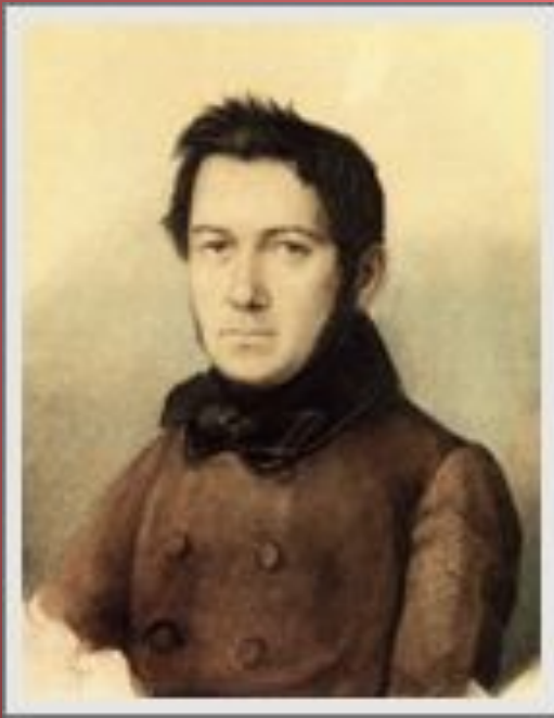
•ГЛИНКА МИХАИЛ ИВАНОВИЧ

На следующий день, провожая Анну Петровну, Пушкин вложил в книгу листок с посвящением "К ***". Через несколько лет, в 1840 году, М.И. Глинка положил эти стихи на музыку. Романс М.И. Глинки был посвящен старшей дочери Анны Керн - Екатерине.