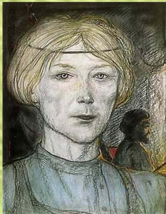
художник И. Глазунов