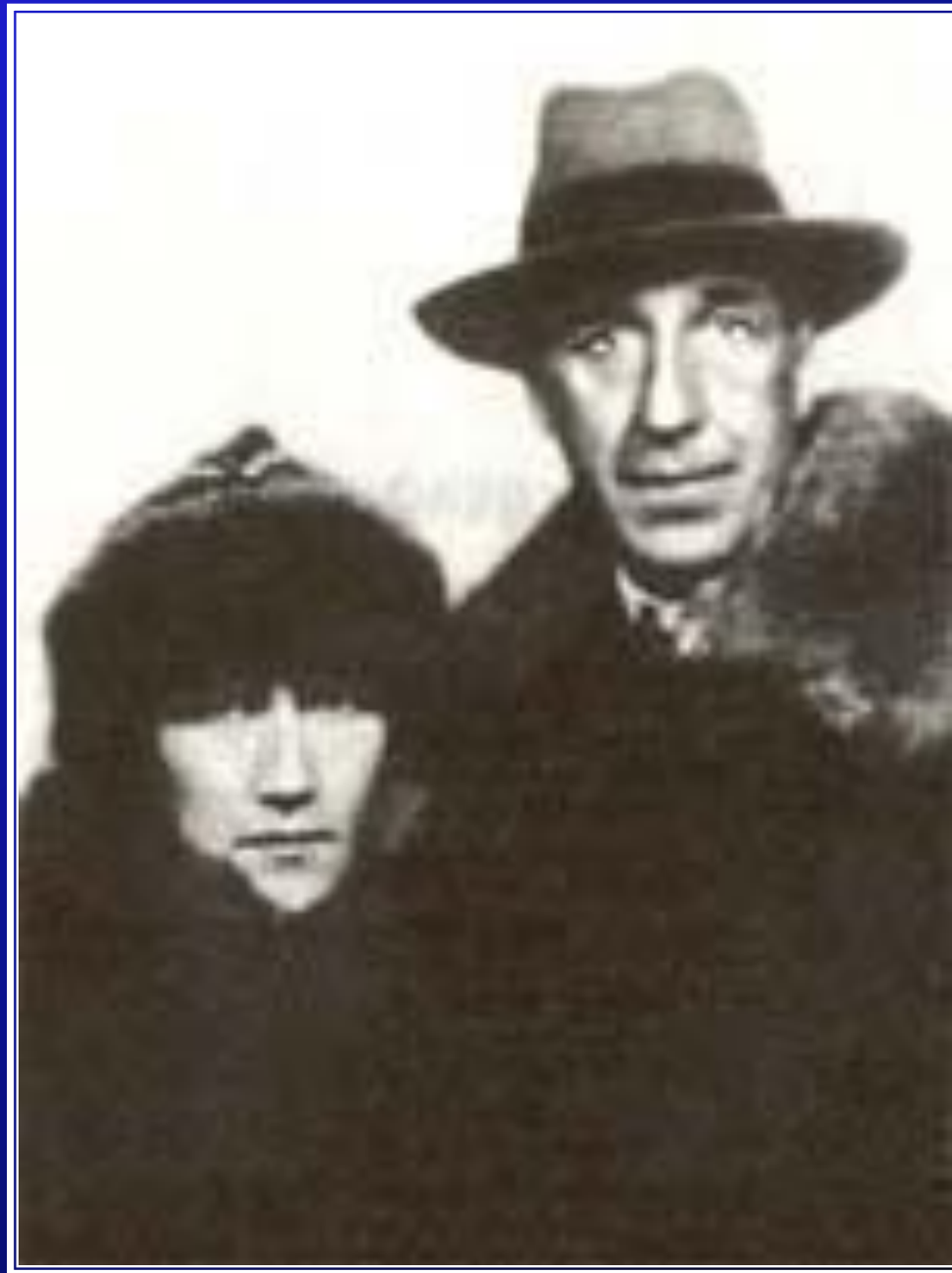
И.Северянин и Ф.Круут

« Мы вернемся к месту нашей встречи, Где возникли ласковые речи Где возникли чистые мечты, Я, увидев нашей встречи место, Вспоминаю дни, когда была невеста Ты, моя возлюбленная, ты! »