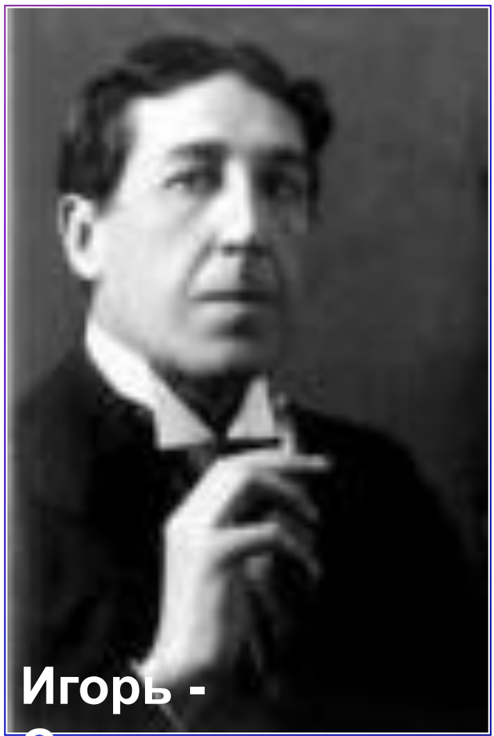
Игорь - Северянин