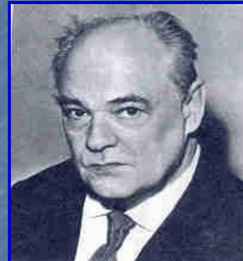
Виталий Валентинович Бианки