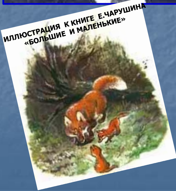
ИЛЛЮСТРАЦИЯ К КНИГЕ Е. ЧАРУШИНА «БОЛЬШИЕ И МАЛЕНЬКИЕ»