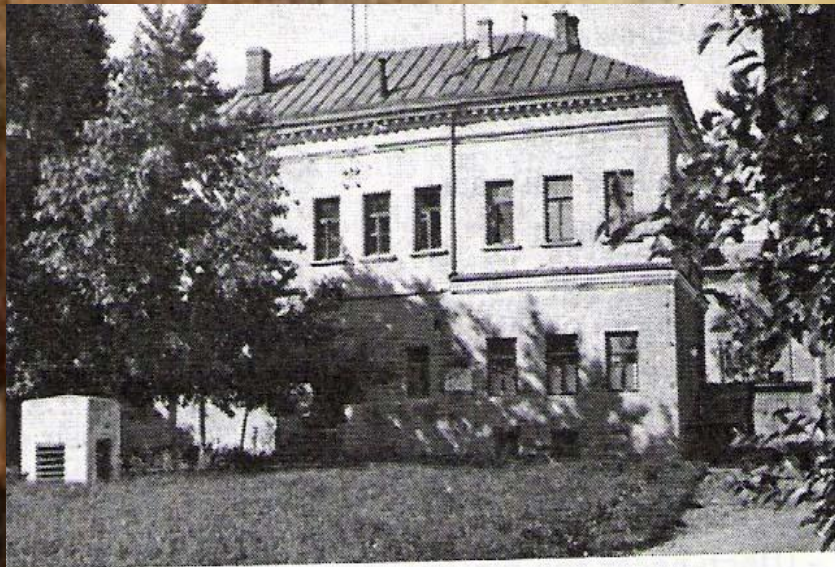
Главный дом усадьбы. 1960-е гг.

Иван Иванович Лажечников. Иван Иванович Лажечников родился 25 сентября 1792 года в Коломне.