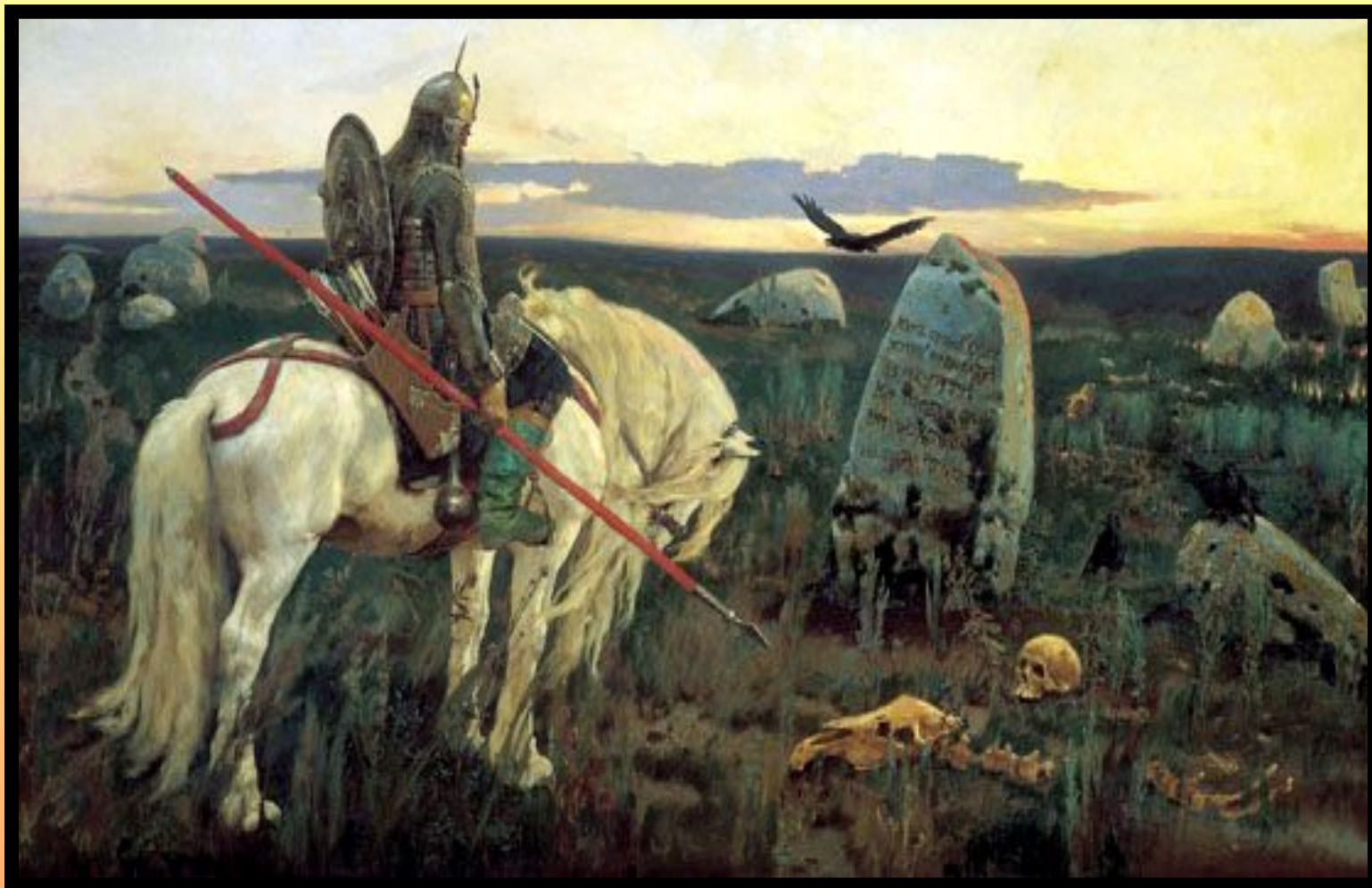
В. Васнецов. Витязь на распутье Холст, масло. 1882 г. Москва, Россия. Государственная Третьяковская галерея