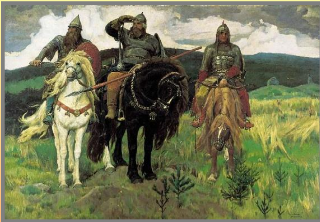
В. Васнецов. Богатыри 1881-1898, холст, масло, 295,3x446 см Государственная Третьяковская галерея, Москва