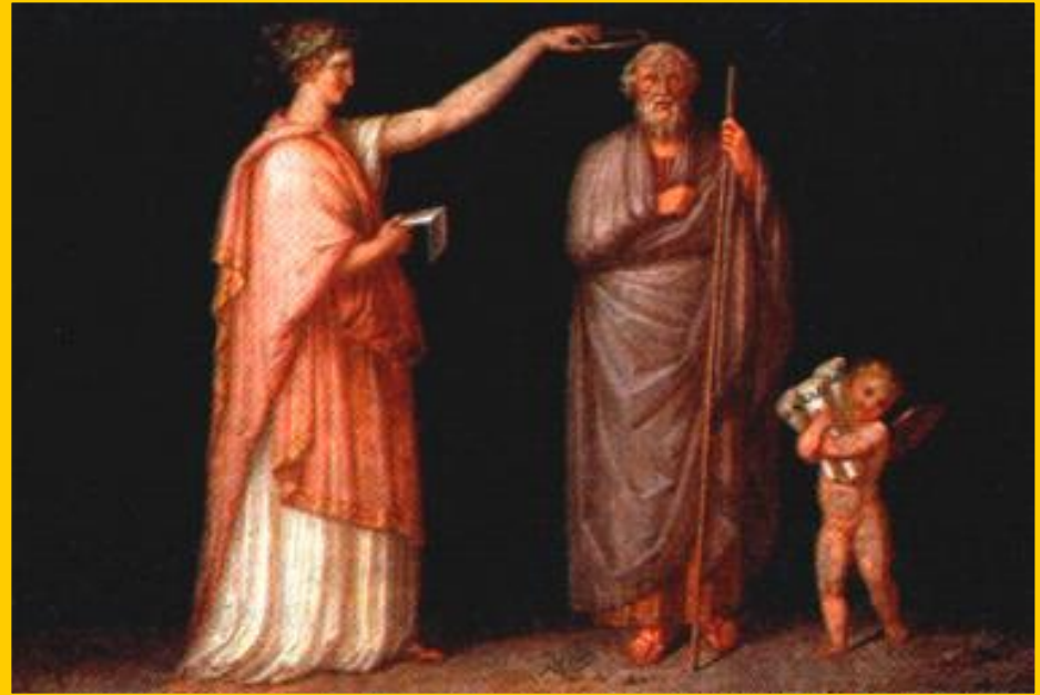
Гомер и Каллиопа

Одной из самых ярких страниц мировой культуры являются поэмы Гомера «Илиада» и «Одиссея». До сих пор 7 греческих городов претендуют на то, чтобы называться родиной Гомера. Древние греки знали поэмы наизусть.