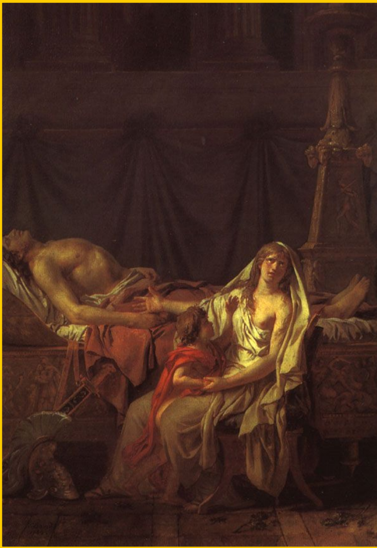
Андромаха у тела Гектора.

На время похорон противники заключили перемирие. Тело Гектора сожгли на большом холме, а его кости уложили в могилу и насыпали высокий холм. «Так погребли они конеборного Гектора»-этими словами поэма заканчивается.