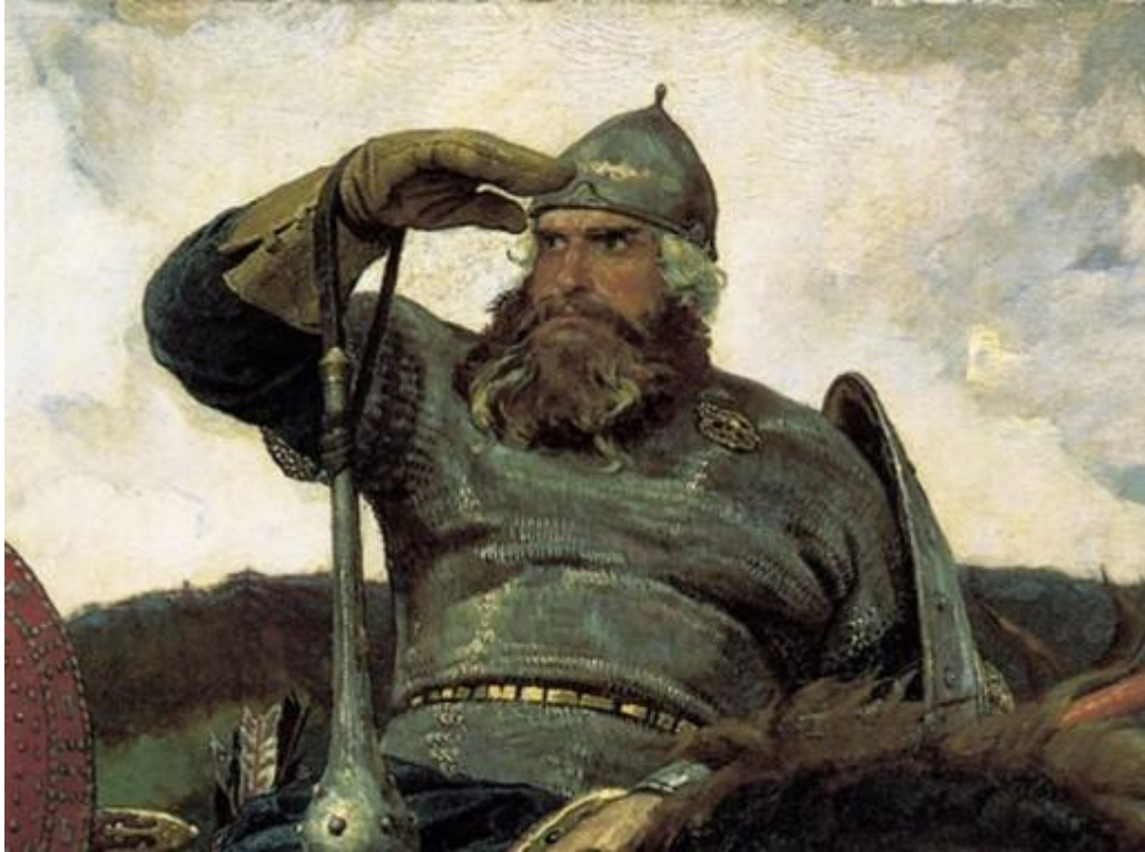
В. Васнецов. Илья Муромец . (Фрагмент картины «Богатыри»)