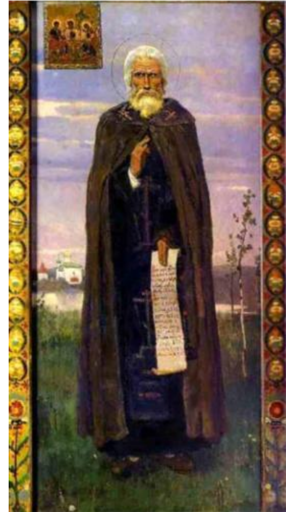
В. М. Васнецов. Сергий Радонежский 1882, Икона для церкви в Абрамцево Государственный историко-художественный и литературный музей-заповедник "Абрамцево", Абрамцево, Московская область