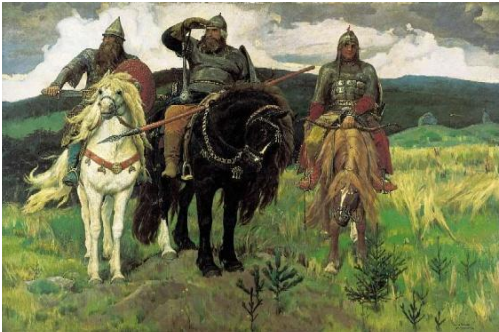
В. Васнецов. Богатыри 1881-1898, холст, масло, 295,3х446 см Государственная Третьяковская галерея, Москва