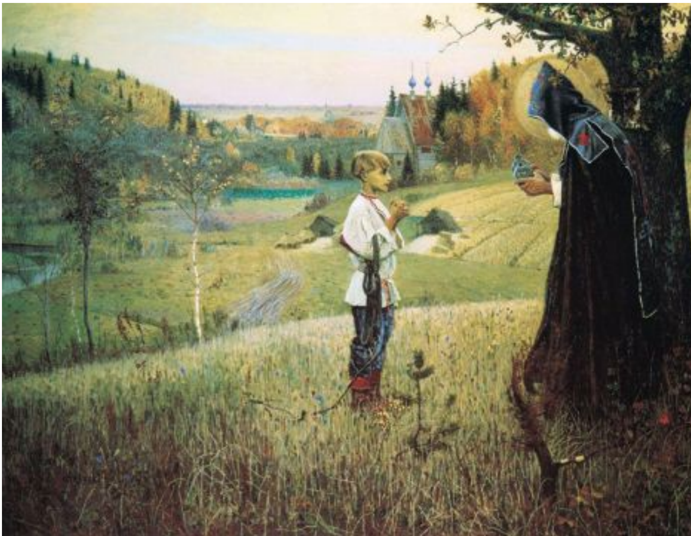
Михаил Васильевич Нестеров. Видение отроку Варфоломею, 1889-1890