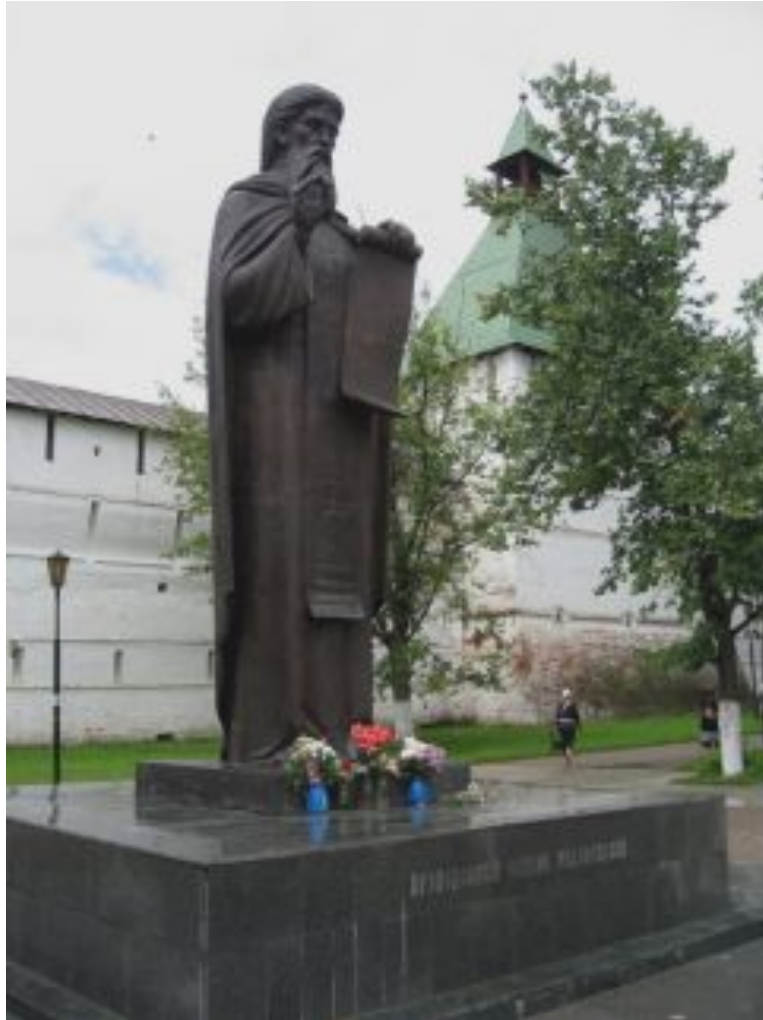
Памятник преподобному Сергию Радонежскому. г. Сергиев Посад