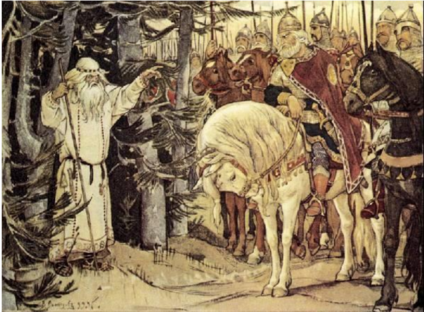
В. М. Васнецов. Встреча Олега с волхвом Иллюстрация к "Песни о вещем Олеге" А.С.Пушкина 1899г,акварель, Государственный Литературный музей, Москва