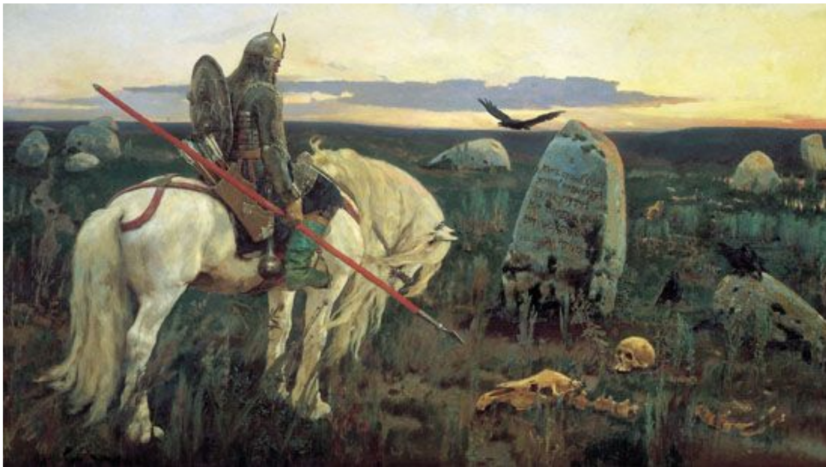
В. Васнецов. Витязь на распутье Холст, масло. 1882 г. Москва, Россия. Государственная Третьяковская галерея