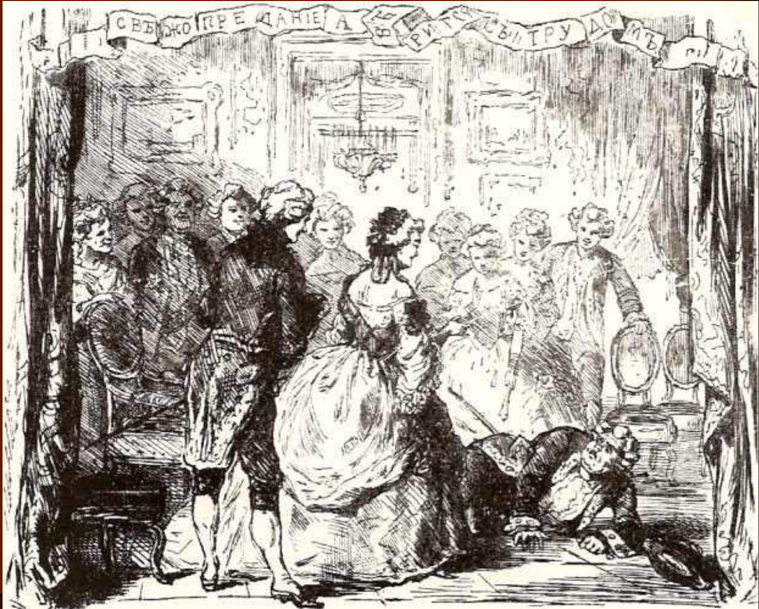
Гравюра на дереве. 1862

Теперь, чтобы смешить народ Отважно жертвовать затылком?