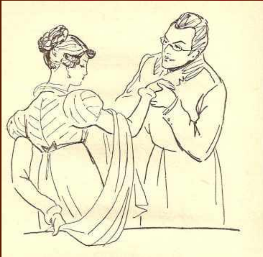
Чацкий и Софья