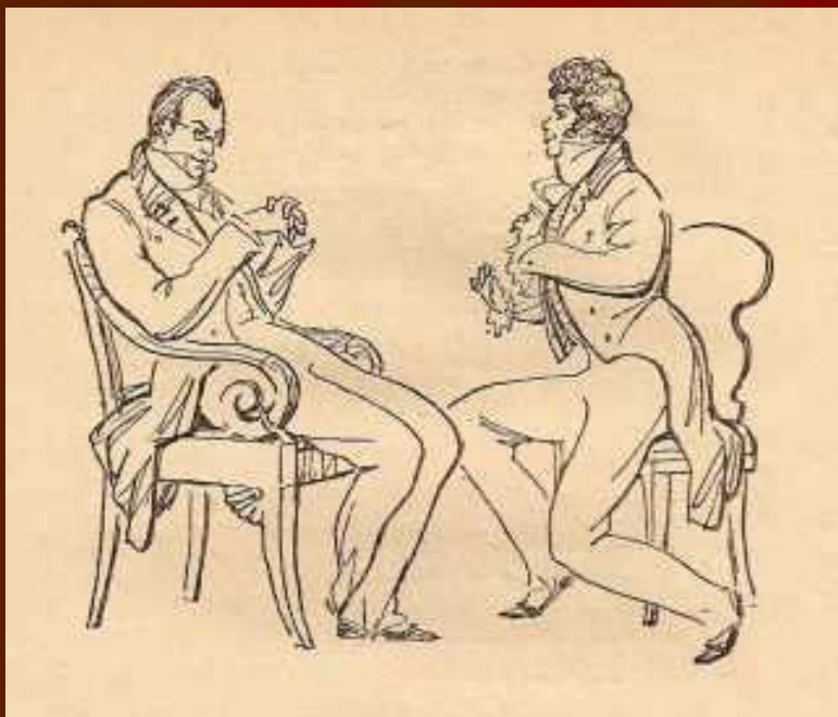
Чацкий и Молчалин