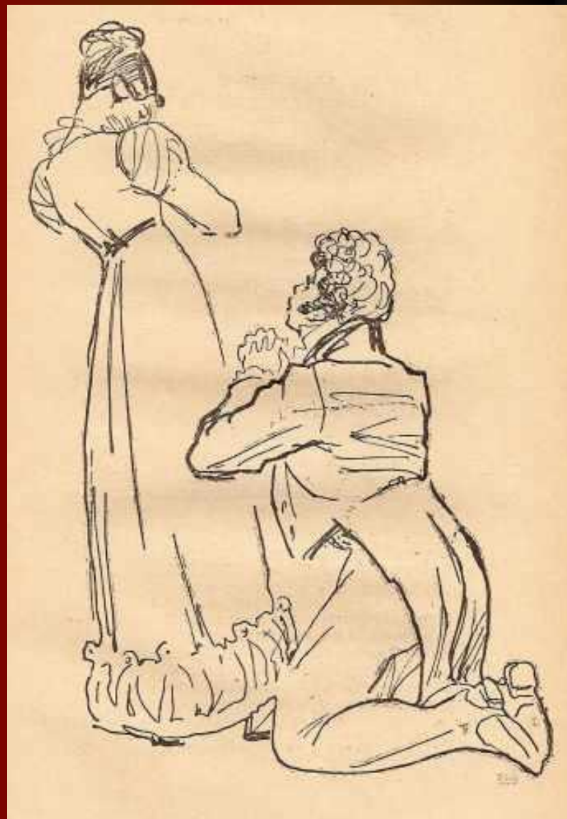
Молчалин и Софья