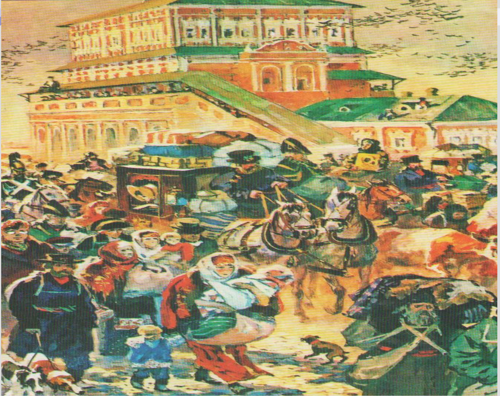
А. Николаев. Жители покидают Москву