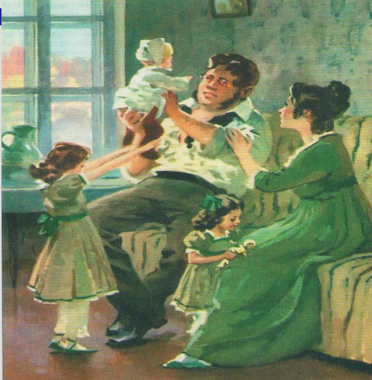
А. Николаев. Семья Безуховых. 1970 год