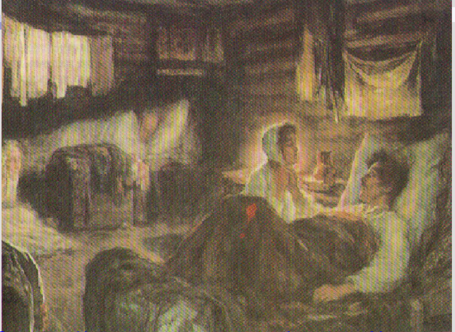
Свидание Наташи с раненым князем Андреем в Мытищах Л. Пастернак. 1893 год