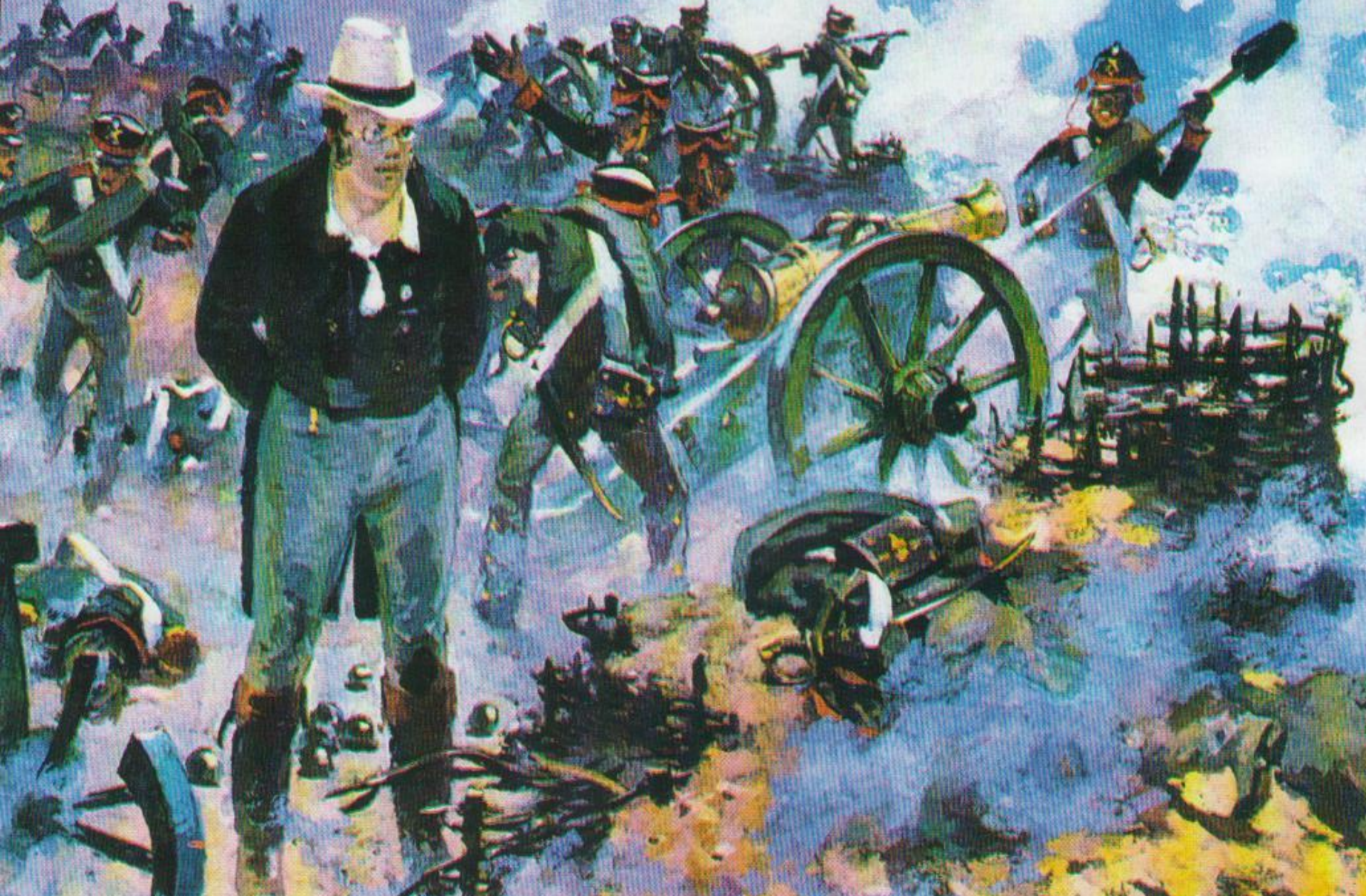
А. Николаев. Пьер на Бородинском поле