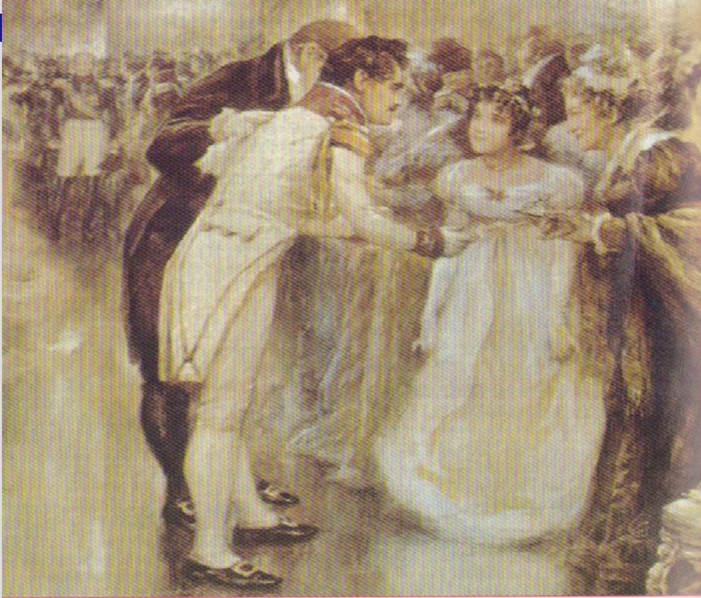
Пьер Безухов знакомит Наташу с князем Андреем Художник Л. Пастернак. 1893 год