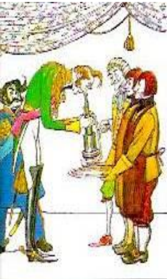
Кукрыниксы. Государь Александр Александрович рассматривает блоху через «мелкоскоп»

Государю и Платову предложили рассмотреть через «мелкоскоп» «нимфозорию», выкованную из чистой «аглицкой» стали в изображении блохи. Выразительность сцены, её насыщенность живописными подробностями вызвали отклики как в серии иллюстраций Кузьмина, состоящей из 80 рисунков, так и в графическом комментарии к сказу художников Кукрыниксов, который включил в себя 64 иллюстрации.