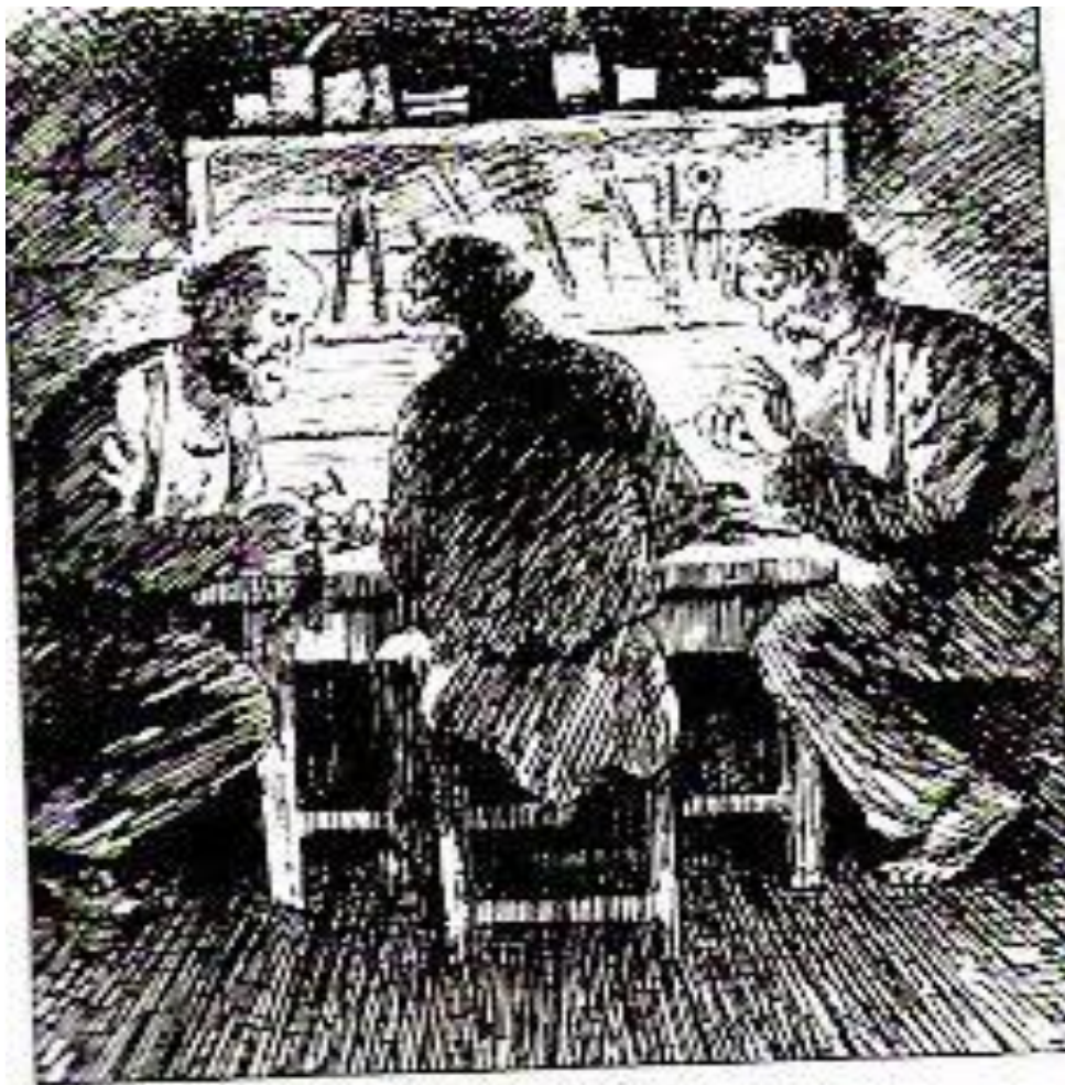
Н.В.Кузьмин. Тульские мастера за работой

Подлинными вершителями событий выступают в сказе косой Левша и его товарищи. Они взялись выполнить государев заказ и на них «теперь почивала надежда нации».