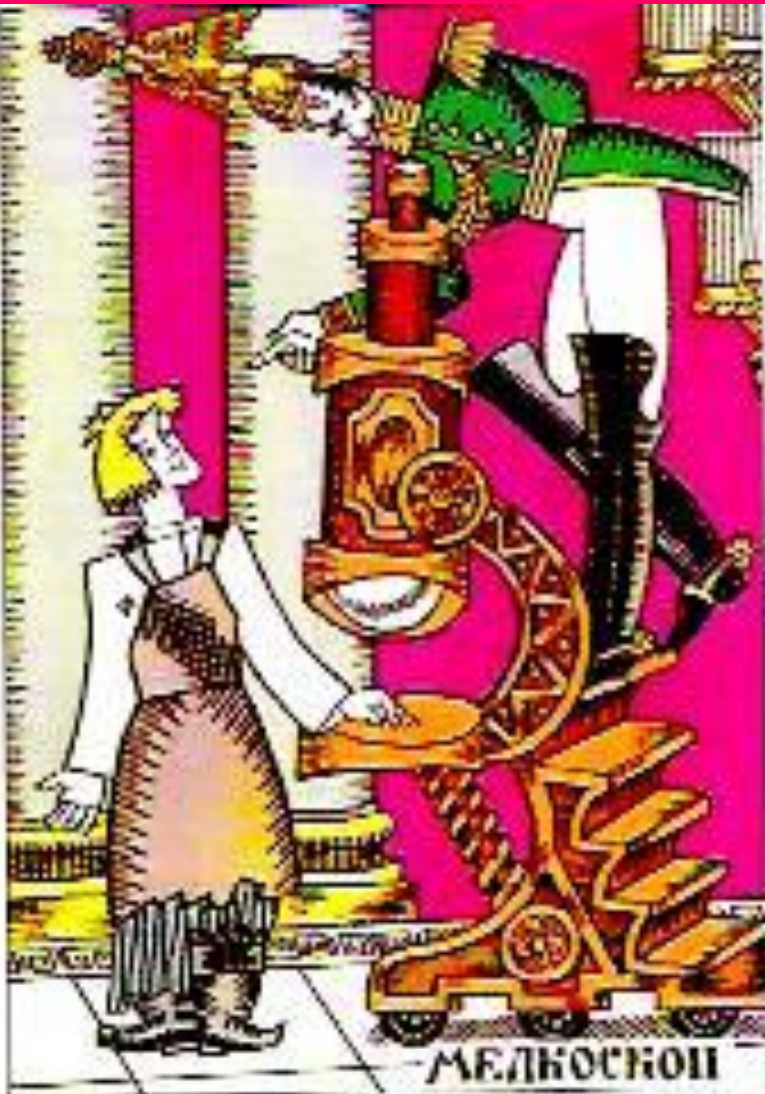
А.Г.Тюрин. Леша и император Николай Павлович возле мелкоскопа

Этот рисунок ироничный. На иллюстрации Кукрыниксов государь согнулся неправдоподобно, что кажется в его спине нет позвонков. А в рисунке А. Тюрин фигура императора кажется, напротив, деревянной, негнущейся. Художник искусно использует приём преувеличения, когда мелкоскоп, который когда-то Платов «в карман спустил», снабжён ступенями. Да и головной убор государя тяжеловат, что вызывает у читателя улыбку. Преувеличение в рисунке Тюриня является одним из средств передачи иронии, свойственной сказу Лескова.