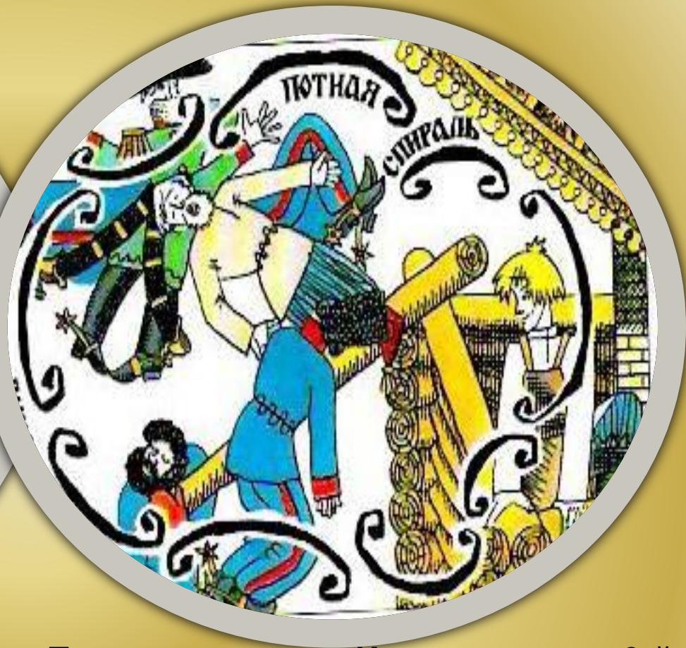
«Потная спираль». Иллюстрация к 9-й Главе сказа. 1962 – 1965.

Иллюстрация повествует о том, как Платов «прикатил» в Тулу. Слово «дым» вызывает улыбку, а надписи «бегут», «ещё бежит» усиливают динамику действия, переданную в рисунке.