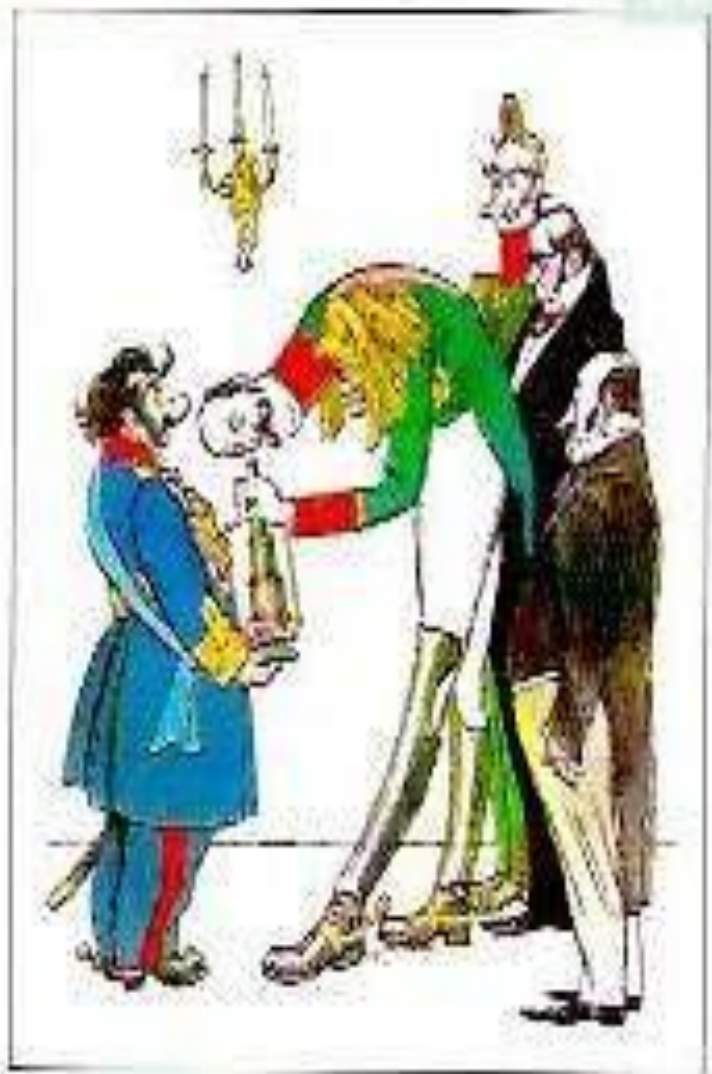
Кукрыникины. Государь Николай Павлович рассматривает стальную блоху через микроскоп

Эта иллюстрация напоминает иллюстрацию к 3-й главе, когда государь Александр Павлович рассматривает блоху через микроскоп в Англии. Это же делает и государь Николай Павлович, но в Петербурге. Художник выразил отношение каждого царя к английской блохе. Александр Павлович не верит в великие силы своего народа.