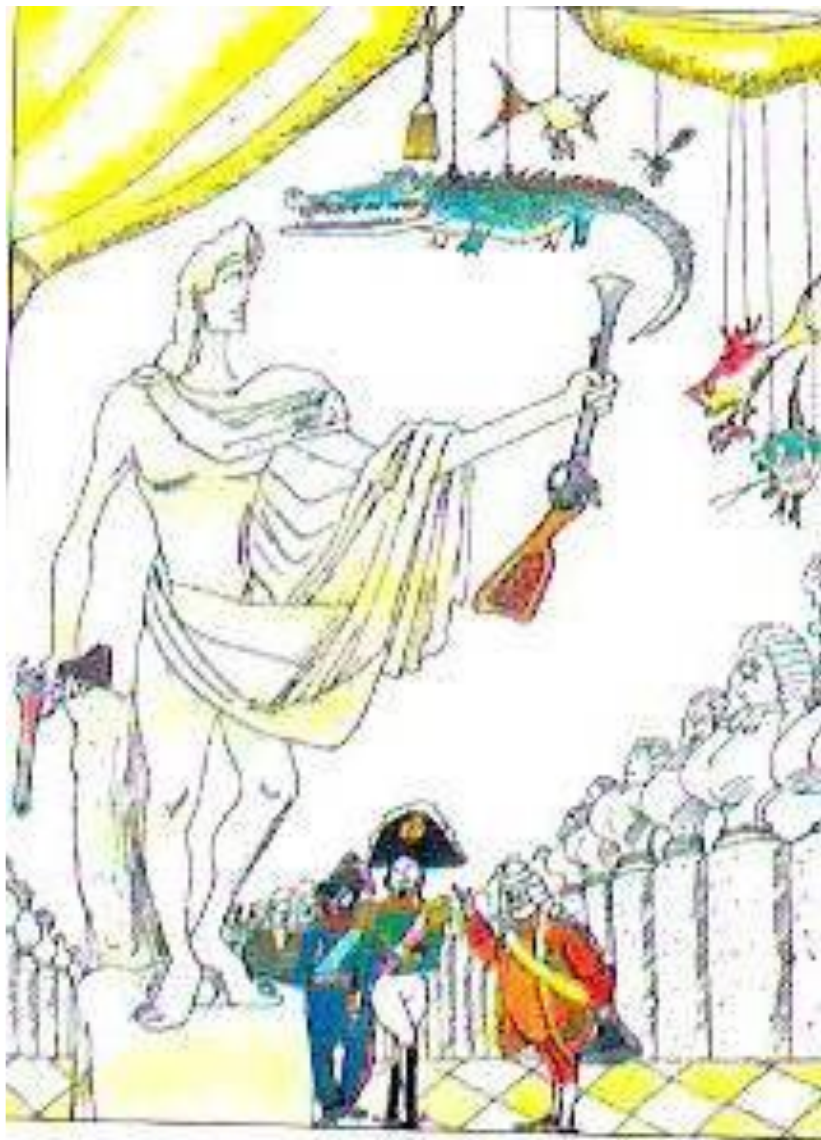
Кукрыниксы. Государь с Платовым в кунсткамере

Хуожники Кукрыниксы. Государь с Платовым в кунсткамере. Иллюстрация ко 2 главе сказа.1974 г.