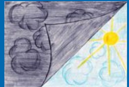
Работы уч-ся 10 «А» класса (2007г.)