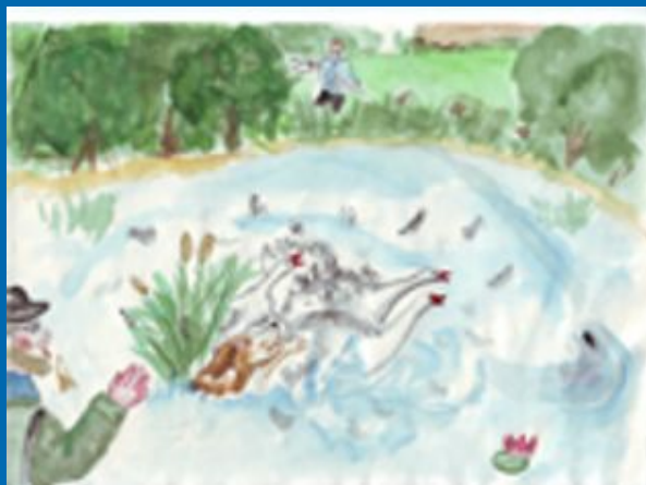
Иллюстрация к рассказу «Вася Весёлкин». Автор – Федулова Женя, 6 «Д» (2000г.)