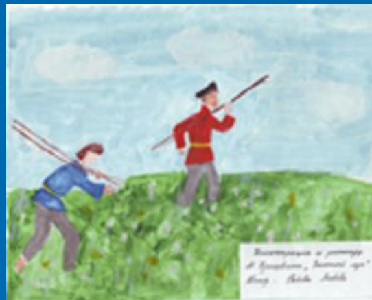
Иллюстрация к рассказу «Золотой луг». Автор – Рябова Люба, 6 «Б» (2004г.)