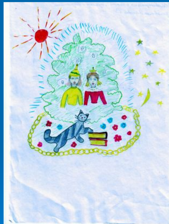
Рисунок Агаповой Валерии, 5 «Б»,(2007г.)