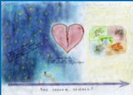
Работа учащихся 10 «Г» класса (1999г.)