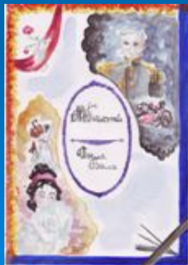
Работа Федуловой Жени, 8 «Д»(2002г.)