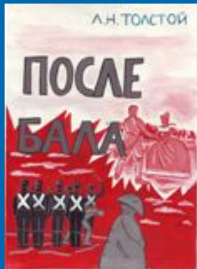
Работа Привалова Димы, 8 «Д» (2002г.)