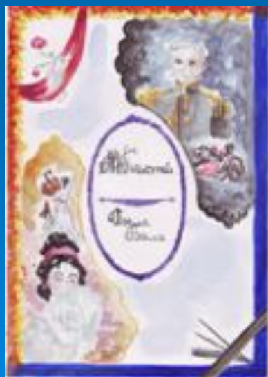
Работа Федуловой Жени, 8 «Д»(2002г.)