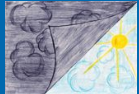
Работы уч-ся 10 «А» класса (2007г.)