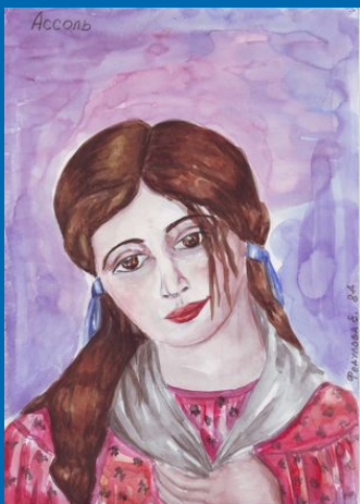
Ассоль. Работы Федуловой Жени, 8 «Д»(2002г.)