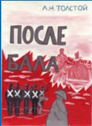
Работа Привалова Димы, 8 «Д» (2002г.)