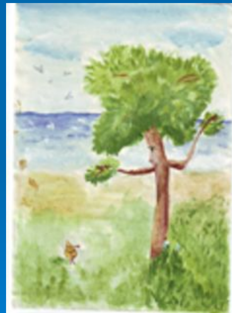
Работа Федуловой Жени, 6 «Д» (2000г.)