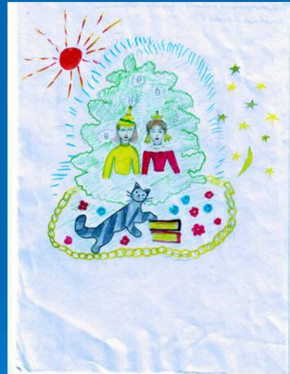
Рисунок Агаповой Валерии, 5 «Б»,(2007г.)