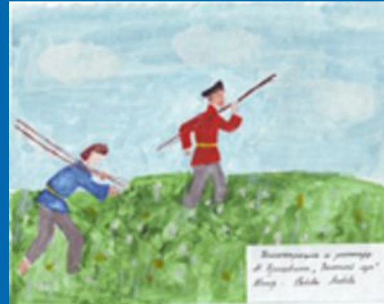
Иллюстрация к рассказу «Золотой луг». Автор – Рябова Люба, 6 «Б» (2004г.)