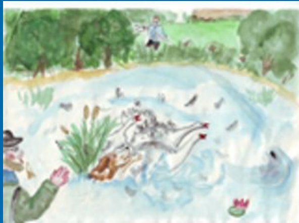
Иллюстрация к рассказу «Вася Весёлкин». Автор – Федулова Женя, 6 «Д» (2000г.)