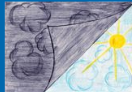
Работы уч-ся 10 «А» класса (2007г.)