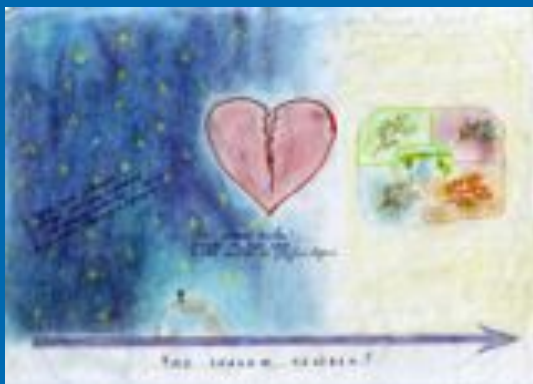
Работа учащихся 10 «Г» класса (1999г.)