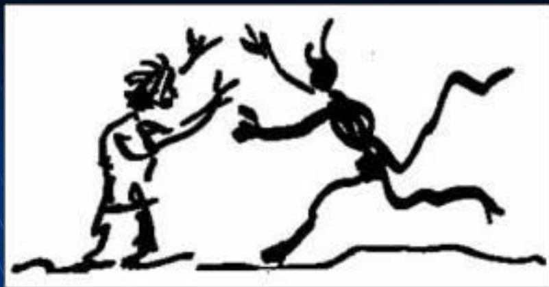
Шарж Пикассо, в котором он изобразил себя и Эренбурга

Во Франции Эренбург жил очень бедно. По воспоминаниям Максимилиана Волошина, «материальное положение Ильи Э. было ужасно. Он ходил, чтобы подработать, ночным носильщиком на вокзал Монпарнас и возил вагонетки до рассвета. При его слабосильности и болезненности — меня это приводило в ужас».