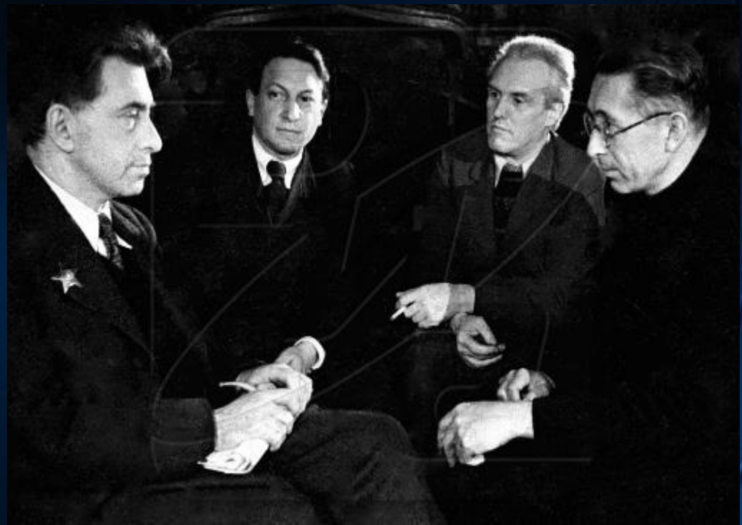
Советские писатели (слева направо): И. Эренбург (1892 - 1967 г. г.), В. Каверин (1902 - 1988 г. г.), Н. Тихонов (1896 - 1979 г. г.), Б. Лавренев (1891 - 1959 г. г.).

После захвата Франции немцами в 1940 г. Эренбург окончательно вернулся в СССР, где начал писать роман "Падение Парижа", первая часть которого вышла в начале 1941 года, полностью роман был опубликован в 1942 г. В том же году роман был удостоен Государственной (Сталинской) премии.