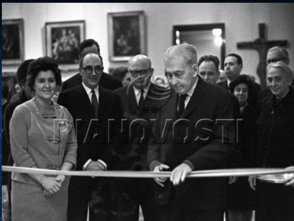
Илья Григорьевич Эренбург открывает выставку произведений Пабло Пикассо в Музее изобразительных искусств имени А. С. Пушкина.

В 1955-1957 гг. Эренбург написал ряд литературно-критических эссе о французском искусстве под общим названием "Французские тетради". В 1956 г. он добился проведения в Москве первой выставки Пабло Пикассо.