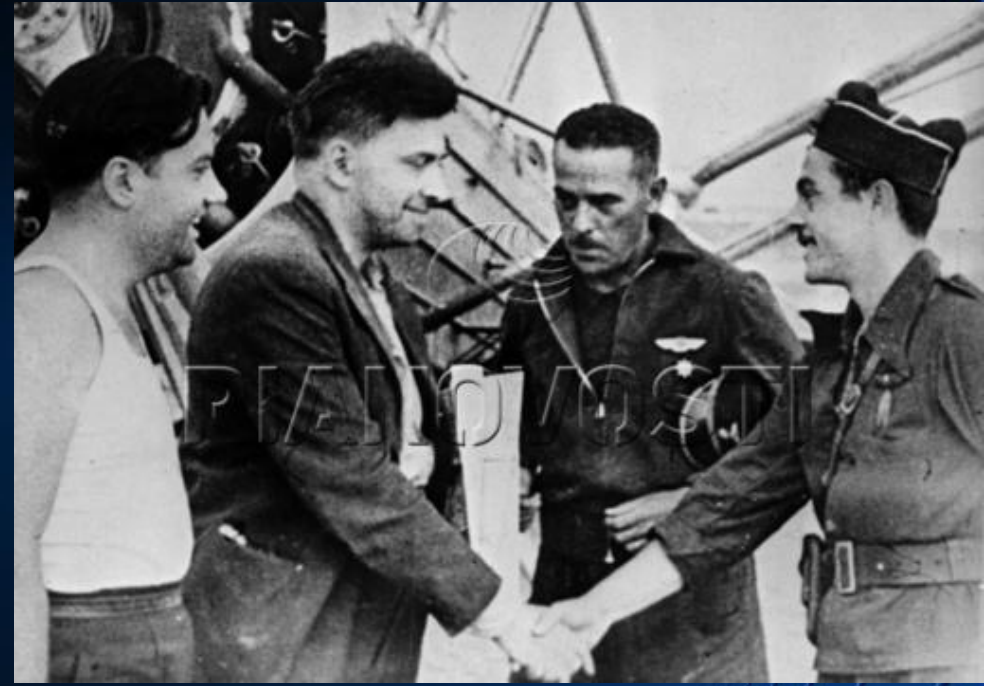
Репродукция фотографии писателя Ильи Эренбурга на аэродроме в Каталонии (Испания).

Сталин - еженедельная газета 25-й смешанной интербригады