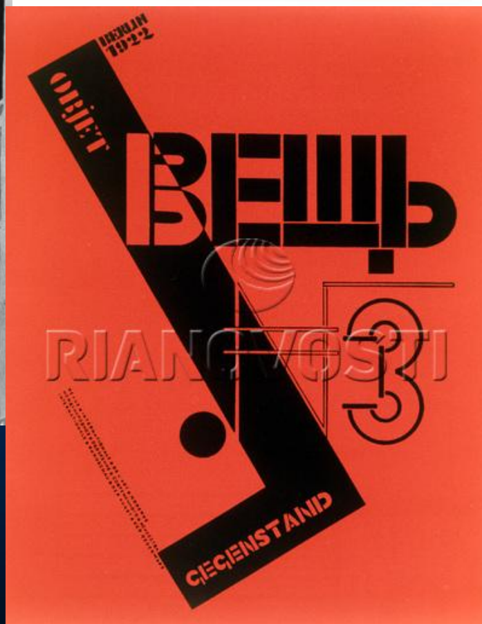
Репродукция обложки международного журнала искусств, основанного художником Элем (Лазарь Маркович) Лисицким и писателей Ильей Эренбургом "Вещь". 1922 год